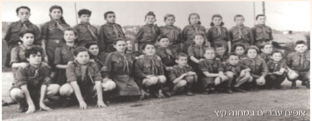
צופים עבריים במחנה קיץ

הם גם לא נרתעו ליטול חלק במסדרים, בטקסים ובחגיגות יום העצמאות הראשון של מדינת ישראל, שנערכו בלוב, ואף הציבו תורנות של משמר כבוד מצדי הדגל, שהונף מעל בנין העלייה בטריפולי.