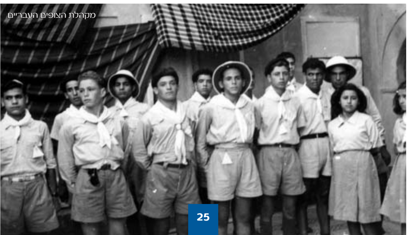
מקהלת הצופים העבריים

מדריכי ובווגרי "הצופים העבריים" נמנו על המועמדים המתאימים להימנות על חברי ארגון "ההגנה" אשר הוקם בלוב לאחר פרעות נובמבר 1945, וידע להחזיר מלחמה שערה בפרעות יוני 1948. בווגרי האגודה נמנו גם על הפעילים והמעפילים בהעפלה הבלתי לגאלית מלוב לארץ-ישראל. וכאשר החלה העלייה הגדולה, היו בין הראשונים לסייע בהכנת הנערים בעליית הנוער, ורבים מהם עלו לארץ עם חניכיהם.