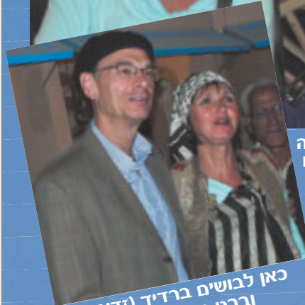
כאן לבושים ברדיד (זדאד) וברט טריפוליטאי