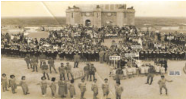
עצרת כללית עם תלמידי בתי הספר לציון שנה ראשונה לעצמאות ישראל בטריפולי 1949

אלול התשס"ט אוגוסט 2009 כתב העת של הארגון העולמי של יהודים יוצאי לוב