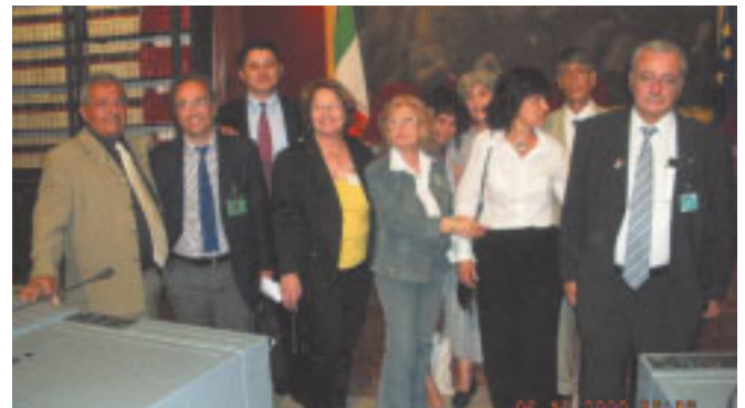
הנציגים בכנס ברומא