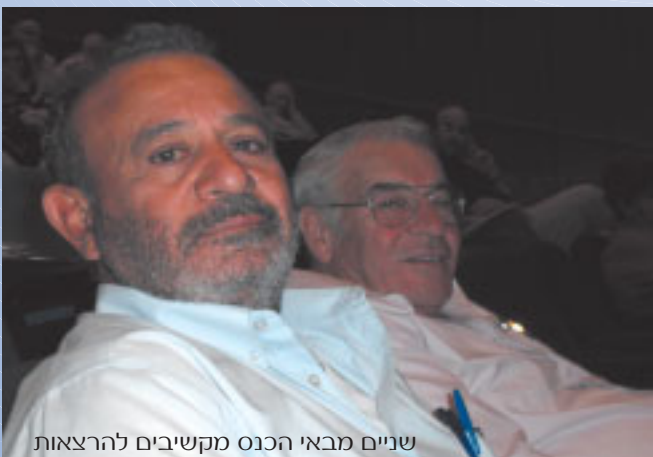
שניים מבאי הכנס מקשיבים להרצאות