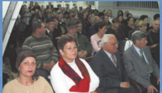
ערב בסיסה במורשת יהדות לוב