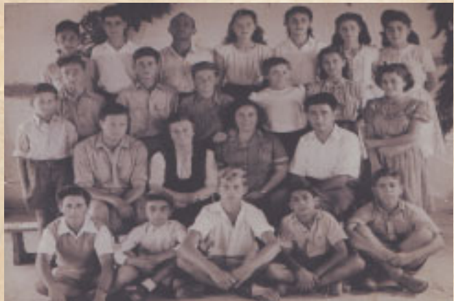
1953. סיום בית הספר לילדי העובדים בשכון היובל (כיום גני תקווה) בני רחם השני מימין בשורה התחתונה

צוות המדריכים במדרשה של הנח"ל היה בנוי מטובי התלמידים שלמדו בשלושה בתי ספר חקלאיים: מקווה ישראל, כדורי ופרדס חנה. חלק מן המדריכים הגיע לשירות אחרי סיום תואר ראשון בפקולטה לחקלאות. הצוות היה מאוד מגובש חברתית ועם רבים מחברי הצוות שהיו בתקופתי, היחסים החמים נשארו עד היום הזה. עם השחרור מן הצבא, מצאתי עצמי מתלבט בין הרצון העז להמשיך ללמוד באוניברסיטה לבין הרצון לעזור להורים במעמסה הכלכלית הכבדה ולאפשר לשלושת אחיותי להשלים לימודיהם התיכוניים ללא דאגה. בודאי לא יכולתי לצפות שמישהו ישלם עבורי את שכר הלימוד או את עלויות שכר הדירה באוניברסיטה. וכך, את שכר העבודה שקיבלתי מן העבודה כעוזר טכני באגף להגנת הצומח השארתי בבית ע"מ לעזור להורים. וחסכתי עוד מעט כסף ע"י עבודות של הרכבה בפרדסים וכרמים שנזקקו להחלפת זנים. לשנה הראשונה הגעתי עם תעודת הברגרות שלי ממקווה ישראל. הלימודים בשנה הראשונה באוקטובר 1960 היו בירושלים. חלקתי חדר שכור עם חבר במרחק הליכה מן האוניברסיטה ואת מימון שכר הלימוד והקיום השתדלתי להשיג הן ע"י ביצוע ניסויי שדה בקיבוץ רמת רחל עבור חברות הדברה ישראליות והן ע"י הדרכת תיירים לתיירות נוצרית עבור צליינים איטלקים בירושלים, בנצרת, בכפר נחום ובסביבת הכינרת.