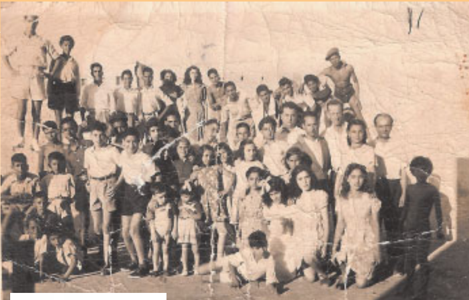
קבוצה משבט הצופים העבריים בטריפולי