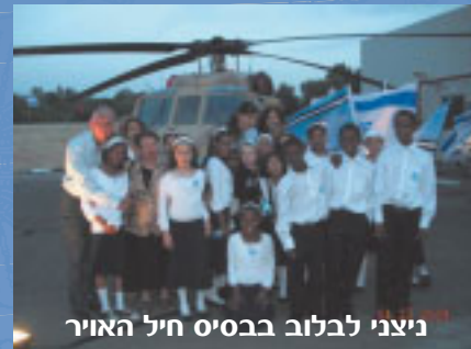
ניצני לבלוב בבסיס חיל האוויר