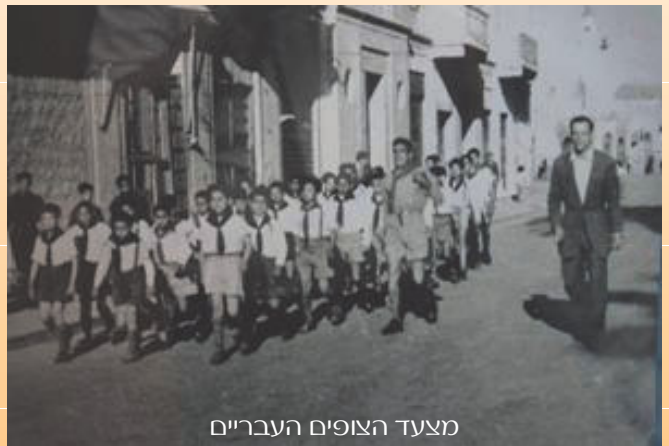
מצעד הצופים העבריים

הבריטים, מתוך כוונה לעודד הקמת תנועת נוער יהודית מקומית בלוב, שלא תהיה לה אוריינטציה ציונית, החליטו להקים את תנועת "הצופים העבריים" בטרפולי. הם הכשירו קבוצת מדריכים, שהיו חברים וותיקים של התנועה העברית "בן-יהודה", ובסיום הכשרתם, לאחר שעמדו במבחנים של מרכז הצופים