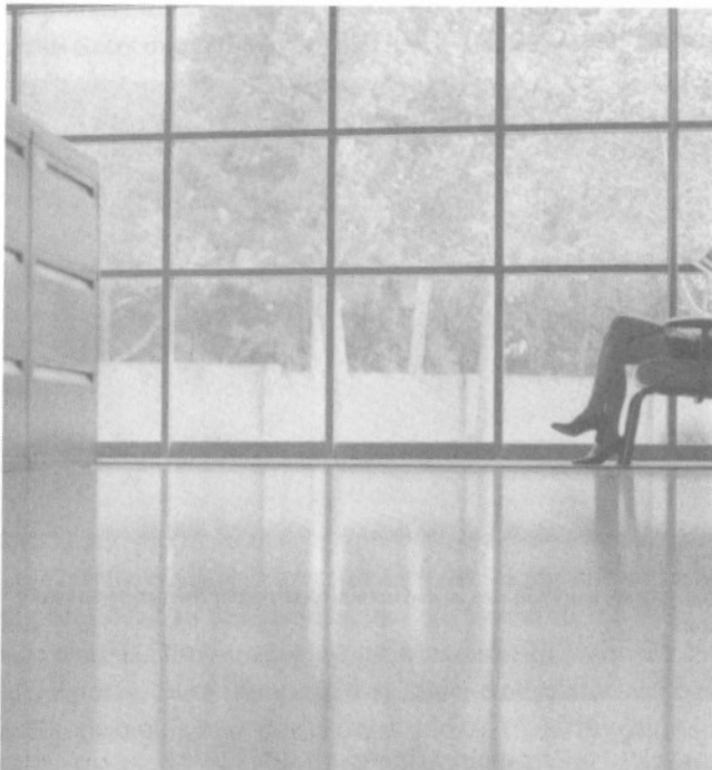
Abb. 2: Kühler Raum in kultureller Neutralität: Jede Möglichkeit zur Identität rutscht an der „Stock Photography“ ab.

zu sehen oder überbelichtet und unscharf fotografiert, ist so doch die Person hinsichtlich ihrer ethnischen Zugehörigkeit nicht identifizierbar (s. Abb. 2). Tauchen mehrere Menschen auf einem Foto auf, werden häufig Statisten verschiedener Ethnien eingesetzt, was vor allem für den US-Markt wichtig ist.