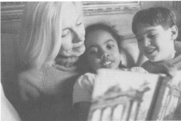
Abb. 1: Das Bild als Ware soll sich zu den unterschiedlichsten Themen verkaufen lassen.

noch eine Chance, aus eigener Initiative gemachte Fotos an die Agentur zu verkaufen, und ein persönlicher Stil ist ebenso unerwünscht wie ehemals im Sozialistischen Realismus oder wie in der Werbung. Aufgrund der Vorgaben, wonach sich ein Foto möglichst oft, lange und weltweit zu verkaufen hat, soll es in seinen Sujets und der Komposition so gehalten sein, dass es als Illustration zu möglichst vielen Themen passt (s. Abb. 1). So könnte dasselbe Foto einen journalistischen Artikel über die Adoption fremdstämmiger Kinder oder aber einen Bericht über rüstige Großmütter illustrieren; ebenso wäre es denkbar für einen Beitrag, der von Vorschulerziehung und frühem Lesenlernen handelt.