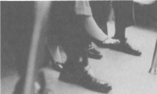
Abb. 3: Das bruchstückhafte Bild ohne Raum und Inhalt hinterlässt den Betrachter orientierungslos.

Vielleicht sind „Stock Photos“ daher sogar die „reinsten“ Bilder, die sich denken lassen, wird an ihnen doch deutlich, was allgemein für Bilder zutrifft - was man sonst jedoch oft nicht glauben will: Bilder für sich alleine haben keine Macht. Bilder bedürfen eines inhaltlichen Rahmens, einer institutionellen Einbindung oder zumindest einer Unterschrift, um zu einer Bedeutung zu kommen. Anders formuliert: Ein Bild ist höchst unselbstständig, der Begriff des „autonomen“ Bildes entsprechend fragwürdig. Erst in Verbindung mit Worten oder einer Umgebung, die klar codiert ist, kann ein Bild auf einmal selbst zu einem Code werden und dann sogar besser als vieles andere dazu dienen, Bedeutungen auszudrücken.