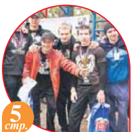
5 стр. Street Workout. Присоединяйся!