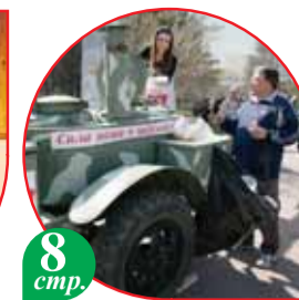
8 стр. Поселку Шершни – 275