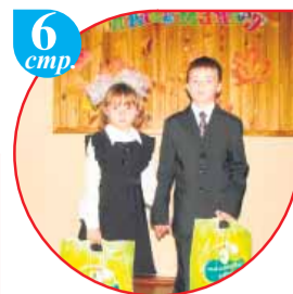
6 стр. Эффективная помощь «СоюзПищепрома»