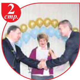
2 стр. Центральный район - наш общий дом