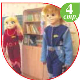
4 стр. Ника и Макс поздравляют первоклассников