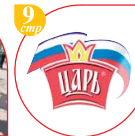
9 стр. Коллекция подарков от Царя