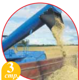
3 стр. Непростая уборочная – 2012