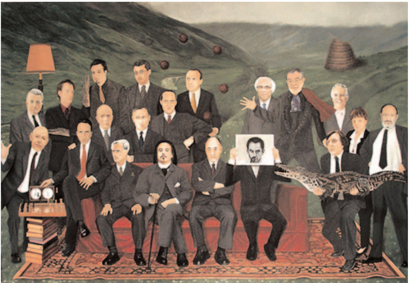
Réunion des "satrapes" du Collège de Pataphysique vue par Arrabal