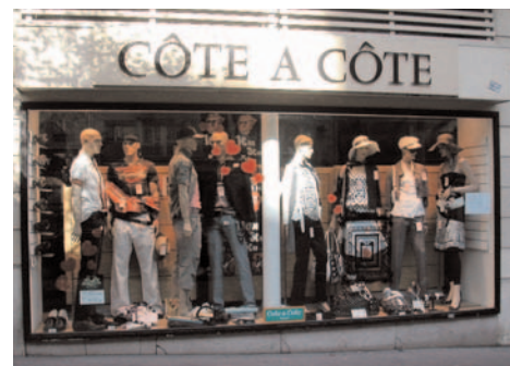
Côte à Côte

N° 1 : angle avenue de Wagram. Boutique Côte-à-côte où depuis plus de vingt ans jeunes gens et jeunes filles s'habillent à la mode et à petit prix.