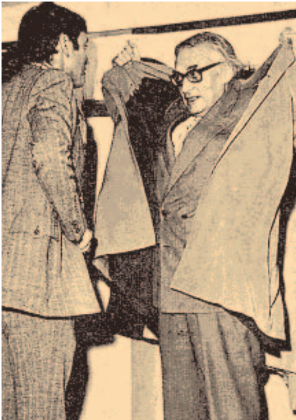
Raymond Queneau expliquant au "régent" du Collège un "mouvement d'enveloppement"