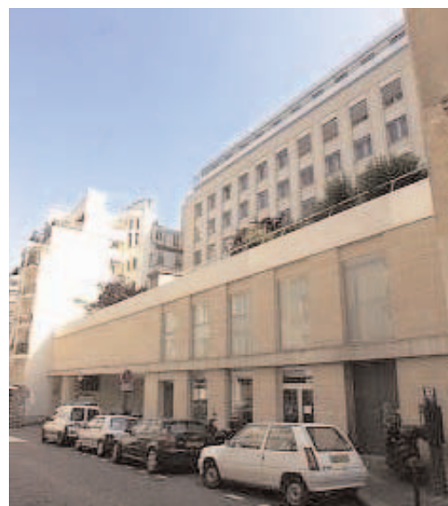
Emplacement de feu le Théâtre de la Comédie Wagram

Alfred Jarry (1873-1907), un des élèves de la classe, s'aperçoit très vite de la fabuleuse importance de cette découverte et, dès son installation à Paris vers 1892, s'emploie à la dégager de sa confusion originelle.