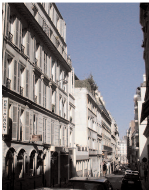
Rue de l'Étoile

XVII e arrondissement. Commence 27, rue de Wagram; finit 20 avenue de Mac-Mahon. Longueur : 220 mètres; largeur 8 m. Ancienne voie de la commune de Neuilly. Cette rue existait déjà en 1842 sous ce nom dû au voisinage de la place portant le même nom.