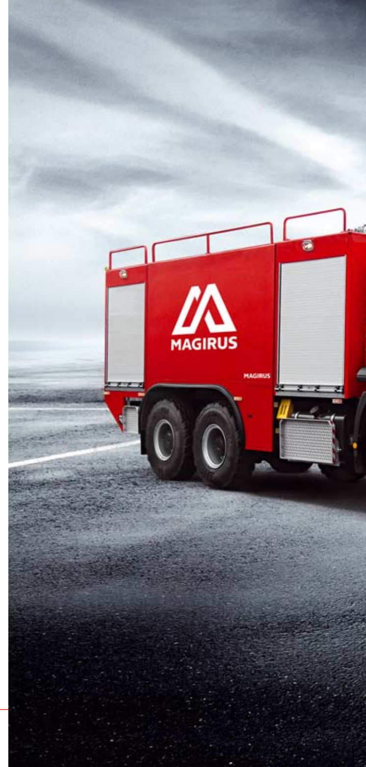
IMPACT X6 und SUPERDRAGON X8

Abgerundet wird das Magirus-Portfolio durch den SUPERIMPACT X6, welcher durch seine NFPA-orientierte Auslegung mit gesteigerter Leistungsfähigkeit gegenüber dem IMPACT X6 auftrumpft.