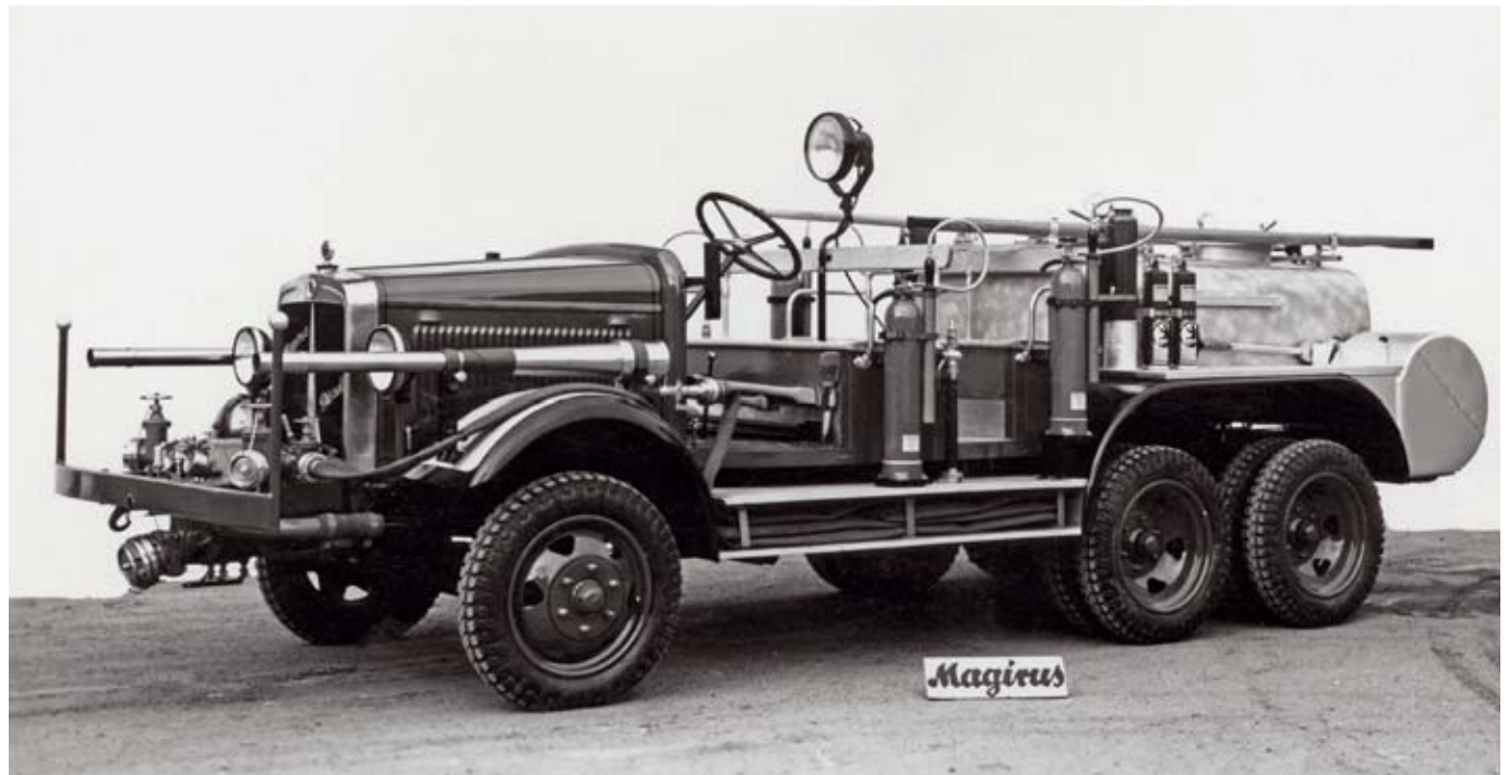
Das erste Flugfeldlöschfahrzeug von Magirus von 1930.

Es sind die Menschen bei Magirus, die Entwickler, Ingenieure, Techniker, Schweißer und Monteure, die für die Qualität aller Magirus-Entwicklungen stehen. Die ihre Hand dafür ins Feuer legen würden, dass jedes Magirus-Flugfeldlöschfahrzeug selbst bei den härtesten Einsätzen durch Zuverlässigkeit und erstklassige Technologie überzeugt.