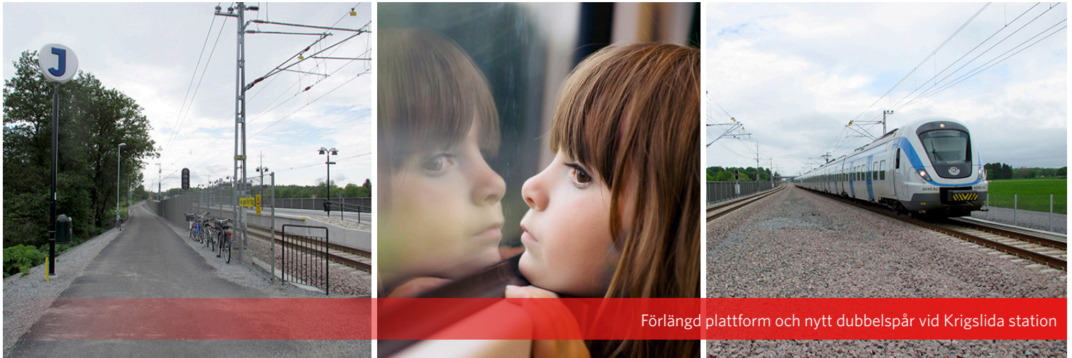
Förlängd plattform och nytt dubbelspår vid Krigslida station