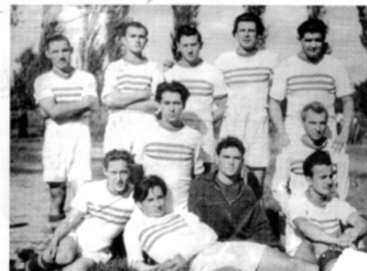
Írta és összeállította: Horváth József 2009