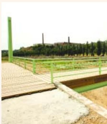
La passarel·la dona accés al torrent de Colobriers i ofereix una via alternativa al pont de Castellar per travessar el Ripoll

La recuperació del parc fluvial del Ripoll ha completat la segona fase del projecte amb la finalització de les obres de protecció i millora dels marges del riu, des de la font de la Teula fins a l'horta del Prat Vell, i la construcció d'una passarel·la al torrent de Colobriers. La nova passarel·la ofereix als ciutadans i ciutadanes una via alternativa per travessar el riu sense passar el pont de Castellar, a l'hora que permet accedir al torrent de Colobriers, un espai de gran valor per als amants de la natura. Les obres han comportat una inversió de 11.665.762 euros i han posat les bases definitives per a la regeneració del parc fluvial del Ripoll, tant pel que fa a protecció del riu, com a la connexió vial del parc i tot el condicionament de les zones d'oci i lleure.