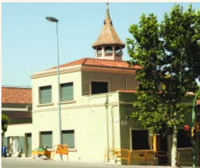
El número 146 del carrer de Vidal acull des del mes de juliol el Centre d'Atenció a la Dona

ES POTENCIARÀ LA VESSANT CIENTÍFICA DEL CENTRE