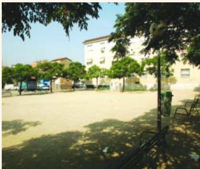
La plaza contará con una zona de juegos infantiles