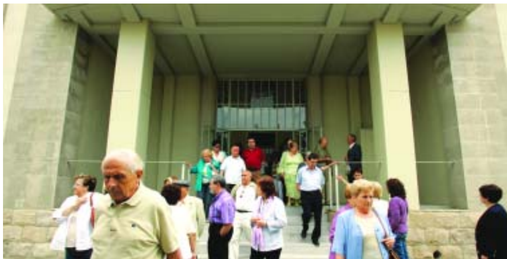
La visita de la DCAT recorrió diferentes puntos de la ciudad

La iniciativa permite a los participantes comprobar in situ si efectivamente se están priorizando las actuaciones que la misma ciudadanía ha destacado en los procesos participativos impulsados tiempo atrás. La visita también permite continuar acercando a