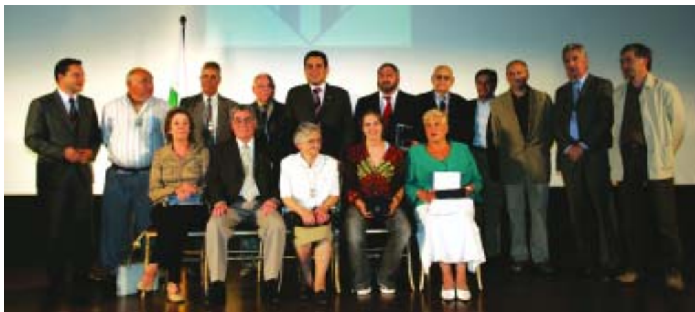
Foto conjunta dels guardonats amb la Medalla d'Honor de Sabadell