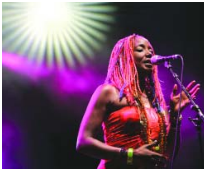
El públic assistent va poder veure una gran diversitat de propostes escèniques

El cicle 30 Nits ha arribat a la setena edició amb un nodrit ventall de propostes artístiques per a les nits del mes de juliol, que han comptat amb l'assistència d'un nombrós públic. El popular festival d'estiu ha ofert prop d'una cinquantena d'activitats diferents per a tots els gustos, que han omplert de música, teatre, circ, dansa, recitals, contes i curtmetratges la ciutat. Enguany ha destacat la bona acollida de dos nous espais a l'aire lliure: l'escenari sobre l'aigua que