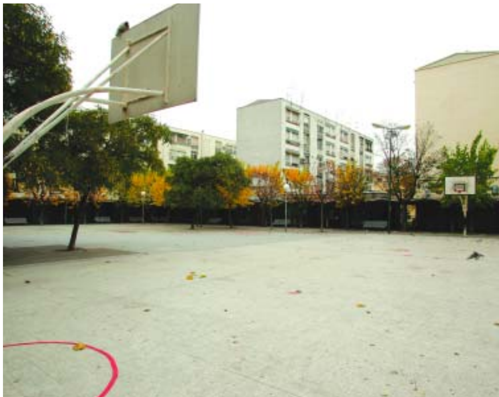
Con las obras, la plaza se convertirá en uno de los principales centros de la vida social de las Termes

El alumbrado se renovará y se instalarán columnas de 12 metros con tres puntos de iluminación cada una de ellas. Junto al alumbrado