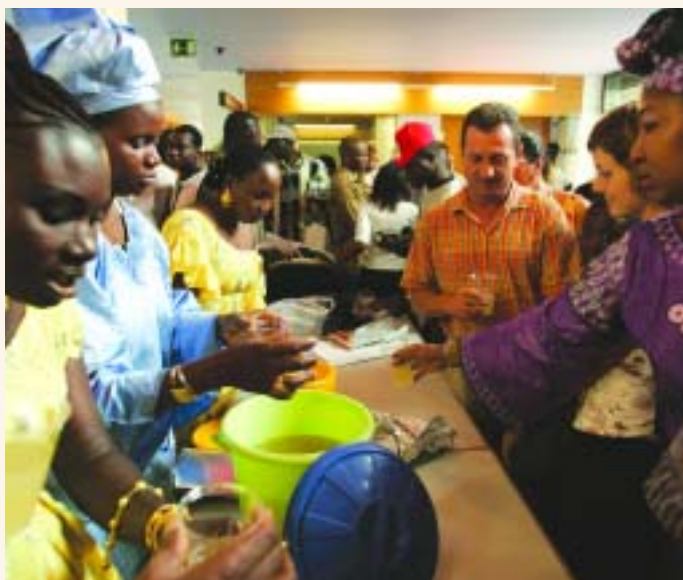
La festa va incloure activitats com tallers de trenes i jocs infantils

espectacles de circ al parc de Catalunya, a més de la dansa que s'impulsa des de Ca l'Estruch, que també va tenir un lloc destacat al festival.