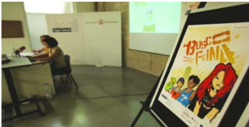
El CD Busco feina permitirá a los jóvenes conocer un poco mejor el mercado laboral

Acceder al mercado laboral no siempre resulta una tarea sencilla. La inexperiencia o el desconocimiento de las estrategias empresariales son factores que acostumbran a surgir en los jóvenes que todavía