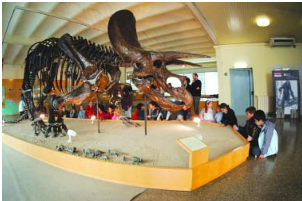
La col·lecció de mamífers fòssils és una de les més importants de tota la península

L'Institut de Paleontologia es va inaugurar l'any 1969, fruit