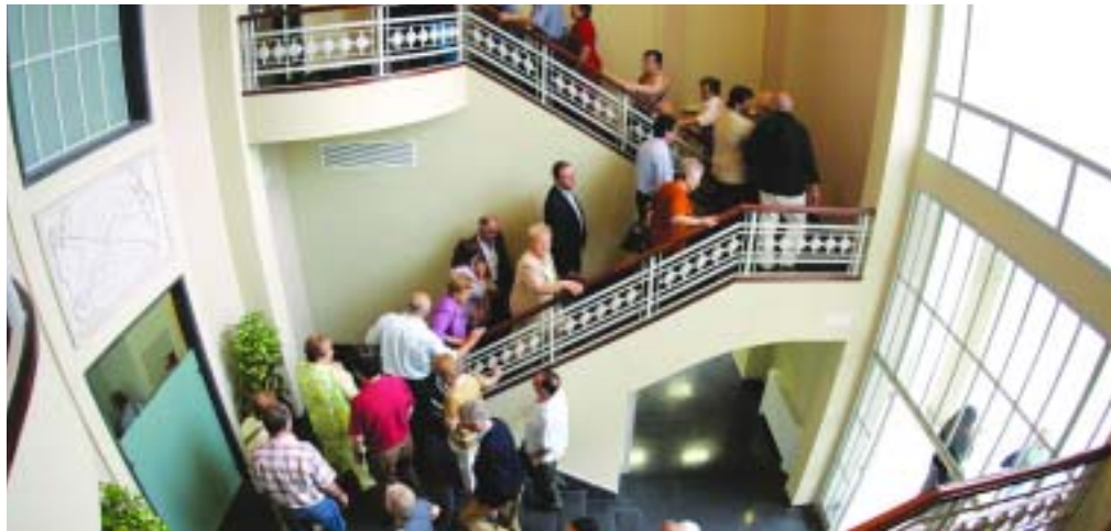
Centenars de persones van assistir a la inauguració

La Creu Alta ja té centre cívic. L'antiga fàbrica de Cal Balsach s'ha recuperat per a la ciutat i, després de passar per un procés de rehabilitació, s'ha convertit en un nou espai social i cultural per als veïns i veïnes de la zona. La reforma, impulsada per l'Ajuntament i consensuada amb la ciutadania, ha costat més de dos milions d'euros. La transformació de Cal Balsach ha respectat els valors