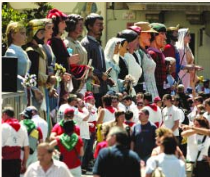
Sabadell, festa i tradició vol donar a conèixer les tradicions populars més arrelades