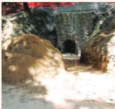
La rehabilitació del forn de calç ha anat a càrrec de 6 participants en un pla d'ocupació

Una nova actuació emmarcada en la recuperació d'elements preindustrials al parc fluvial del Ripoll ha permès restaurar un forn de producció de calç situat a Ribatal·lada. Les obres, que han consolidat l'estructura, han anat a càrrec de 6 participants en el Pla d'Ocupació de Construcció del Vapor Llonch adreçat a persones en atur. Els participants gaudeixen d'un contracte laboral de sis mesos i reben vuit hores de formació a la setmana. L'objectiu dels Plans d'Ocupació és facilitar l'accés al mercat laboral a col·lectius amb més dificultats alhora que realitzen obres i serveis d'interès general i social pel conjunt de la ciutat.