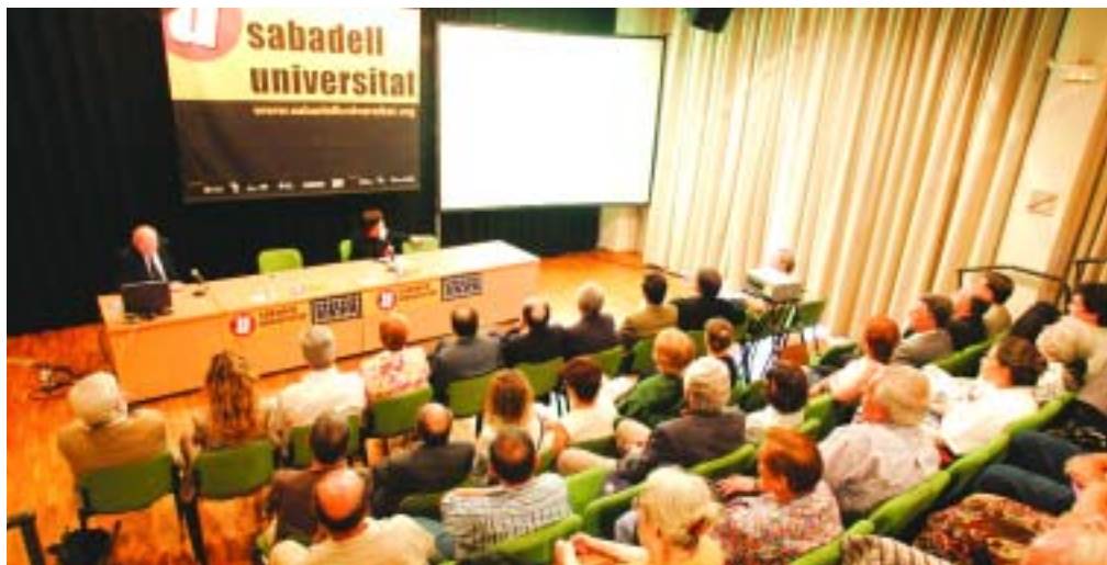
El Casal Pere Quart ha estat l'escenari de la gran majoria dels seminaris

El cicle Sabadell Universitat s'ha consolidat plenament a la ciutat després de 5 edicions. Enguany els cursos han ofert un total de 8 seminaris, impulsats per l'Ajuntament i les universitats vinculades a