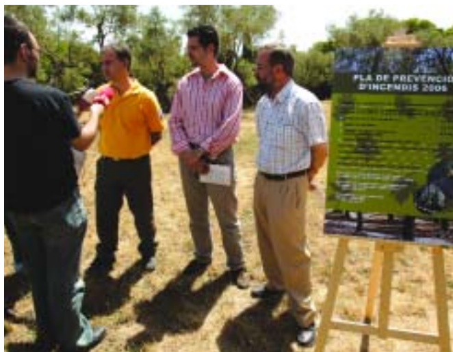
El nou punt de càrrega d'aigua està situat a la Salut i té capacitat per 127 m 3 d'aigua

Des de finals de l'estiu passat s'ha treballat per tal que quan arribi la calor tot estigui a punt per prevenir i extingir els incendis forestals. A banda de l'arranjament de camins i el repàs de