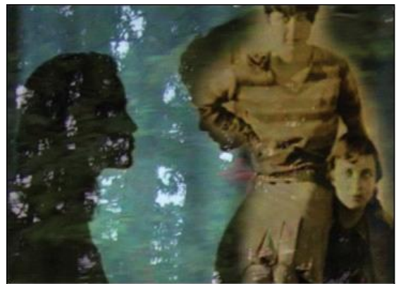
Susanne M. Winterling: As in your Head (2005, Photocollage, 40x50 cm)

Winterling, Susanne M.: Corporate my Lord and Princess (2006, Photocollage, 60x80 cm); White dog watching (2006, Photocollage, 60x80cm); Another Embrace (2005, Photocollage, 20x30 cm); As in your Head (2005, Photocollage, 40x50 cm); The Structure Inside (Photocollage, 2006, 20x30 cm); My Heart Misses a Beat (2005, Photocollage, 40x50 cm).