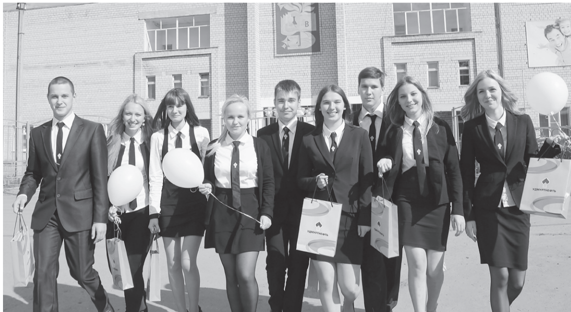
Учащиеся 10-го Роснефть-класса в школе № 12 им. академика В.И. Кудинова в Воткинске.

го национального исследовательского политехнического университета.