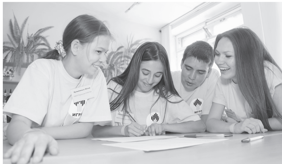
Учащиеся 11-го Роснефть-класса школы № 4 п. Игра.