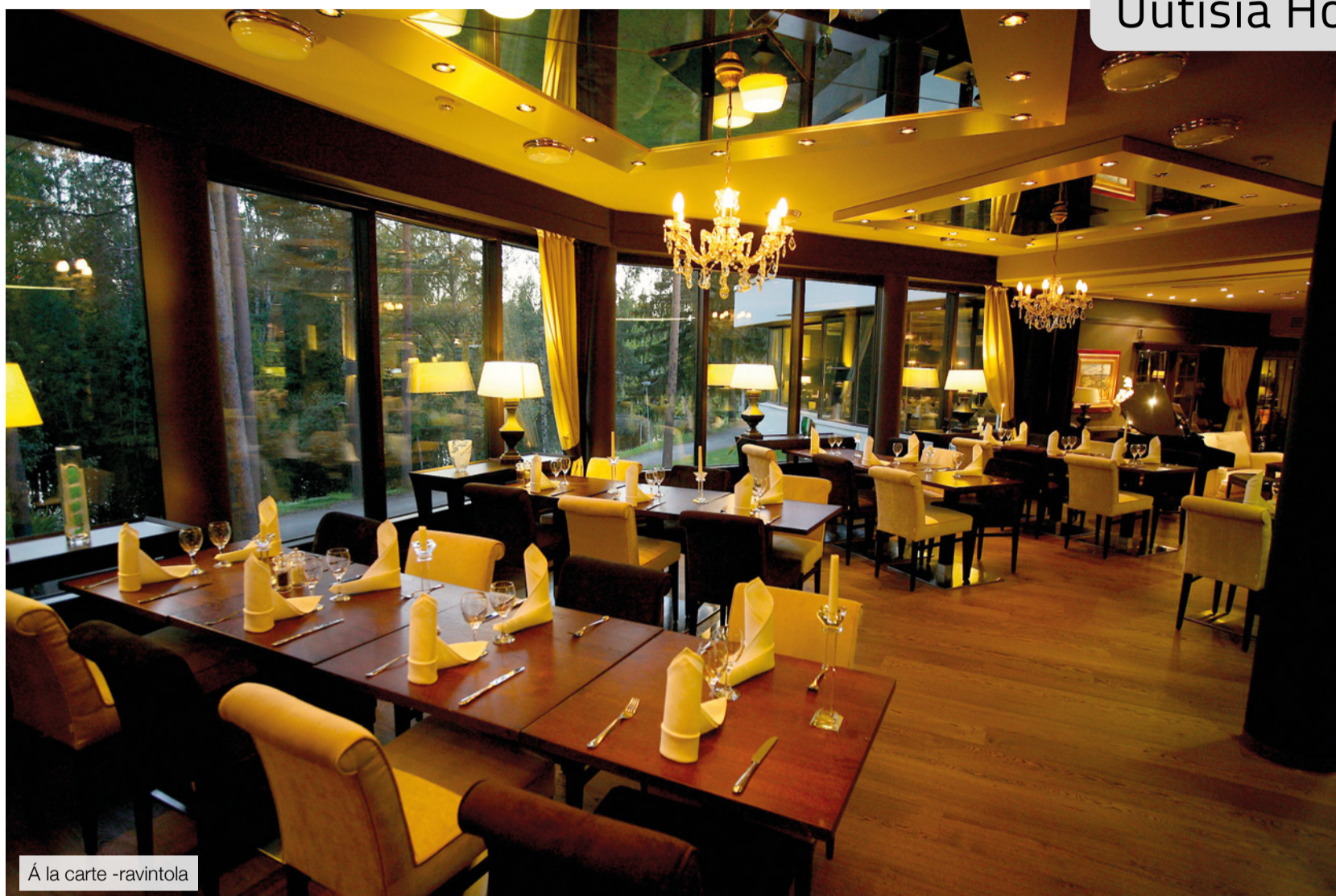
À la carte -ravintola