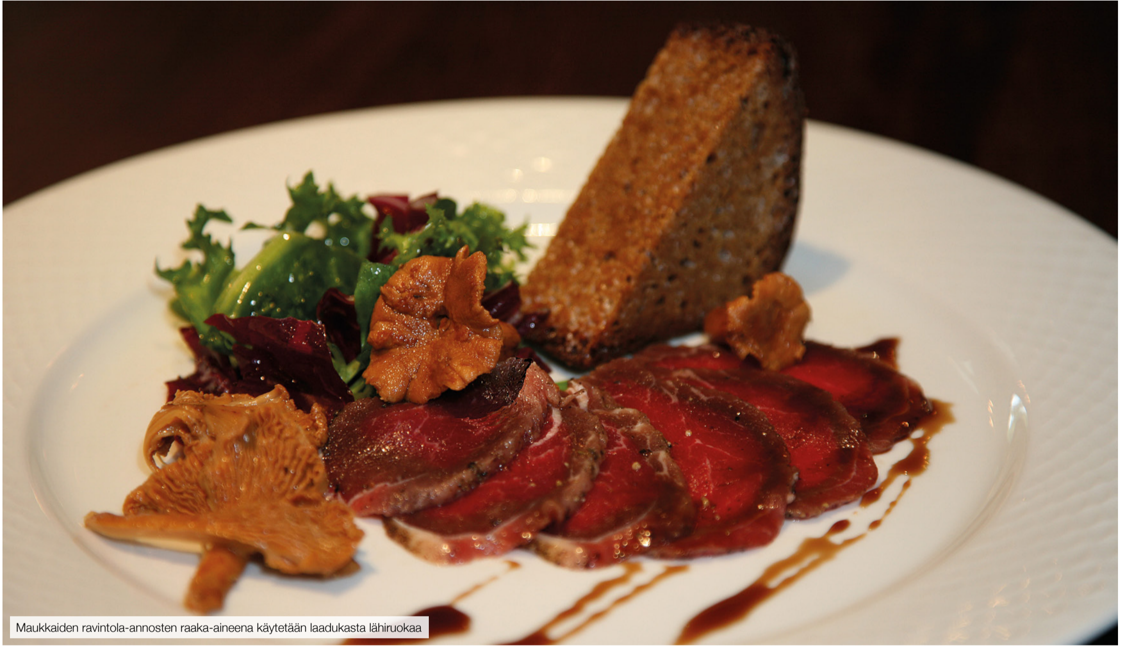
Maukkaiden ravintola-annosten raaka-aineena käytetään laadukasta lähiruokaa