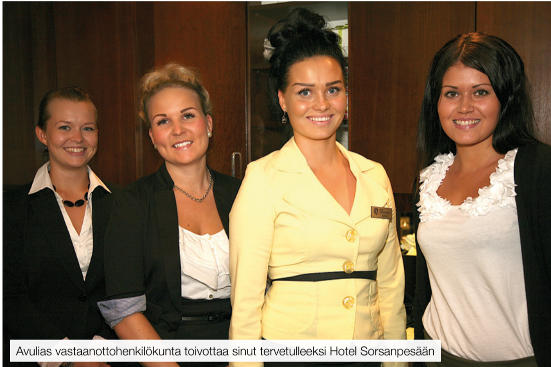
Avulias vastaanottohenkilökunta toivottaa sinut tervetulleeksi Hotel Sorsanpesään