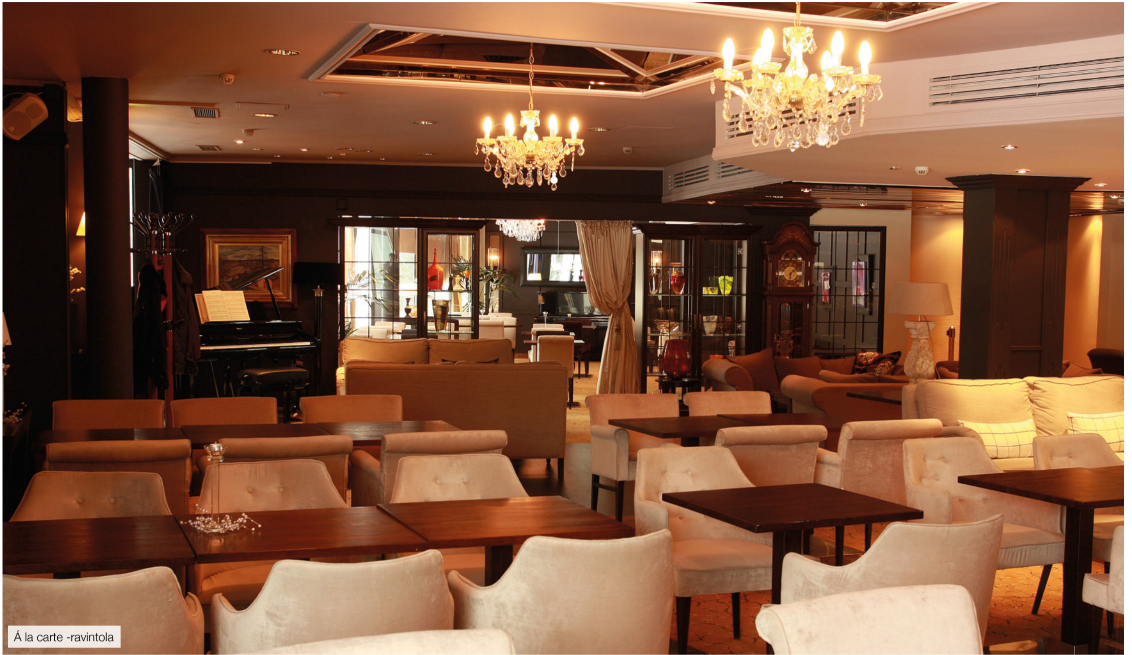
À la carte -ravintola