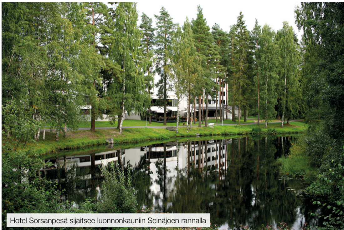
Hotel Sorsanpesä sijaitsee luonnonkauniin Seinäjoen rannalla