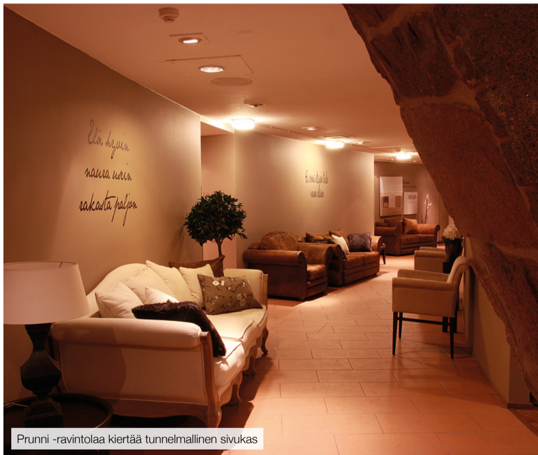
Prunni -ravintolaa kiertää tunnelmallinen sivukas