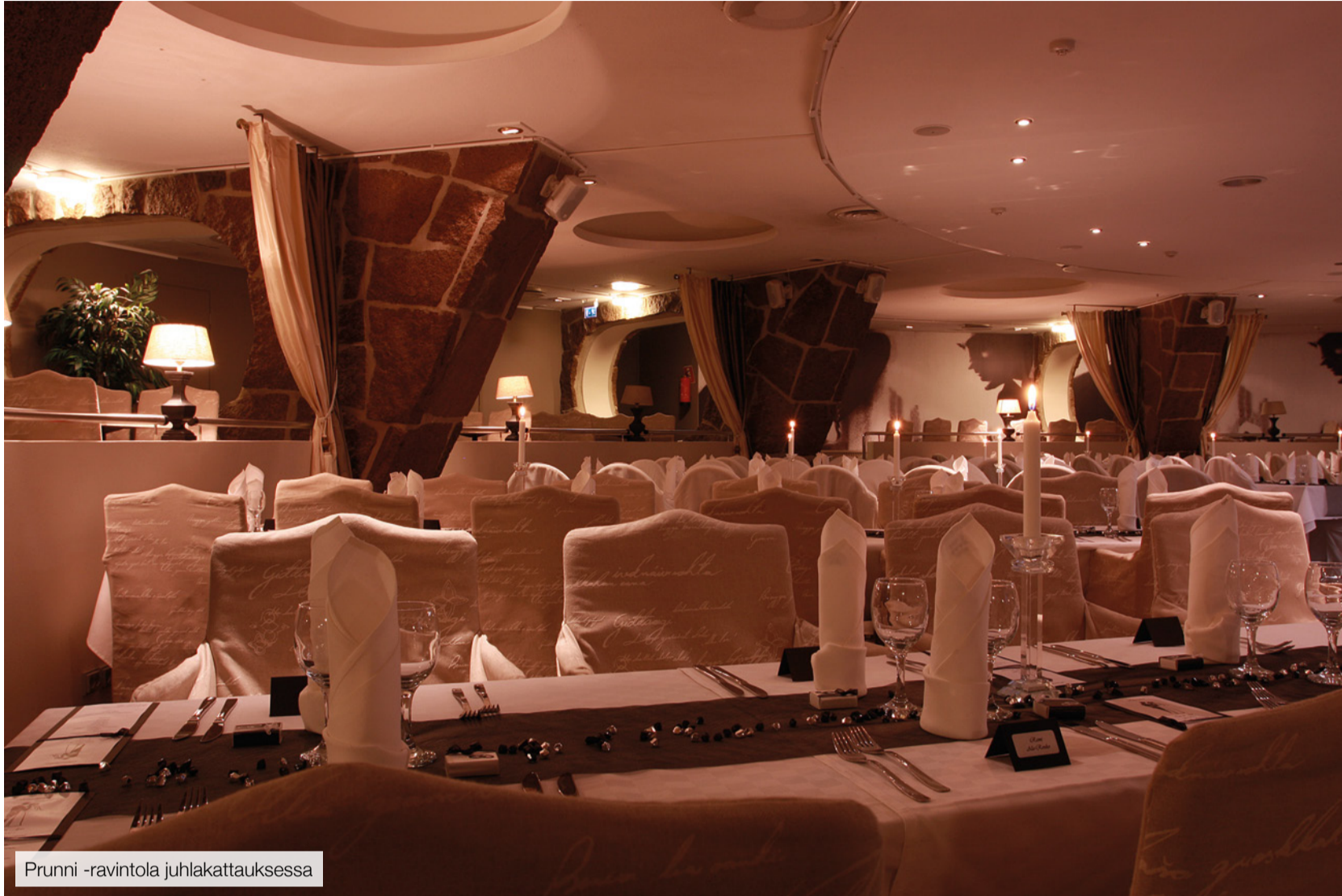
Prunni -ravintola juhkakattauksessa

Hotel Sorsanpesä tarjoaa laadukkaat puitteet ja ystävällisen palvelun juhliisi