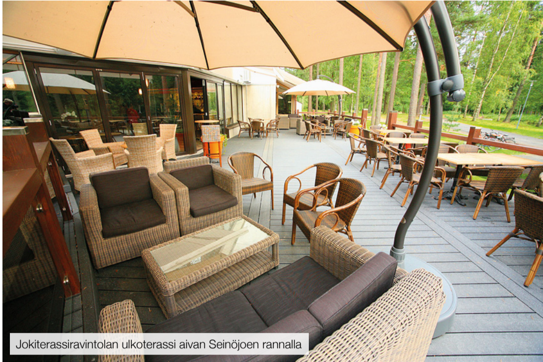
Jokiterassiravintolan ulkoterassi aivan Seinäjoen rannalla