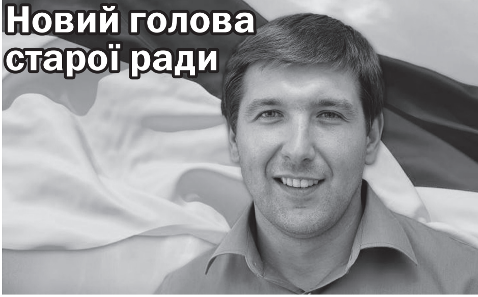
Михайло КИРИЛЛОВ , голова Рівненської обласної ради