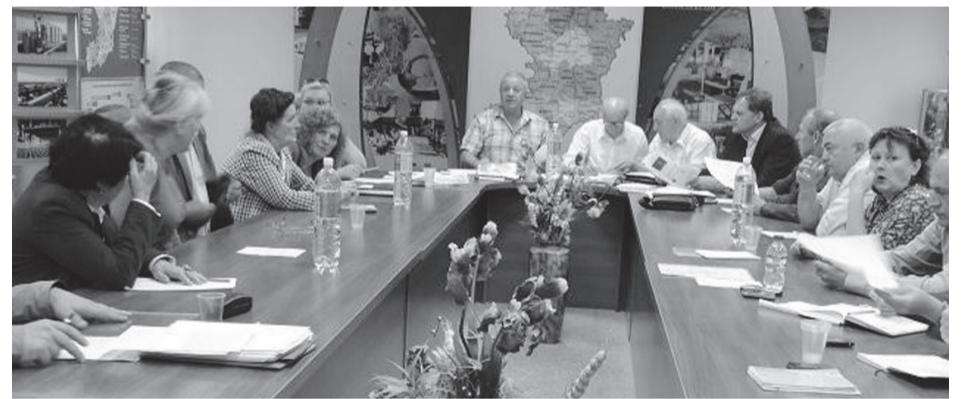
Активісти Люстраційного комітету у Рівненській області

Одна з головних вимог, які висували активісти на Майдані, – люстрація. Саме слово "люстрація" означає "очищення", тобто йдеться про повне очищення кадрів, які зараз знаходяться при владі. Тривалий час сам процес люстрації не мав законодавчих підстав, перше зрушення сталося зовсім нещодавно – 16 вересня депутати Верховної Ради 231 голосом проголосували за прийняття проекту закону №4359а "Про очищення влади".