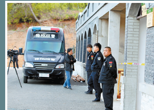
这是4月28日拍摄的发生爆炸事故的抚顺市高湾经济开发区爱山村辽沈战役景区门口。 新华社

【深圳商报讯】据中国网消息,28日下午抚顺官方确认,当日下午2时,高湾经济开发区爱山村辽沈战役景区合成配药房两名从长影聘请的烟火效果师正在用镁粉和高氯酸钾配制烟火效果药品时,药品室发生爆炸。截至28日20时,景区爆炸事故死亡人数上升至7人,其身份均已确定:从长影聘请的烟火效果师2人,抚顺高湾经济区管委会工作人员3人、景区工作人员2人。目前,事故调查和应急处理工作已全面展开,景区负责人已被警方控制。事故原因调查和善后工作正在进行中。 新华社