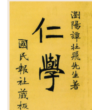
100种书单里,篇幅最短的是谭嗣同的《仁学》。