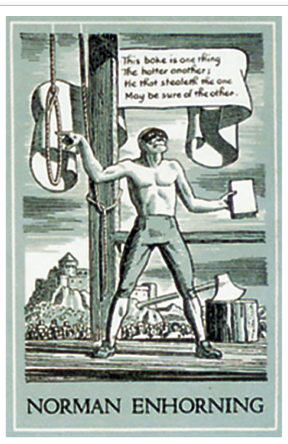
下场唯有被绞死 肯特 美国 10cm 7.5cm 1950年