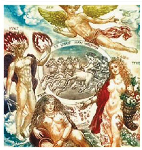
众神聚首 贝克 乌克兰 干刻+飞尘 12cm 11cm 2006年(乌克兰版画家贝克的神话、圣经、人体主题藏书票作品深受藏家喜爱)

藏书票近一百多年成为世界性收藏艺术的一个小分支,从中衍生出多个收藏主题,藏家根据这些主题收藏,交换并邀请版画家为其制作书票,主题涵盖了神话故事、圣经故事、音乐、名人肖像、人体情色等等。对于子安来说,对于藏书票的兴趣不只在收藏,还在于解读:每当淘到一张新的票子都会拈来玩于股掌,细细端详每处艺术符号,尝试寻找藏书票元素与藏书票所表现的艺术思想之间的联系。而他所撰写的解读藏书票故事书籍《西方藏书票》和《藏书票的爱》也成为收藏爱好者眼中的圣经。