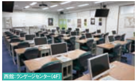
西館:ランゲージセンター(4F)