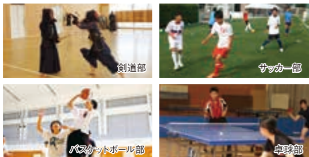
■男子部活動 ■女子部活動