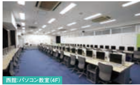
西館:パソコン教室(4F)