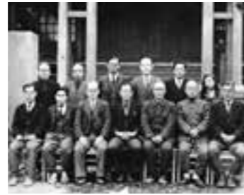
創立当時の教職員

昭和20(1945)年、敗戦の傷跡は濃く人々の心は荒廃し、古い考え方はことごとく否定され、少年たちが心のよりどころとする考え(価値観)も混乱を極めていました。学校も空襲で焼かれ、十分な教育の設備も整わない状況でした。日本の立て直しは「心の教育」にしかないという強い決意によって、23年男子校大濠中学が誕生しました。