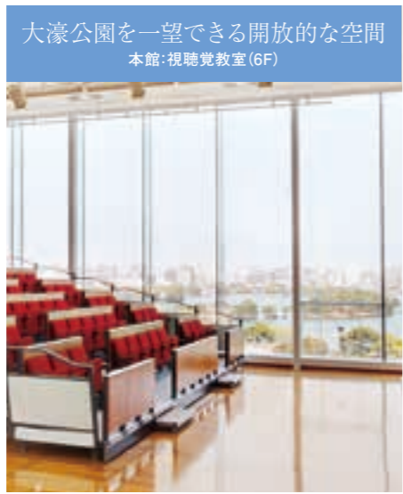
大濠公園を一望できる開放的な空間 本館:視聴覚教室(6F)