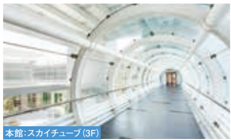
本館:スカイチューブ(3F)