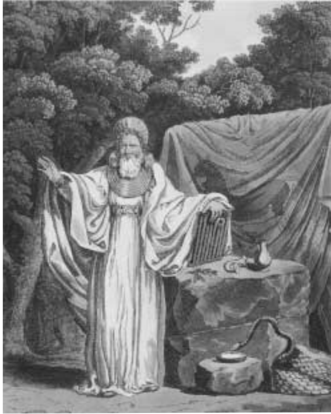
"Arkkidruidi papillisessa asussaan", kuvitusta Samuel Meyrickin ja Charles Smithin teoksesta "Costume of the Original Inhabitants of the British Isles" (1815), sekä Miranda Greenin teoksesta "Exploring the world of the druids" (1997).

samaistamisesta juutalaiseen perinteeseen. 1800-luvun kuluessa tieteen sitoutuminen raamatulliseen aikakäsitykseen heikkeni. Valistusajana oman kansan erityisluonnetta ja paremmuutta muihin kansoihin nähden oli perusteltu vielä pyrkimyksillä osoittaa, kuinka juuri oman kulttuurin esi-isät olivat Abrahamin sukua suoraan alenevassa polvessa. Romantiikan aikana voimistui käsitys luonnollisen uskonnollisuuden ylivoimaisuudesta ilmoitususkontoihin verrattuna. Tässä ilmapiirissä valkoiset kaavut ja Stonehenge pysyivät osana druidismia, mutta heprealaishypoteesi korvattiin eräänlaisella "jalon villin" idealla, jossa druidit nähtiin viisaina luonnonfilosofoina, jotka elivät tasapainossa luonnon kanssa ja olivat sitä kautta yhteydessä jumalaan.