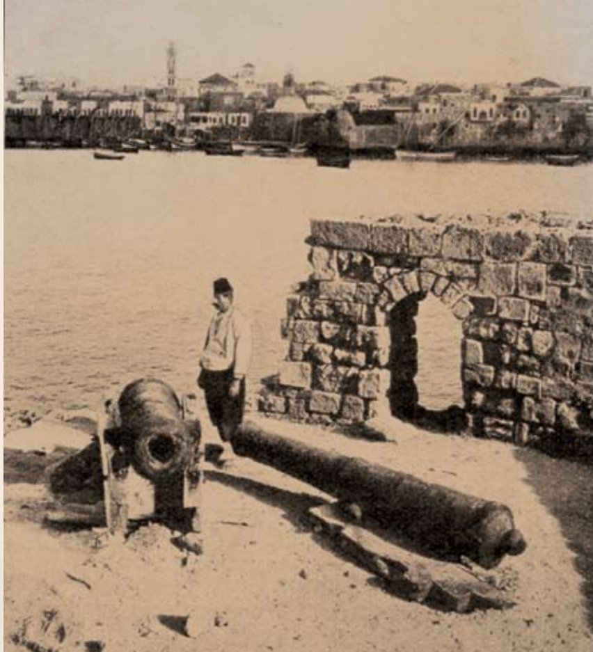
עכו, ראשית המאה ה-20