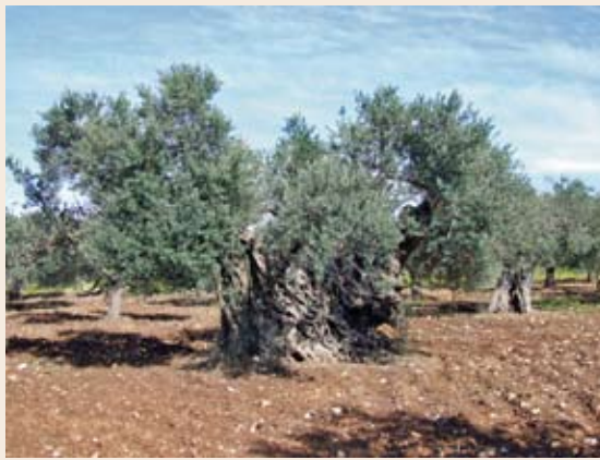
כרם זיתים עתיק, מג'ד אל כרום

המחוז, שישב בביירות. במכתב ששלח אליו פירט גם את שחיתותם של שני הפקידים, תוך שהוא מבקש מהמושל לשמור על הדברים בסוד. למרבה ההפתעה הודלף מכתבו הסודי לשני הפקידים, ואלו הטיחו זאת בפניו בעכו. ואולם הרב אלדאודי לא נרתע, ואמר שאם לא יוסדר העניין בביירות ימשיך ויפנה לבית המשפט העליון של האימפריה העות'מאנית. בזכות עקשנותו החליט המושל בביירות לפטר את שני הפקידים המושחתים, אולם עדיין נותרה בעינה מצוקתה של האלמנה, שלא זכתה בכסף. לפיכך דרש החכם באשי להחרים את הקרקעות שהיו ברשות הרוצח בכפר, ובהן מטעי זיתים ותאנים.