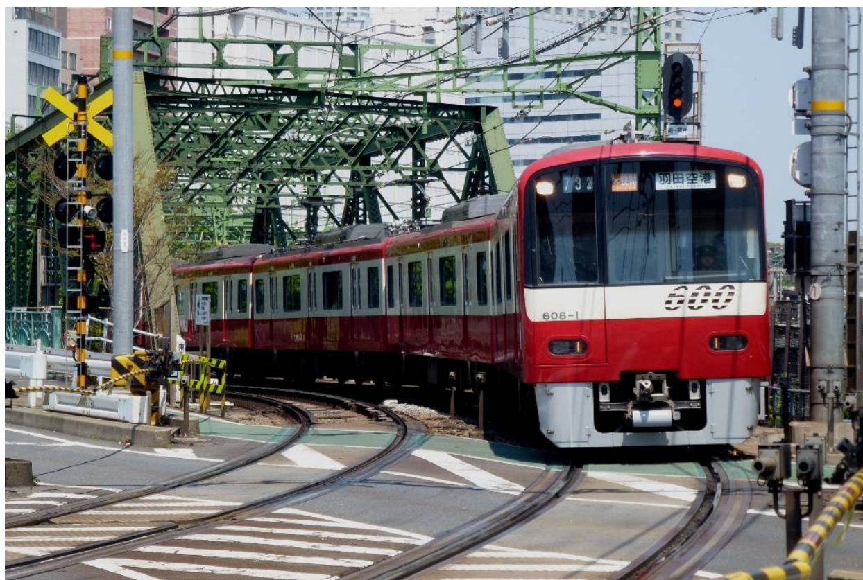
品川～羽田空港ダイレクトアクセスの「✈ エアポート快特」は運転時間帯も拡大！

羽田空港アクセスを中心とした、今回のおもな改正内容については、別紙をご覧ください。