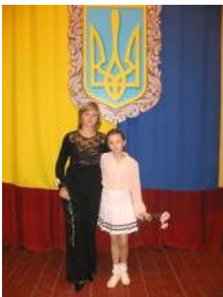
Сімейний ансамбль Тютюнників