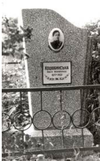
с. Демина Балка