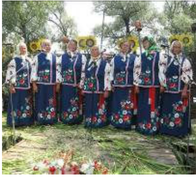
Свята Івана Купала