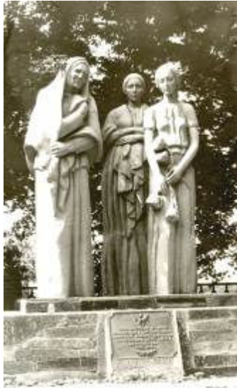
м. Хорол, вул. Дзержинського (1-а могила)