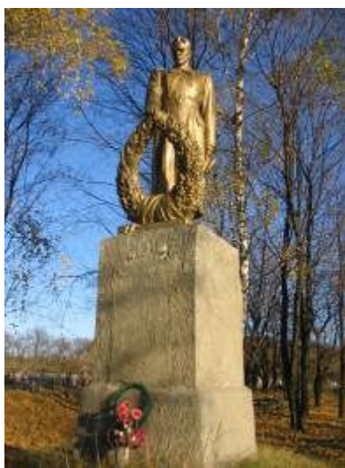
м. Хорол вул. Вокзальна

Братська могила мирних жителів єврейської національності, в якій захоронено 500 чол.