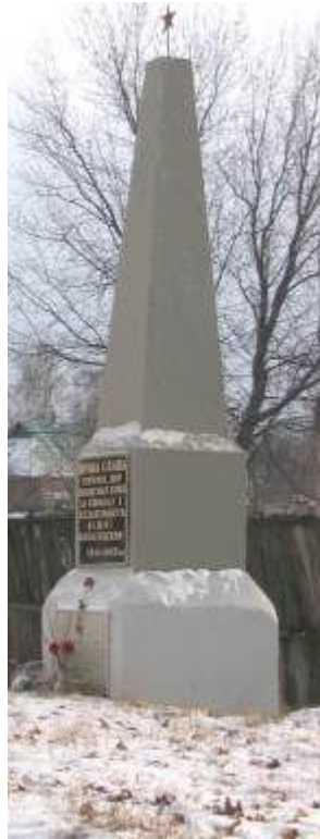
м. Хорол, вул. Дзержинського (2-а могила)