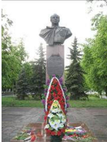
м. Хорол вул. Леніна