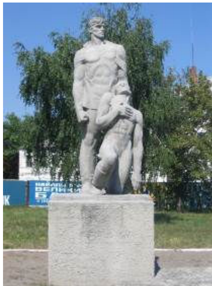
м. Хорол, вул Леніна