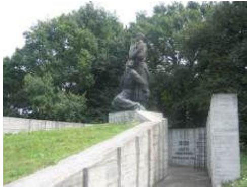
м. Хорол вул. Леніна