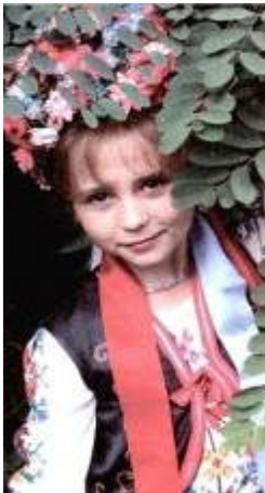
Фестиваль – конкурс "Хорольські зірочки" грудень м. Хорол,РБК