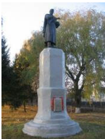
м. Хорол, вул. Вокзальна