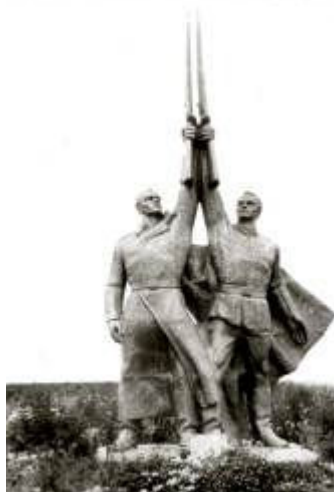
неподалік с. Барилове