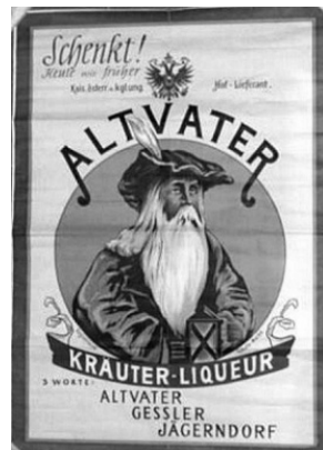
Vizitka firmy s reklamou na Altwater