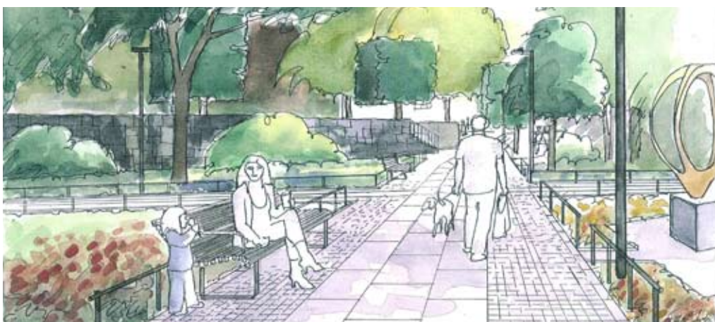
B Gångstråk från Torsgatan genom parken.