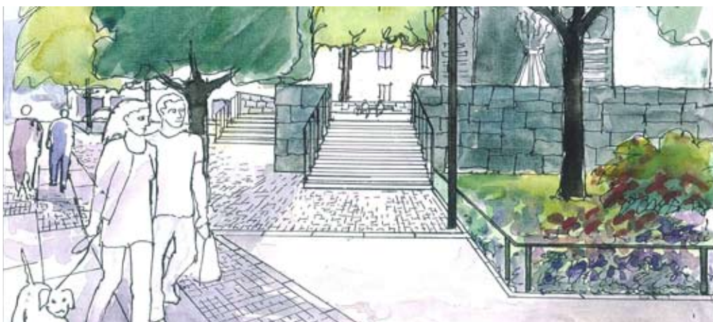
A Ny trappa leder in till platsen för Brantingmonumentet.

Torsgatan ändrar karaktär och blir en trevlig stadsgata med ny bebyggelse på den västra sidan. Gatan kommer att bli tryggare och vackrare med ny belysning, nya träd och gång- och cykelbanor.