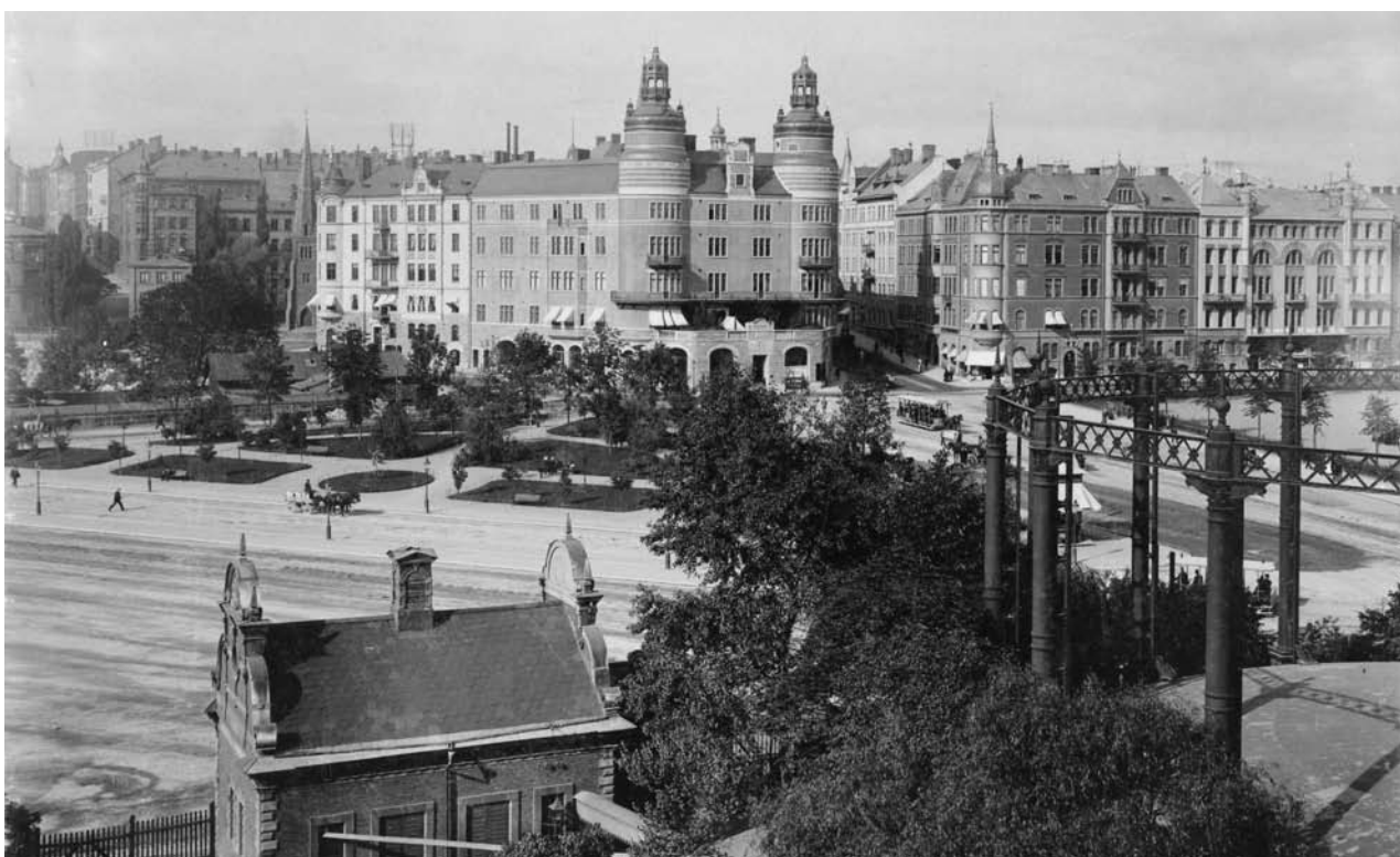
Norra Bantorget 1901. Till höger syns den gasklocka som togs i bruk 1875 och revs 1910. På det runda fundamentet byggdes då en konsertsal - Vinterpalatset - samt butiker. Dessa revs 1978 när LO-s nya kontorsbyggnad uppfördes.

byggdes om till en cirkulationsplats för bussar. 1949 planterades nya lindar på torget och 1950–1953 fick den östra delen av torget sitt nuvarande utseende. Brantingmonumentet sattes upp och marken omkring utformades av Erik Glemme. Ett murverk inramar monumentet och en vacker stenbeläggning mönstrad som ett ”livsträd”. Vattenfontän med belysning, träd, buskar och blommor berikade platsen.