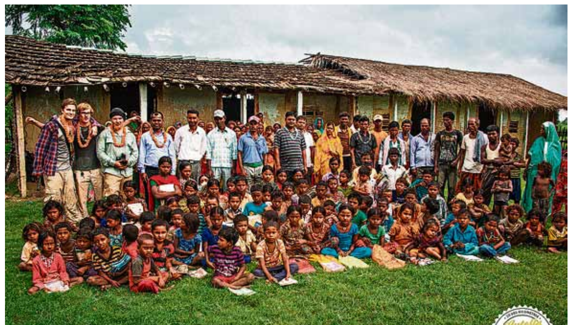
Nepalilainen koulu, jota rahoitettiin projektilla. Heillä on nykyään myös uusi tätä hienompi koulurakennus.