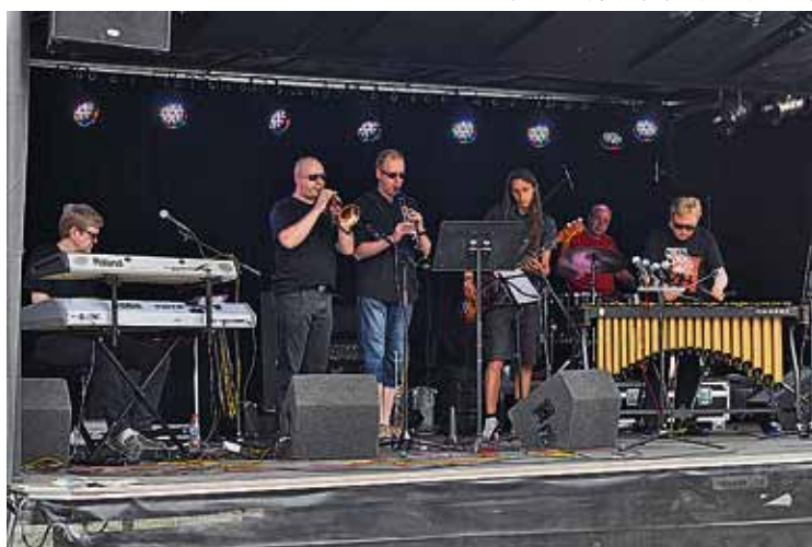
Heavenly Swing koostuu kuudesta muusikosta ja laulusolistista. Kuvassa yhtye esiintymässä viime juhannuksena Keuruulla gospelrekan lavalla.

– En väheksy sellaista evankelioimistystä, mutta näen evankeliumin arvokkaana. Mielestäni se saisi sille kuuluvan arvon, jos maallisen festa-