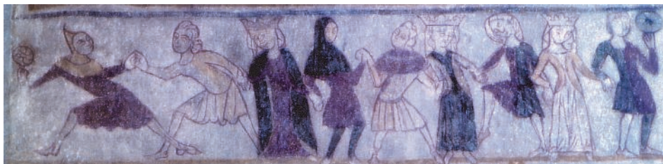
Fig. 4 Overdragten med helvedesvinduer, der var særligt populær i denne periode, var særdeles veleg-