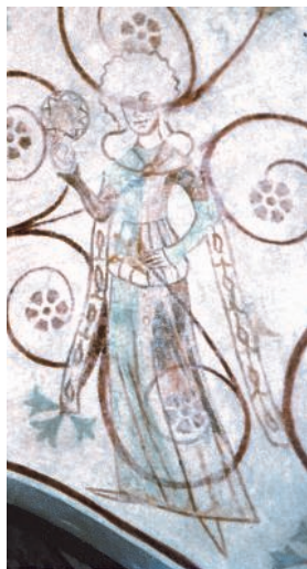
Fig. 5 farvede dragter som eksempler på hovmod, forfængelighed og lignende synder. Fornemme mænd og kvinder i to-farvet dragt ses f.eks. i færd med at spejle sig. I Vester Broby kirke, fra ca. 1375-1400, ses f.eks. en ung moderigtig dame med to-