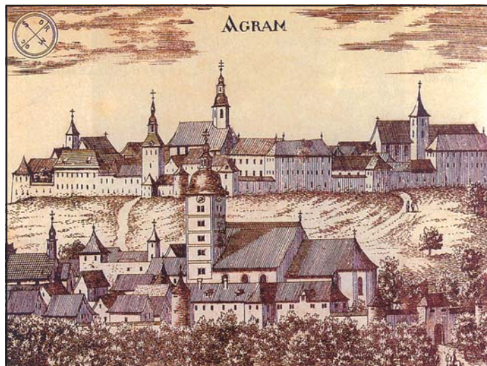
A középkori Zágráb. Metszet részlete

Az uralkodók ritkán keresték fel Szlavóniát. 1412 után sem Zsigmond, sem az utódai nem látogattak a tartományba. Mátyás 1464. évi útját a boszniai hadjárat indokolta, 1466 augusztusában pedig azért utazott Zágrábba, hogy személyesen zárja le a püspökség üresedésének évtizedek óta húzódó problémáját. Ezt követően a király 1480 végén jelent meg ismét Szlavóniában, ezúttal is az oszmánok elleni háború okán. E királyi utazások alkalmat