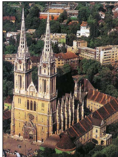
A Szent László által alapított zágrábi püspökség székesegyháza

1466 augusztusában Tuz Osvát foglalta el a zágrábi püspökséget, aki hamarosan Mátyás egyik legfontosabb támaszává vált. Elszántan hozzákezdett a püspökség birtokainak és jövedelmeinek újjászervezéséhez, és hamarosan szembekerült a szlavóniai nemességgel, amely megszerzett pozícióit védelmezte. A küzdelem évtizedekig tartott, és bár a király a jelek szerint őszintén próbált közvetíteni, egyértelműen a püspök pártját fogta. Magatartásának okai elég világosak. A zágrábi püspök volt az ország egyik leggazdagabb főpapja, és így sokkal haszno-