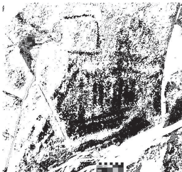
Figura 4. “Embarcación pintada en la cueva Florencio del Sistema Serrano de Ventania” (Oliva, 2000)

Los enterratorios del sitio Gascón 1, los de Baradero, y los de Caepé Malal, así como la localidad arqueológica Amalia en conjunto con los sitios Don Isidoro I y II, habrían sido lugares utilizados frecuentemente por los grupos que