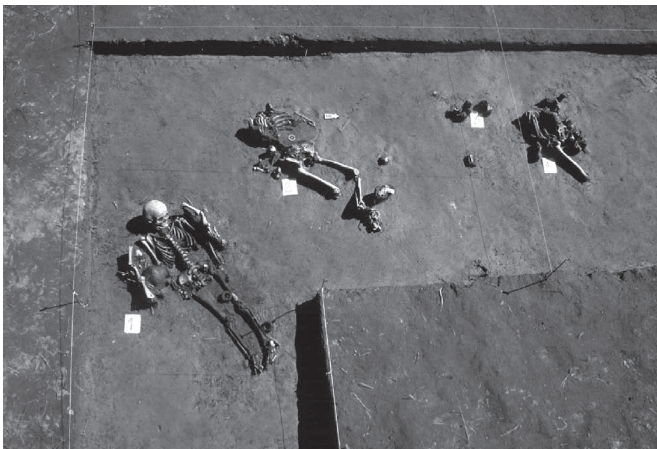
Figura 2 Vista Planta excavación Sitio Gascón 1

como elementos líticos y cerámicos vinculados a estos enterratorios (Oliva y Barrientos 1998, Oliva et. al. e.p).