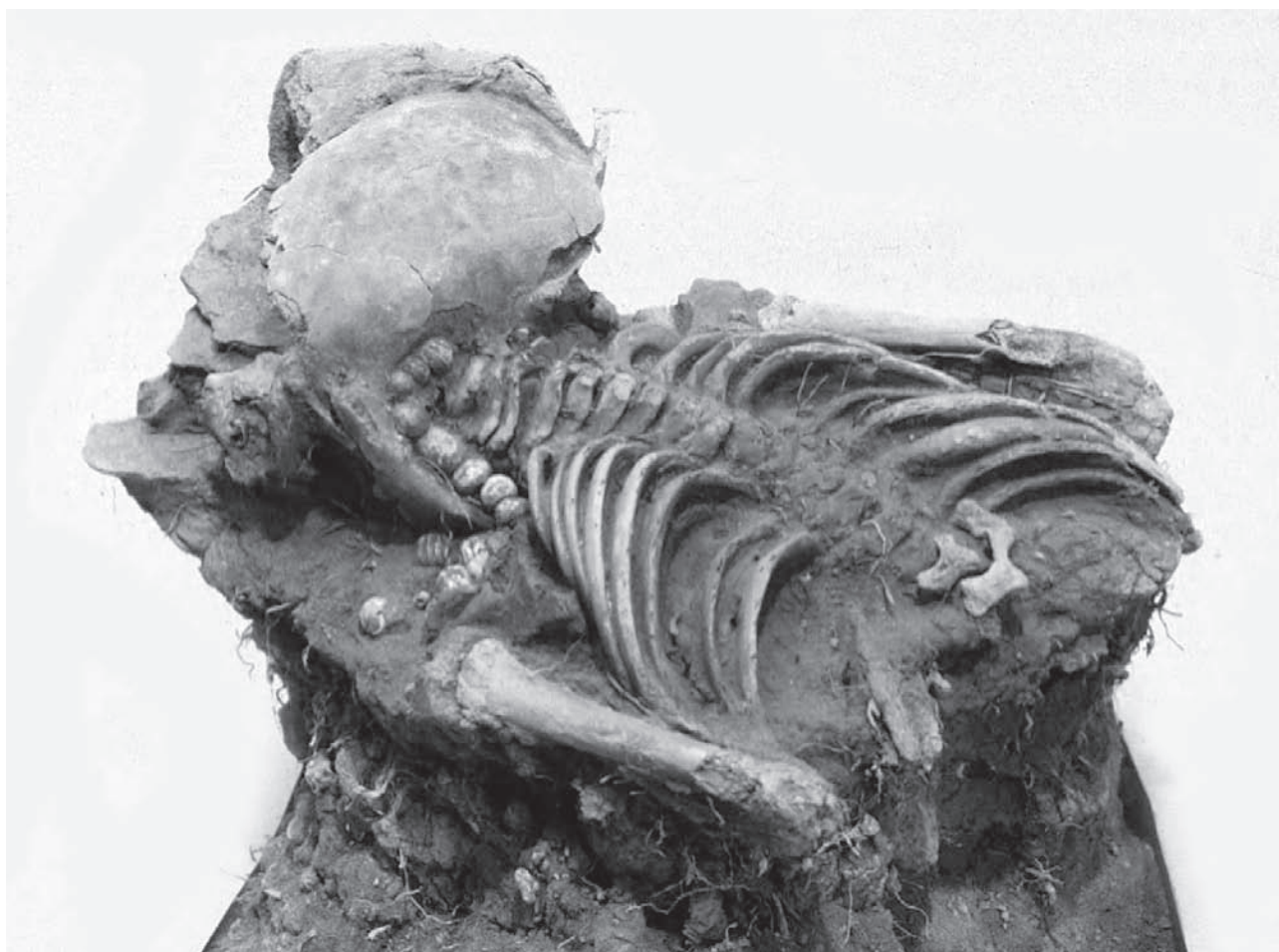
Figura 3: Individuo n° 5 presenta en la zona del cuello un collar elaborado con cuentas vítreas

Los sitios Don Isidoro 1 (DI1) y Don Isidoro 2 (DI2), presentan evidencias de las relaciones interétnicas que se estaban dando en las fronteras al sur del Río Cuarto, asignados temporalmente a los siglos XVII-XVIII, presentan en su registro arqueológico, cuentas vítreas venecianas similares a las halladas en Gascón 1. El sitio DI 1 más tardío aún correspondería a un asentamiento ranquel de fines del S. XIX, presenta en su registro cuentas vítreas venecianas azuladas, similares a las halladas en Gascón 1. En el sitio DI 2 se pudo excavar un fogón estratificado y determinar un área de actividades domésticas; la ocupación de este sitio fue datada relativamente en base al análisis de restos faunísticos, artefactos líticos, cerámica, cuero, metal, loza y vidrio como un asentamiento de fines del S. XIX (Tapia 2002).