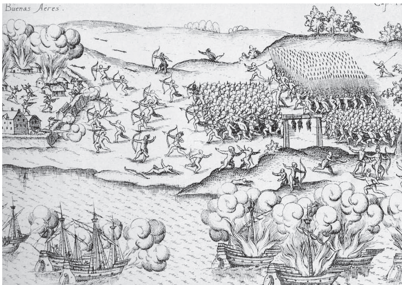
Figura 1 "Indios atacan Buenos Aires". Schmidel (del Carril 1992:19)

sobre territorios, entrega de cautivos e intercambio de bienes.