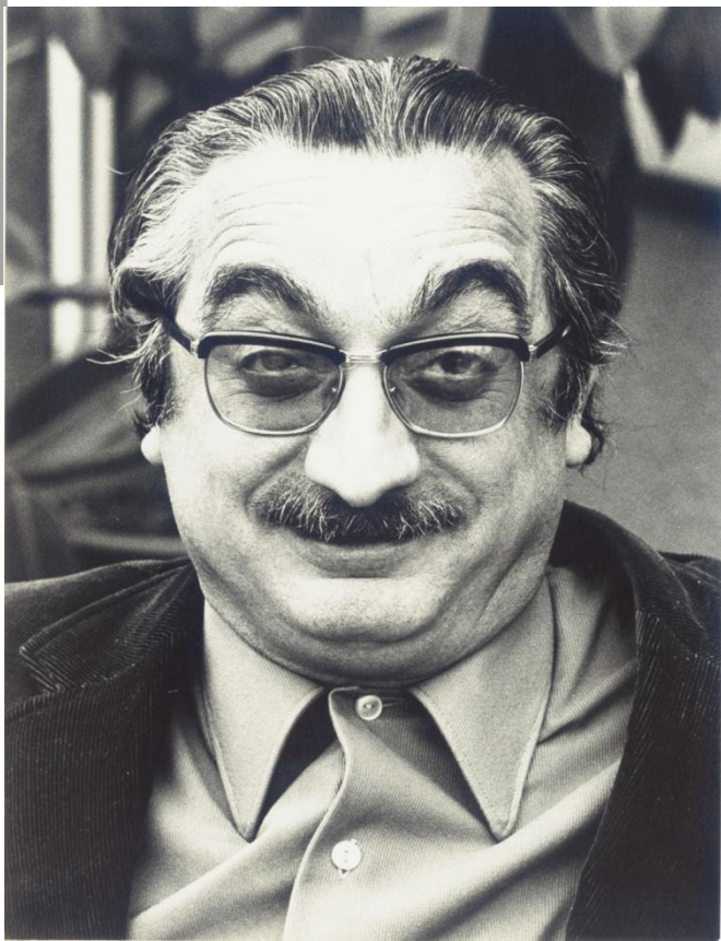
Joan Fuster, Josep Pla i Ma Aurèlia Campmany

Per acabar una sala que és una instal·lació conceptual construïda a partir d'una setantena de fotografies (18x24), que recobreixen les quatre parets i fan que el visitant es capbussi en un remolí d'imatges. Les fotografies estan endreçades en un muntatge espectacular: des de la generació dels que van viure la guerra (Teixidor, Riquer, Boix i Selva, Maurici Serrahima), fins a les noves generacions (Josep Termes, Ricard Bofill, Quico Pi de la Serra, Xavier Corberó, Montserrat Roig i Gabriel Garcia Márquez i Mario Vargas Llosa, quan vivien a Barcelona), passant pels escriptors de la postguerra (Pedrolo, Perucho, Sarsanedas, Espinàs, Capmany) o els intel·lectuals compromesos del realisme social (Molas, Castellet, Vallverdú, Candel). La instal·lació posa l'accent en l'efecte multiplicador de la cultura: dels primers grups resistents, al gran moment de la cultura catalana en el pas dels anys seixanta als setanta.