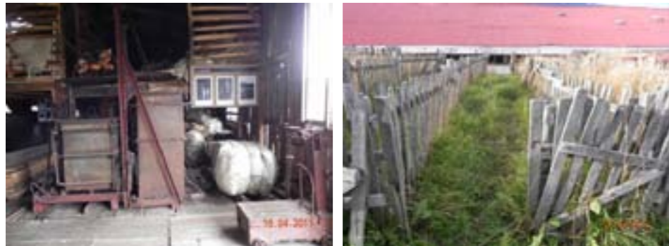
Galpón de esquila / Sector de corrales