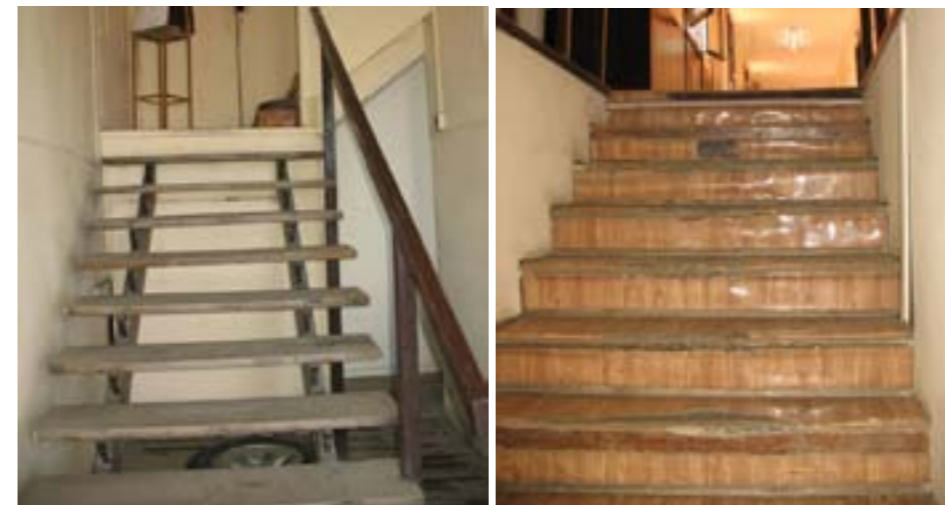
Escalera Interna h/ P.A. 1° tramo / Escalera Interna 2° tramo

Este tema ha sido informado en oportunidad por mi a la CNMMLH y por ésta a la Gobernación, sin éxito alguno (2010/11/13) Comparar con fotos tomadas por el Arq. Alonso en visita dic. 2013