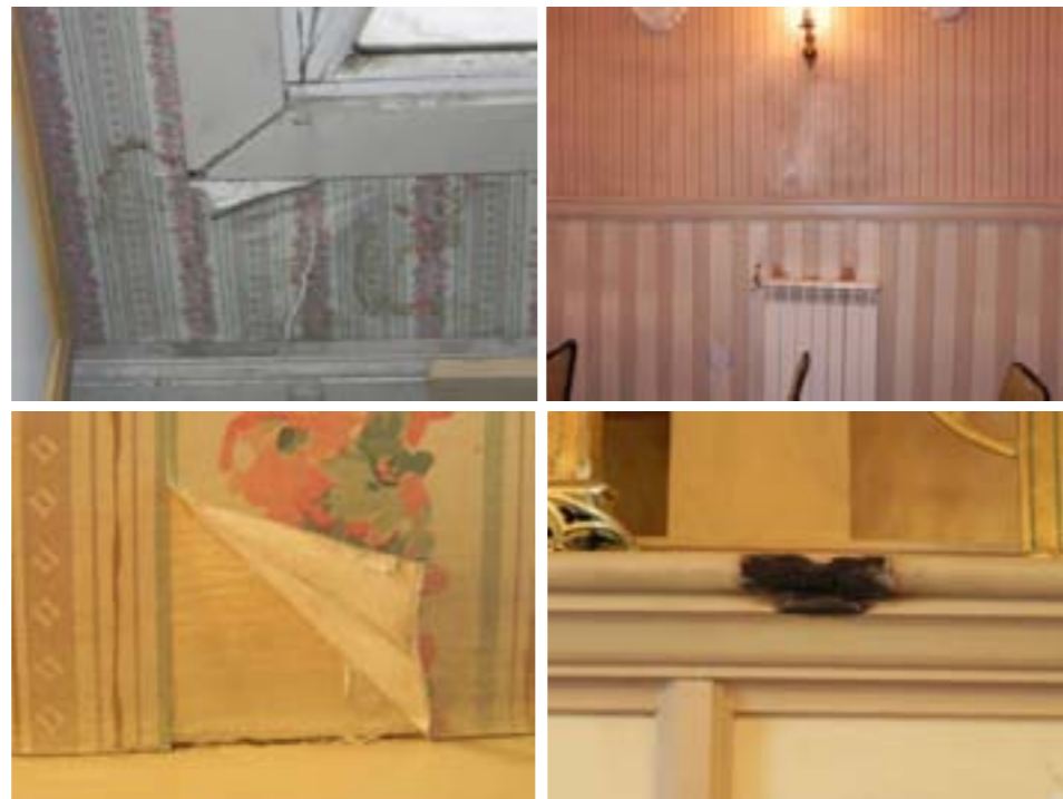
Algunos sectores internos en mal estado presentado en proyecto año 2011-2012 a la espera de resolución por la DNA de las tareas propuestas.