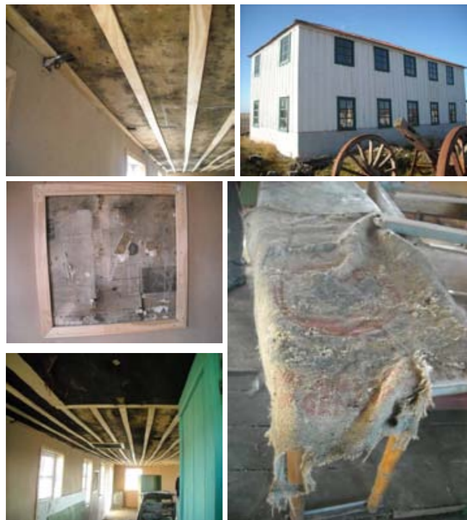
CASA DE LA MISIÓN Intervenciones año 2006/7(MOP) / Fotos 2012 – Criterios adoptados...?