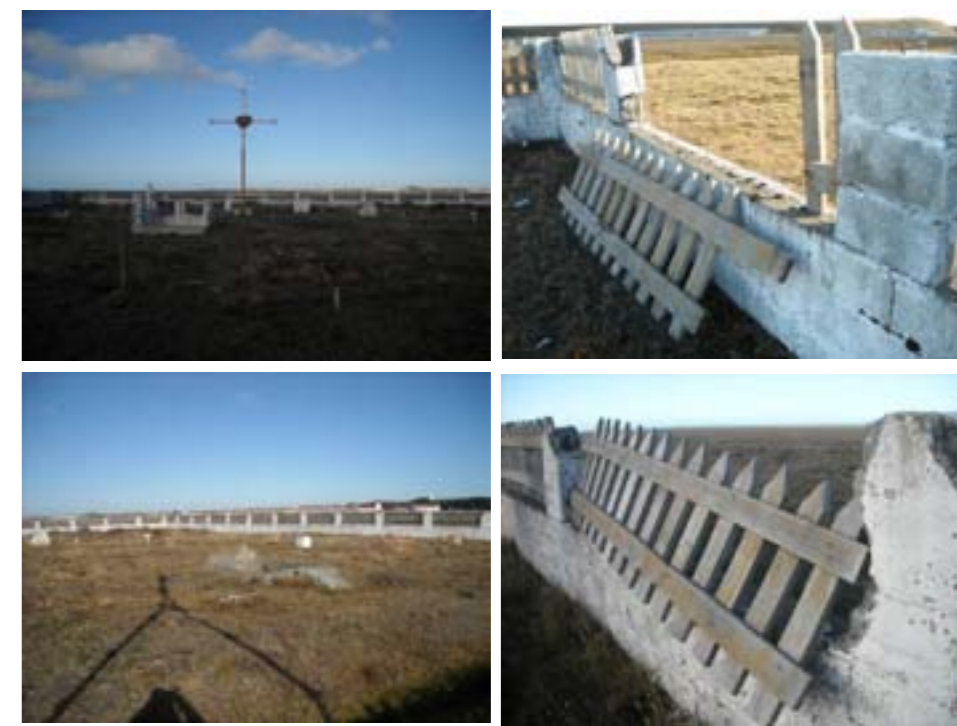
Espacios Exteriores –...vandalismo?