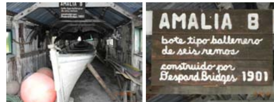
Edificios, arquitectura y paisaje que conforman el casco de la Estancia