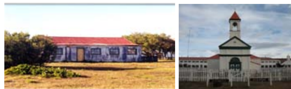
Foto del Asentamiento de la Misión Salesiana de Río Grande - 1914 / Casa de la Misión / Taller de las Hermanas / Frente de la Capilla Histórica