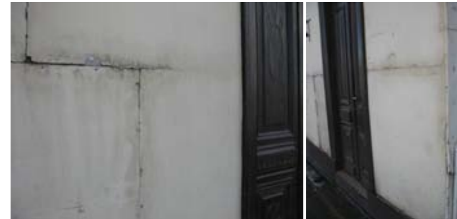
Sector de frente calle Maipú