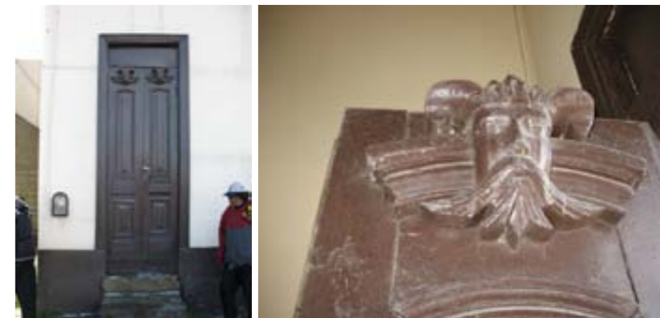
Puerta de acceso(secundaria) – detalle superior en puerta – madera. Idem principal.

Conclusión: Debiera tomarse por parte de la CNMMLH una rápida y firme decisión para liberar el destino de la misma, no solo como bien cultural sino como anexo del Museo del Fin del Mundo, dada la imperiosa necesidad de contar con espacios de exposición y culturales en la ciudad de Ushuaia.