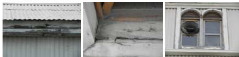
Algunos sectores externos en mal estado presentado en proyecto año 2011-2012 a la espera de resolución por la DNA a la espera de resolución por la DNA.