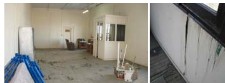
Deterioro interior. Espacio interno P.B. / ventana P.B.