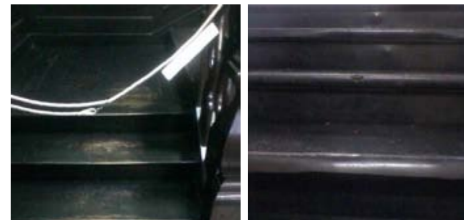
Madera de la escalera principal. PB / Pasillo lateral. Solado de goma levantado