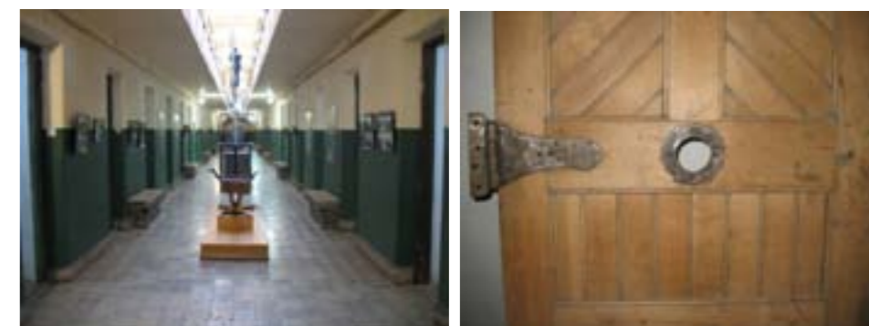
Pabellón recuperado P.B. / Puerta acceso a celda