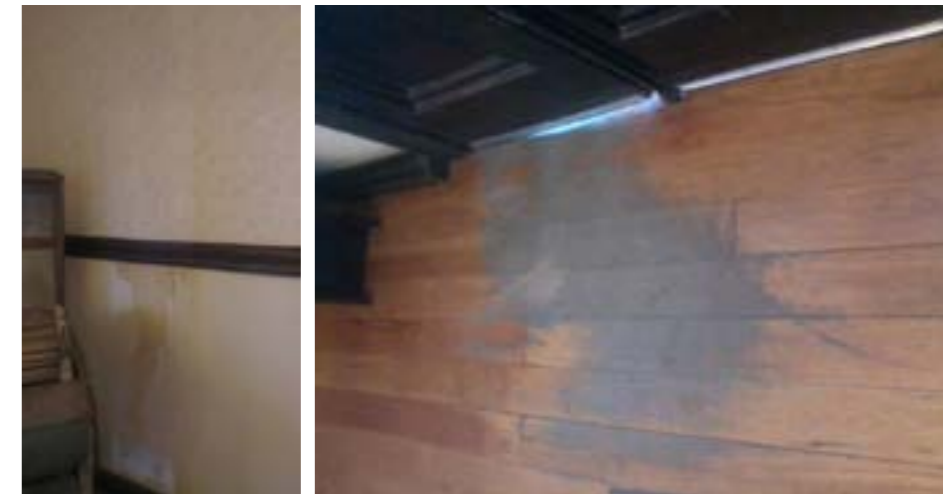
Filtraciones de humedad / Desgaste del solado de la madera. Acceso