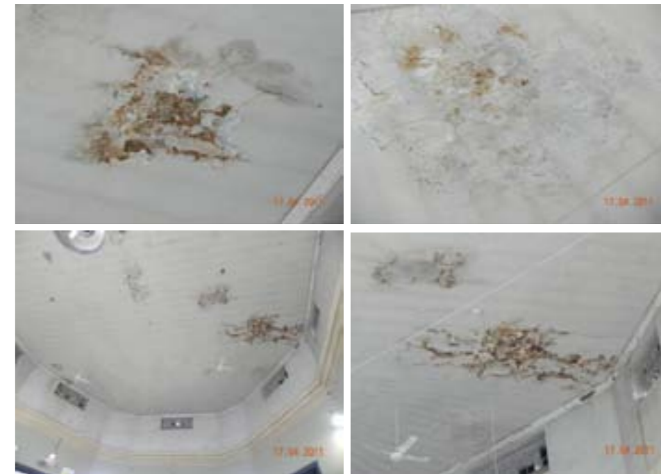
Cielorraso – óxido de la estructura que lo sostiene, se deberán armar andamios(aprox. h/15m) picar revoque y verificar filtraciones y estado de la misma.