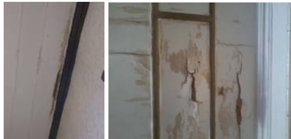
Molduras / Cielorraso