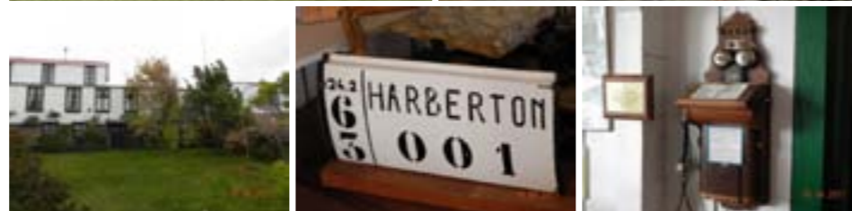
Vista general del casco de la Estancia