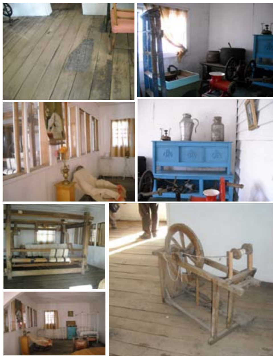
CASA DE LAS HERMANAS – Sectores internos Objetos y espacios conservados