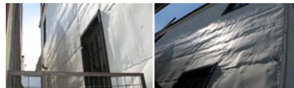
Laterales con revestimiento de chapa lisa.