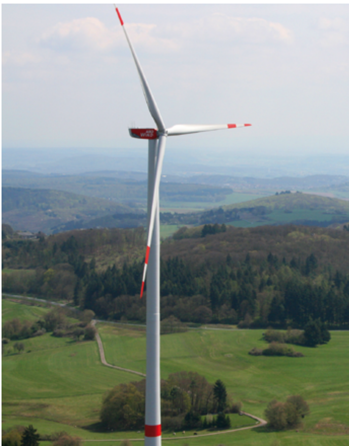
Im hessischen Windpark Hohenahr drehen sich bereits Rotoren des Anlagentyps Nordex N117, der auch in Weilrod zum Einsatz kommt.