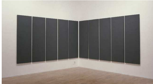
Alan Charlton, 10 Parts Corner Painting , 1986.

Le Musée d'art contemporain acquiert 10 Parts Corner Painting en 1986 auprès de la galerie Victoria Miro à Londres. C'est à cette occasion que nous rencontrons l'artiste.