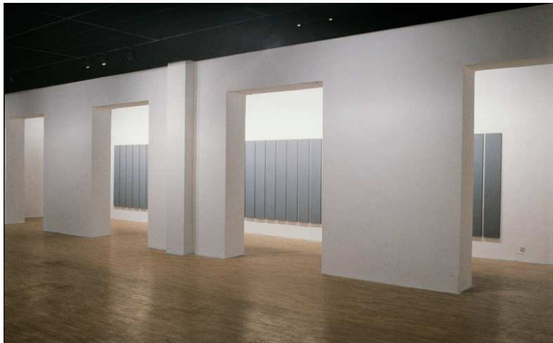
Alan Charlton, Painting in 36 Parts , 1987.

En 1987, l'exposition Alan Charlton se déroule du 10 juillet au 2 septembre et occupe tout le deuxième étage du Saint-Pierre Art Contemporain 1 . Pour cette exposition, Alan Charlton réalise Painting in 36 Parts , pièce qu'il lie à l'architecture du lieu (et à la présence d'un couloir et de plusieurs arches). C'est de la configuration très particulière de l'espace que l'artiste déduit l'échelle, l'ampleur, le mode de répétition, la longueur, le nombre de panneaux et la nuance de gris qui constituent l'œuvre.