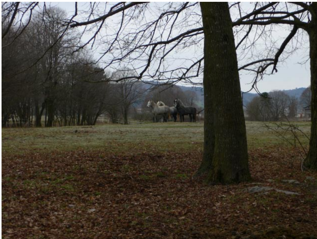
Airs Above the Ground