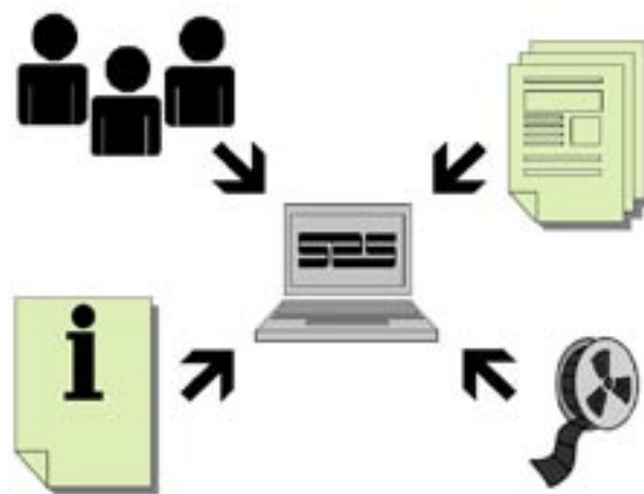
Säätiön uusi tietojärjestelmä yhdistää asiakasrekisterin, tukipääöstietokannan, festivaalien kopioseurannan ja elokuvatietokannan

Kaikki samaan hankkeeseen eri vaiheissa sen elinkaarta kohdistuvat hakemukset (käsikirjoitus-, kehitys-, tuotanto-, levitys- ja markkinointi-, lisäkopio- sekä kulttuuriviennin tuki) linkittyvät hankkeen elokuvatietoihin. Näin tietoja voi täydentää hankkeen edistyessä kunkin vaiheen vaatimalla tarkkuudella. Uusi järjestelmä estää samalla nykyisen tilanteen, jossa säätiön eri toimihenkilöillä saattaa olla käytössään toisistaan poikkeavaa tietoa vaikkapa elokuvan taiteellisessa työryhmässä tapahtuneista muutoksista.