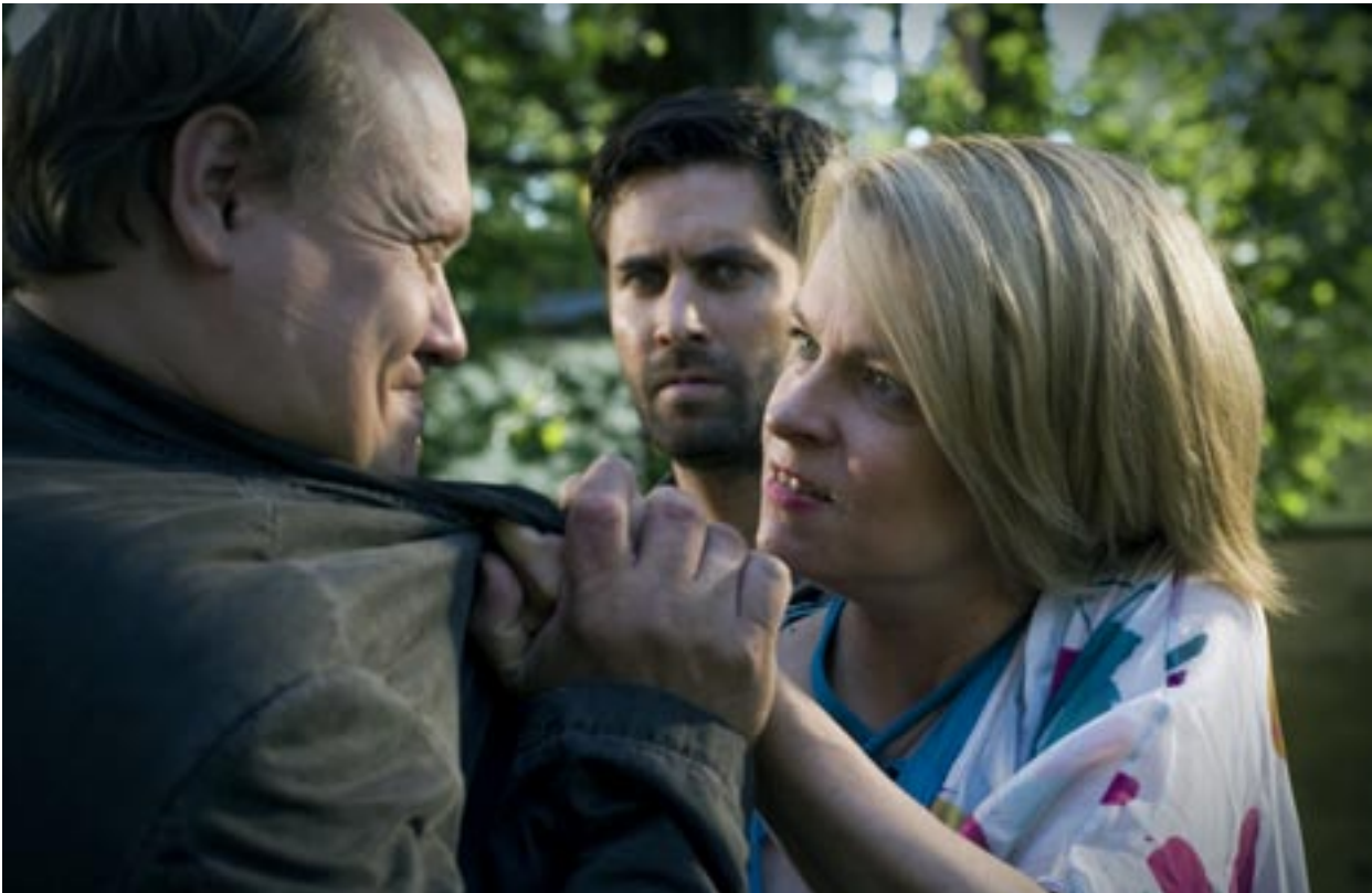
Mika Kaurismäen Haarautuvan rakkauden talo (2009) sai Median hankekehittelytukea 60 000 euroa vuonna 2008

Hakukelpoisen yhtiön ehto on, että se on vähintään vuoden vanha ja sen tulee olla tuottanut päätuottajana elokuva/tv-ohjelma, joka on saanut levityksen 1.1.2007 jälkeen. Tuotetun elokuvan genre on vapaa, se voi olla fiktio, animaatio tai dokumentti. Pelkkä kansallinen levitys riittää! Sales agent -sopimus riittää todistukseksi levityksestä, myyntiraportti ei ole välttämätön. Jos yhtiö ei ole tuottanut aiemmin mitään, voidaan ottaa huomioon yhtiössä vähintään vuoden työskennelleen tuottajan aiempi kokemus.