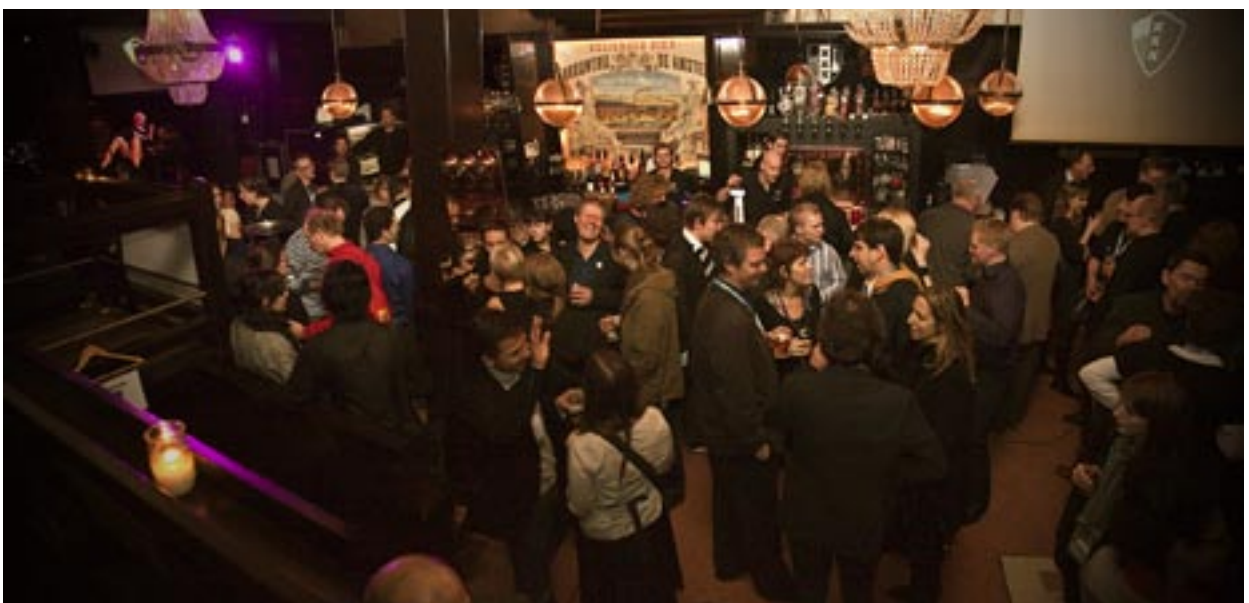
Ensi-iltajuhlat De Heeren van Aemstelissa