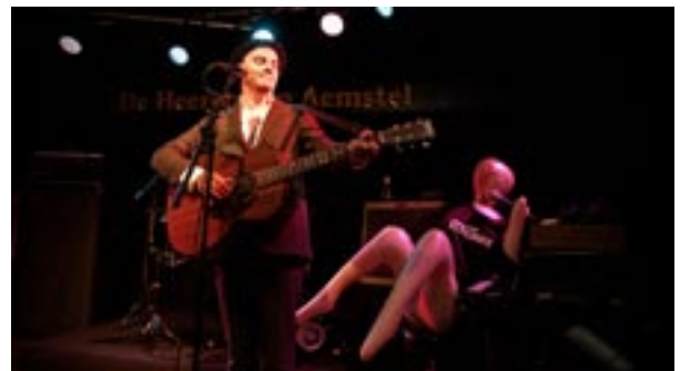
Mies ja kitara taustalaulajineen