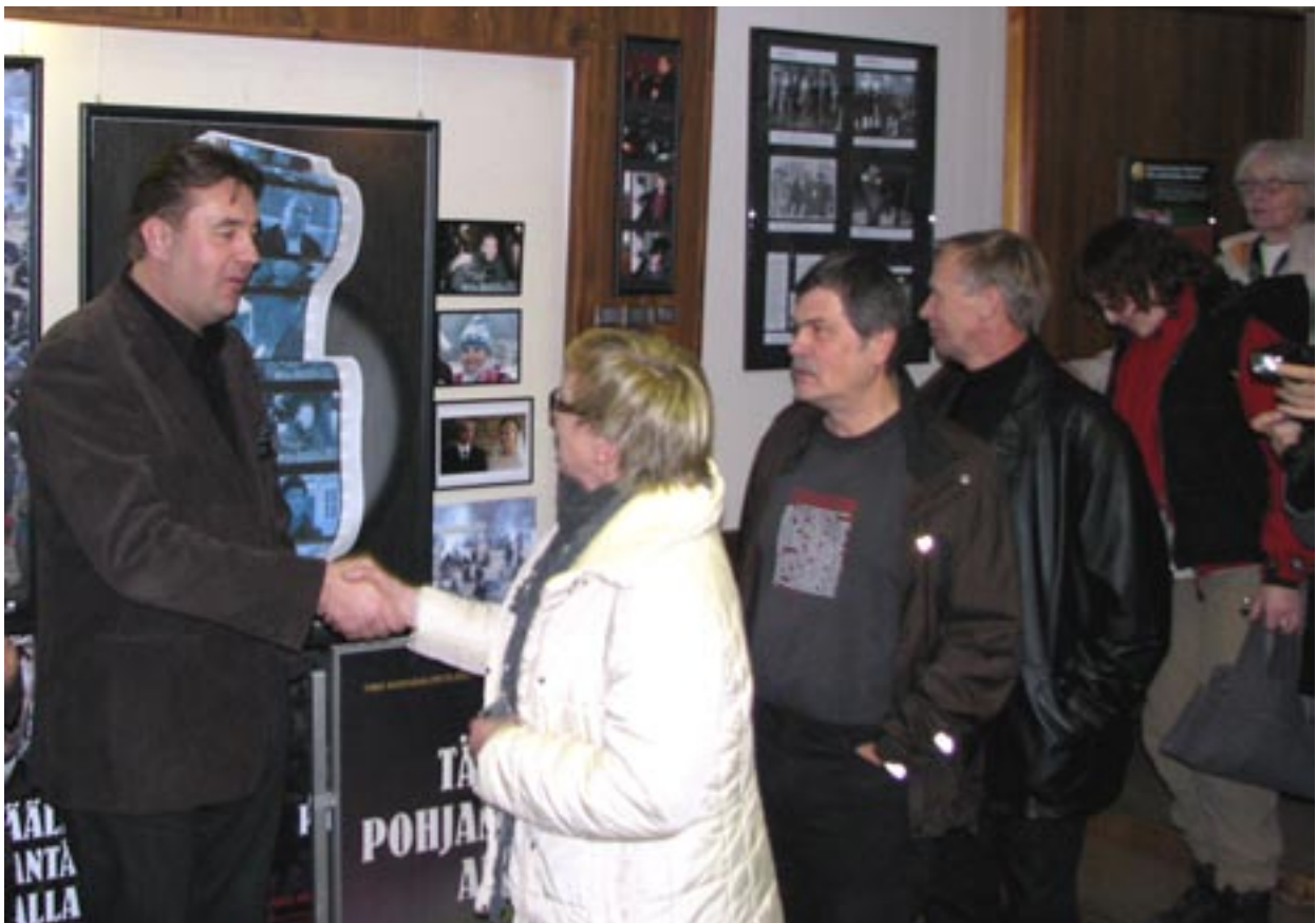
Yleisö pääsi kohtaamaan Timo Koivusalon Täällä Pohjantähden alla -elokuvan ennakkoesityksen jälkeen.

aina on joku, joka haluaa keskusteluun osallistua.