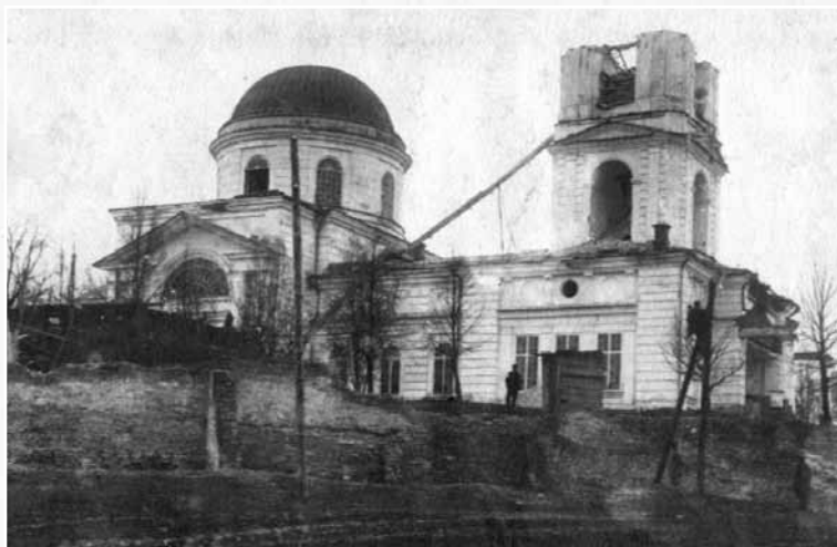
Суксунская Вознесенская церковь в 1930-е годы.

Священник Суксунской Вознесенской церкви о. Антоний Попов. Канонизирован в 2001 г.