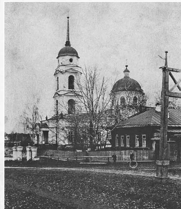
Суксунская Вознесенская церковь. Нач. XX в. СИКМ