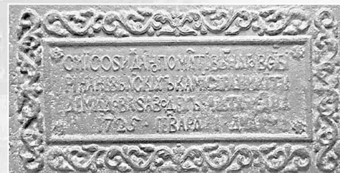
Чугунная плита, заложенная под основание фундамента конторы Суксунского медеплавильного завода Демидовых. Невьянск, 1725 г. Кунгурский историко-краеведческий музей