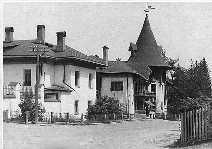
Дом Каменского. 1950-е годы. СИКМ