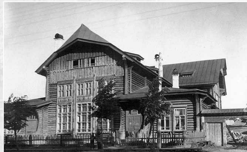
Здание бывшего Суксунского двухклассного училища. 1963 г. СИКМ