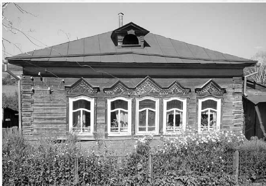
Дом Рыцциных.