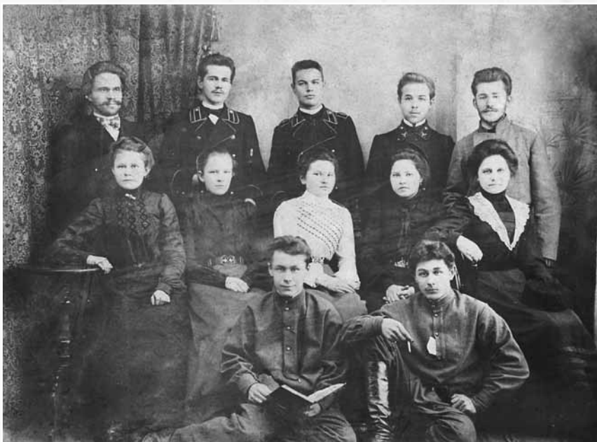
Интеллигенция Суксун-завода. Нач. XX в.