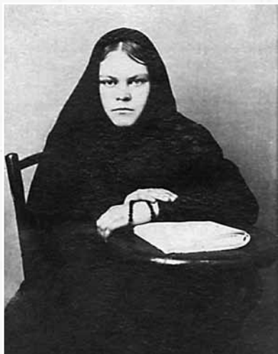
Послушница Екатерина. 1915 г.