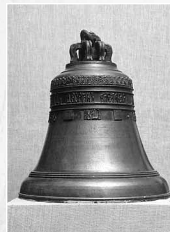
Церковный колокол, отлитый в Суксунском заводе в 1760 г. Пермский краевой музей