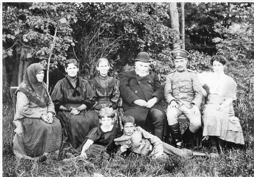
Семейство Обыденновых. 1912 г. СИКМ