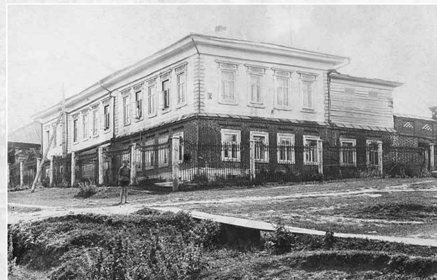
Дом коммерсанта Попова по ул. Шахаровка. Нач. XX в.