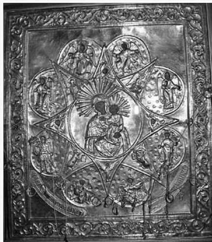
Чудотворная икона Суксуна «Неопалимая Купина», явленная на р. Сылве в XVII в. Суксунская Петропавловская церковь