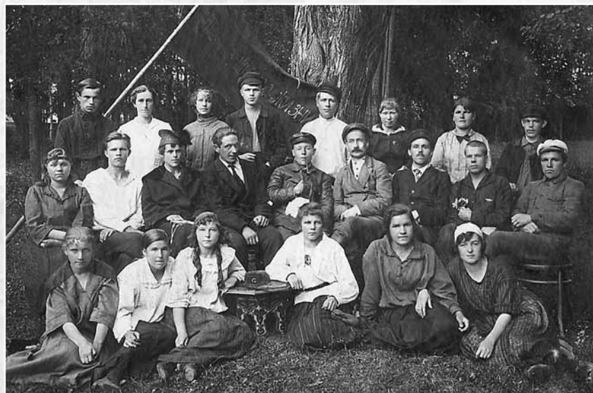
Молодежь Суксунского завода. 1920-е годы. СИКМ