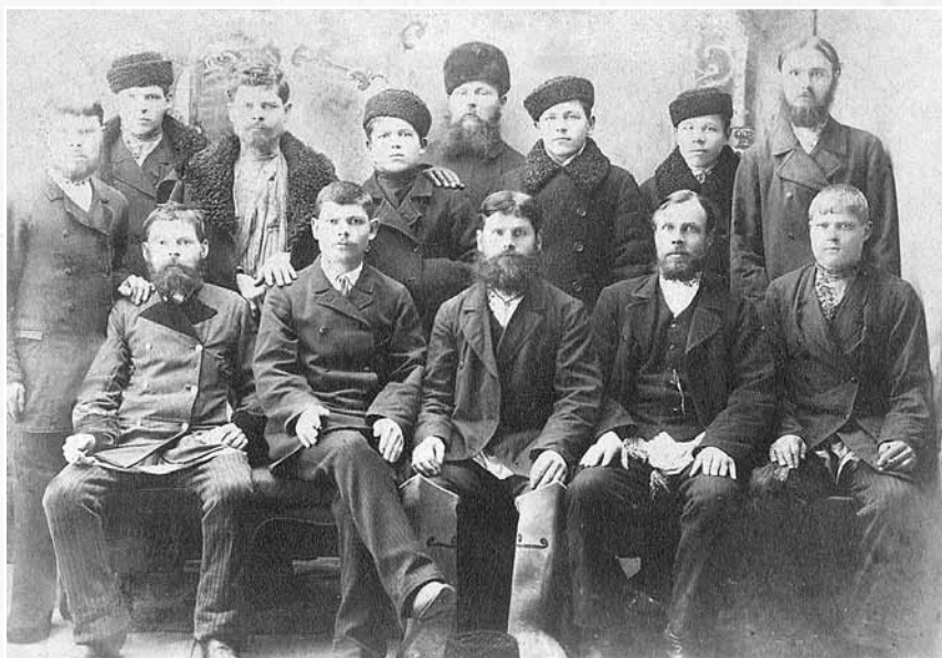
Рабочие фабрики А. А. Панфилова. Нач. XX в. СИКМ