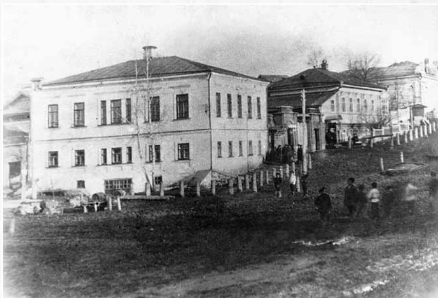
Волостное правление в Суксуне. Нач. XX в. СИКМ