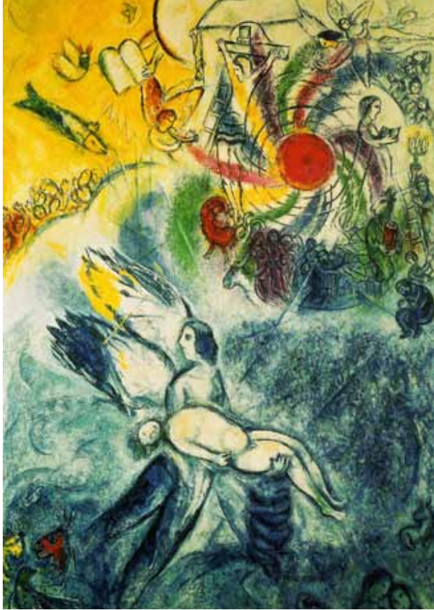
De schepping van de mens, Marc Chagall

Ik zit op het moment nogal wat te lezen in zogenaamde postmoderne theologie. Richard Kearney heeft een mooi boek geschreven met als titel Anatheïsm . De postmodernen houden nogal van woordgrapjes, maar deze titel is mooi gevonden. Anatheïsme is tegelijkertijd 'geen atheïsme' (an-atheïsme) en een 'overstijging van theïsme' (anatheïsme). Kearney zoekt naar een geloofshouding die de oude godsbeelden en de atheïstische ontkenning daarvan te boven gaat. 'Terug tot God na God' heeft hij als ondertitel meegegeven en daarmee doet hij denken aan de theoloog Tillich die in de eerste helft van de 20e eeuw zocht naar een God boven God. Het interesseert hem niet of je 'nog' gelooft, maar of je 'weer' kunt geloven. Kearney en zijn geestverwanten kunnen fel uithalen naar een God die je nodig hebt om de wereld te verklaren. Uiteindelijk zal dat naar hun opvatting altijd een sterke God zijn, die er met zijn macht als krachtbron voor moet zorgen dat de wereld in de lucht blijft. Als je eenmaal zo'n God hebt ingevoerd, moet je vervolgens haast noodzakelijk met een theodicee komen om te verdedigen dat