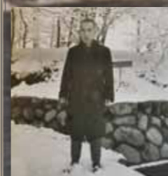
保育園設立直後の冬、今でも残る保育園の石垣の前で。