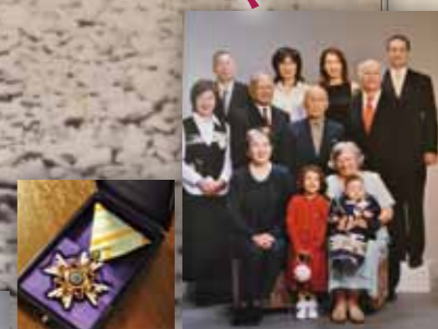
写真右、お子様、お孫様、曾孫様に囲まれて。写真左、功績を称え勲五等瑞宝章を受章された時の写真。