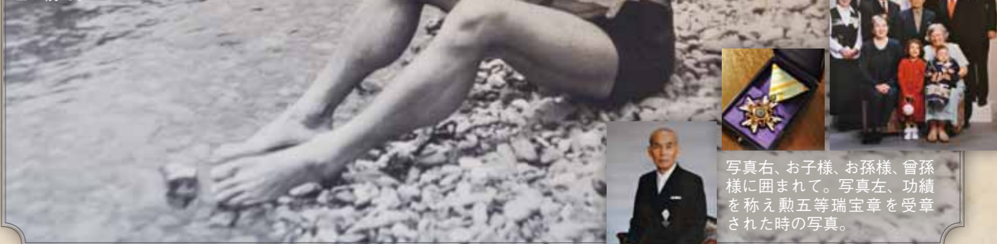
体育学校時代、川での水泳時の写真。体育学校だけあって鍛え上げられた肉体だ。