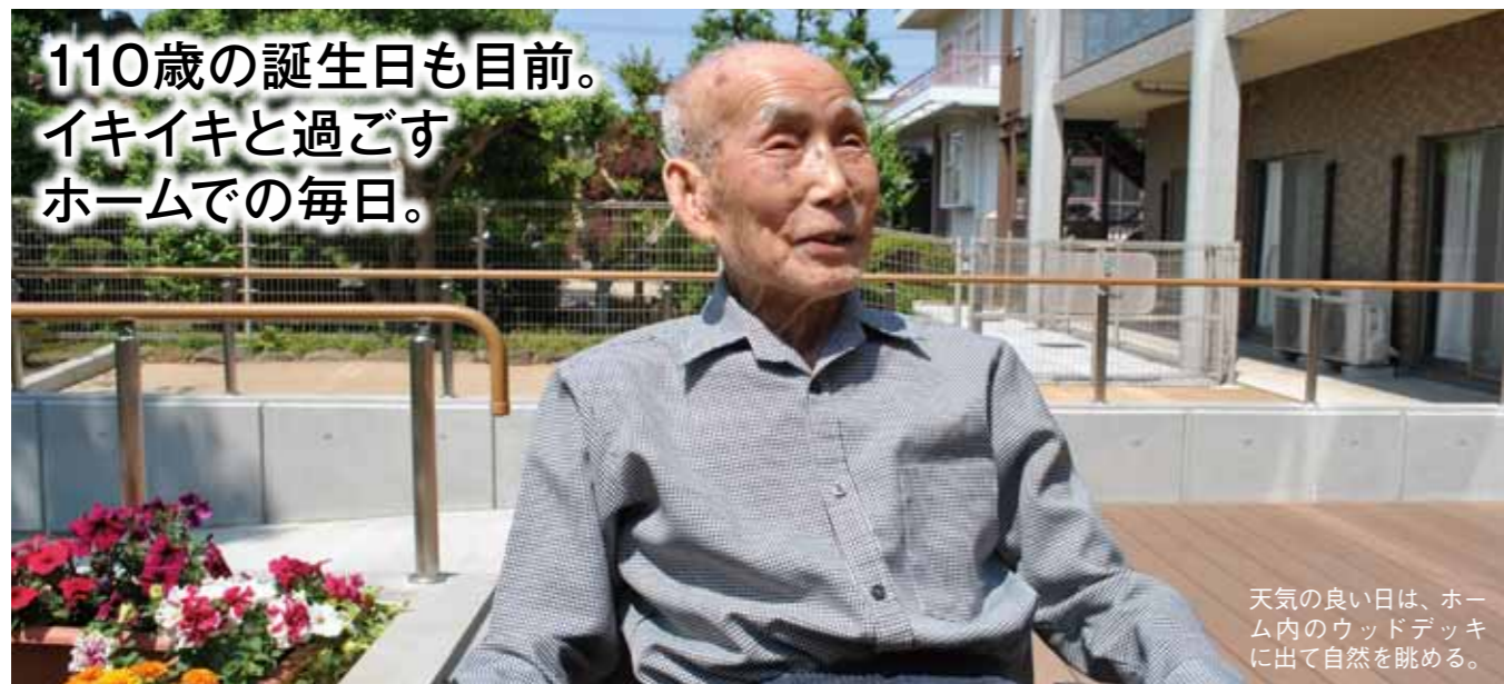
天気の良い日は、ホーム内のウッドデッキに出て自然を眺める。