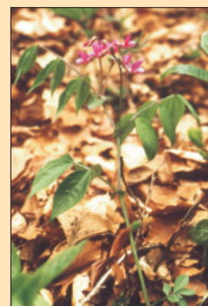
Hrachor jarní ( Lathyrus vernus )

ličnatá ( Pyrethrum corymbosum ), hrachor jarní ( Lathyrus vernus ), lilie zlatohlávek ( Lilium martagon ), bělozářka liliovitá ( Anthericum liliago ), ostřice horská ( Carex montana ), jetel alpský ( Trifolium alpestre ), svízel lesní ( Galium sylvaticum ), zimostrázek alpský ( Polygaloides chamaebuxus ) a ptačinec velkokvětý ( Stellaria holostea ).