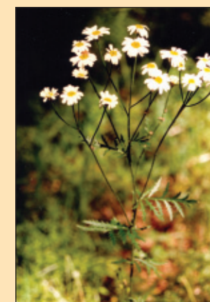
Řimbaba chocholínatá ( Pyrethrum corymbosum )