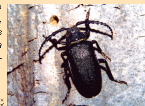
Tesařík piluna ( Prionus coriarius )