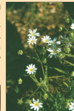
Ptačinec velkokvětý ( Stellaria holostea )