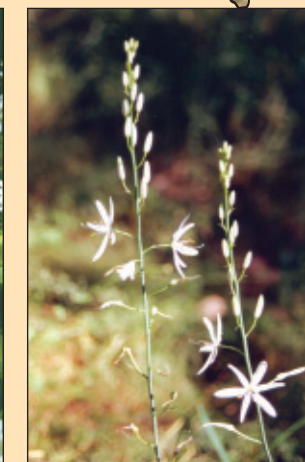
Bělozářka liliovitá ( Anthericum liliago )