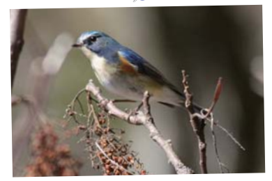
ルリビタキ (12～2月) オスの背中が青色、メスは褐色。口笛のようにヒリヨヒリヨヒュルルと鳴きます。