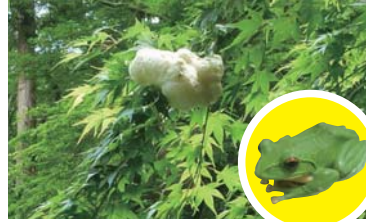
モリアオガエルの産卵 (6月中旬) あじさい池にかかる木の上に、泡状の卵かきをつけます。下の池ではアカハライモリが口を開けています。