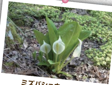
ミスバショウ (4月初旬) 純白の仏炎苞が春を告げます。葉が大きく芭蕉に似ているところから。