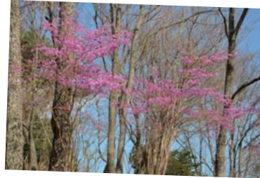
コバノミツバツツジの群落 (4月初～中旬) 春一番、林の足もとを艶やかな緋色に染め上げます。