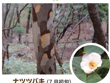
ナツツバキ (7月初旬) 7月、白い清楚な花をつける夏椿。木肌のもようは迷彩色?!