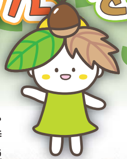
イメージキャラクター “まやもりん”

摩耶自然観察園～愛称“まやもりん”～は、摩耶山をはじめとした山地に生育する植物を紹介する学習園です。地形や自然林、せせらぎを生かして作られた園内は、四季折々の植物や生きものと出会える自然の宝庫です。特に初夏のヒメアジサイの群落は圧巻で、幻想的な“摩耶ブルー”の世界がひろがります。またお釈迦さまの伝説が残る史跡「産湯の井」は必見。“まやもりん”を歩いて、あなたの摩耶を発見してください。