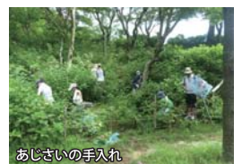
あじさいの手入れ