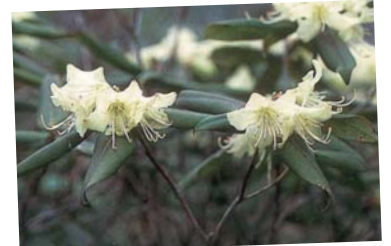
ヒカゲツツジ (4月中旬) ツツジ類には珍しいクリーム色の花が、野鳥たちを誘います。