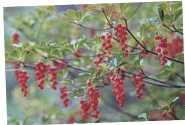
ベニドウダン (5月下旬) 摩耶にふさわしい紅い満天星(ドウダンツツジ)です。