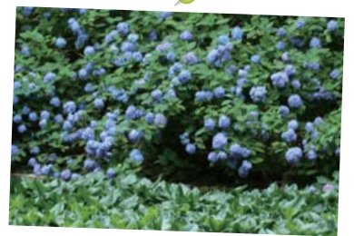
ヒメアジサイの群落 (7月初旬) 日本固有のヤマアジサイの仲間。あじさい池を摩耶ブルーに染めあげます。