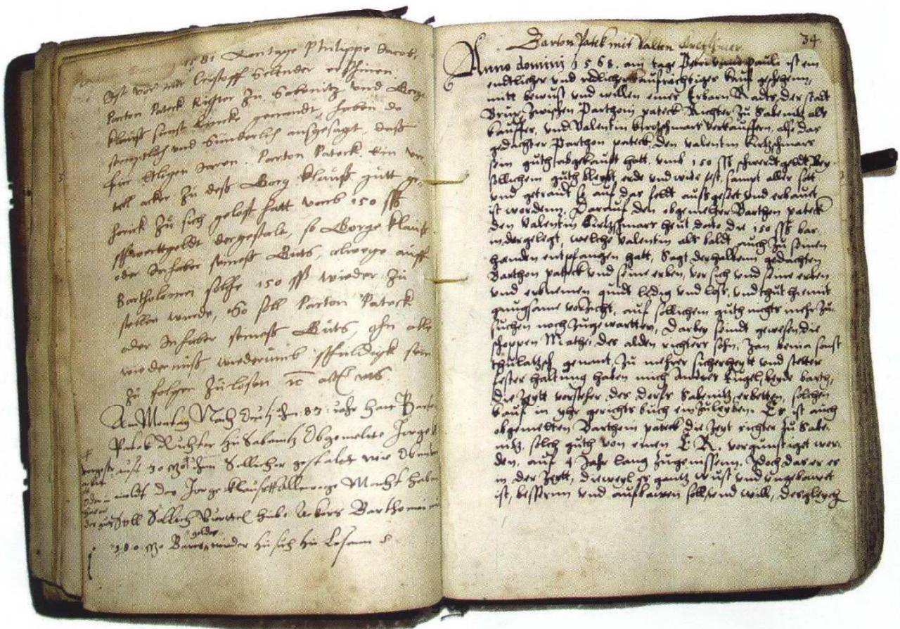
Pozemková kniha (1555–1683).