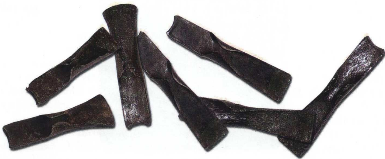
Část depotu bronzových seker. Mladší doba bronzová, kultura knovízská (1250–900 př. n. l.). Ze sbírek Oblastního muzea v Mostě.

Tento fakt dosvědčují jednak poměrně četné nálezy střepevého materiálu z keramických nádob, mazanice (používala se k „omítání“ stěn pravěkých obydlí srubové či kúlové konstrukce), parohu, tkalcovského závaží a zrotěrek, sloužících ke zpracování obilí. Vedle těchto artefaktů sídlištního charakteru však z okolí Saběnic pocházejí i další nálezy z prostředí knovízské kultury: vedle dvou bronzových jehlic a nože se jedná zejména o významné objevy tzv. depotů (skladů) několika desítek kusů bronzových seker se středovými laloky.