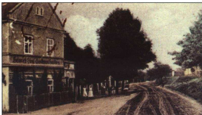
Sieglova restaurace (20. léta 20. století).

Nejvyšší úbytek obyvatel v Saběnicích byl zaznamenán, jako již tradičně, po roce 1945. Při sčítání lidu v roce 1950 bylo napočítáno pouze 105 osob, které žily v 30 domech. Ostatně počet usedlostí se zhruba v letech 1890–1950 nezměnil. Saběnice se dále vylidňovaly, a to nejen po roce 1945, ale i v následujících desetiletích. Výrazný pokles počtu obyvatel oproti roku 1950 byl zaznamenán nejen v roce 1970, kdy zde žilo jen 70 osob, ale zejména při sčítání lidu v roce 1991. Tehdy tady trvale bydlelo pouze 35 osob! Také počet obydlených domů se do roku 1991 podstatně redukoval, a to na pouhých 16, což bylo méně než v 18. století!