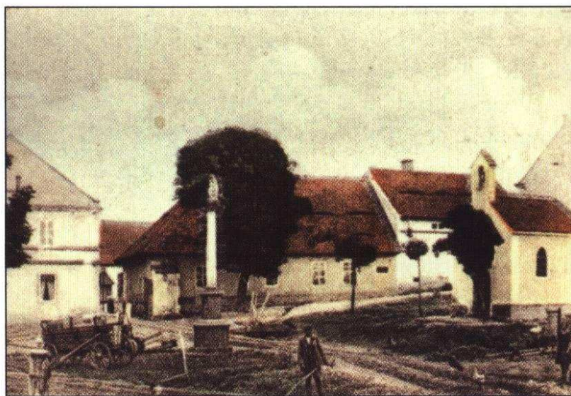
Saběnice. Návěs s kapličkou a sloupem se sochou Krista Trpitele (20. léta 20. století).

V Saběnicích se dříve nacházela na návsi kaplička neznámého zasvěcení, o níž však nelze zjistit ani údaje k jejímu založení či likvidaci (údajně měla být zbourána mezi lety 1960–1965). Jednalo se o obdélnou stavbu s obloukovitým zakončením. Měla sedlovou střechu s valbovým závěrem a krytinou z pálených tašek. V bočních stěnách a nad vchodem byly zdi kapličky prolomeny nevelkými okny ukončenými hrotitým obloukem. Také vchod měl hrotitý portál a nad ním byla umístěna malá zvonička zakončená křížkem.