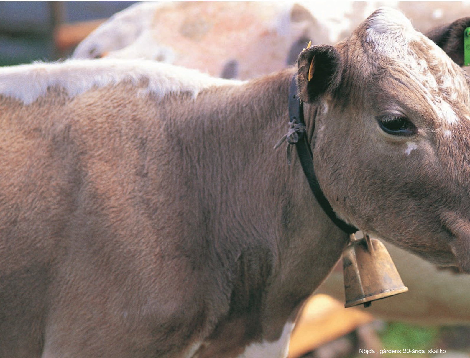
Nöjda , gårdens 20-åriga skällko