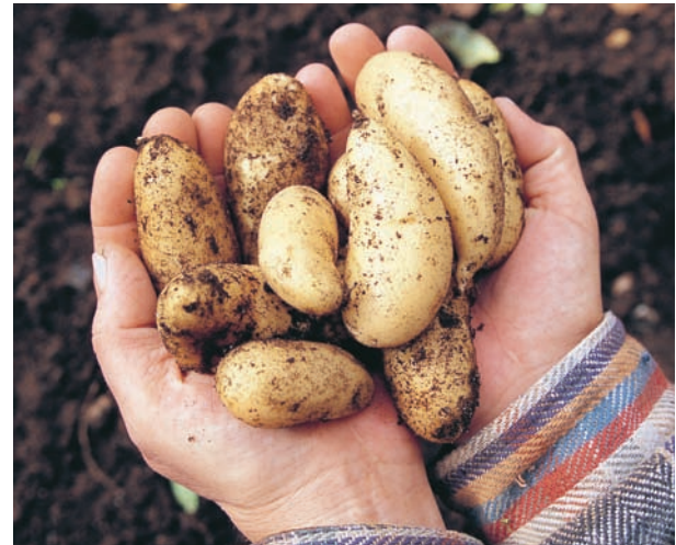
Mandelpotatisen tas upp i början på oktober