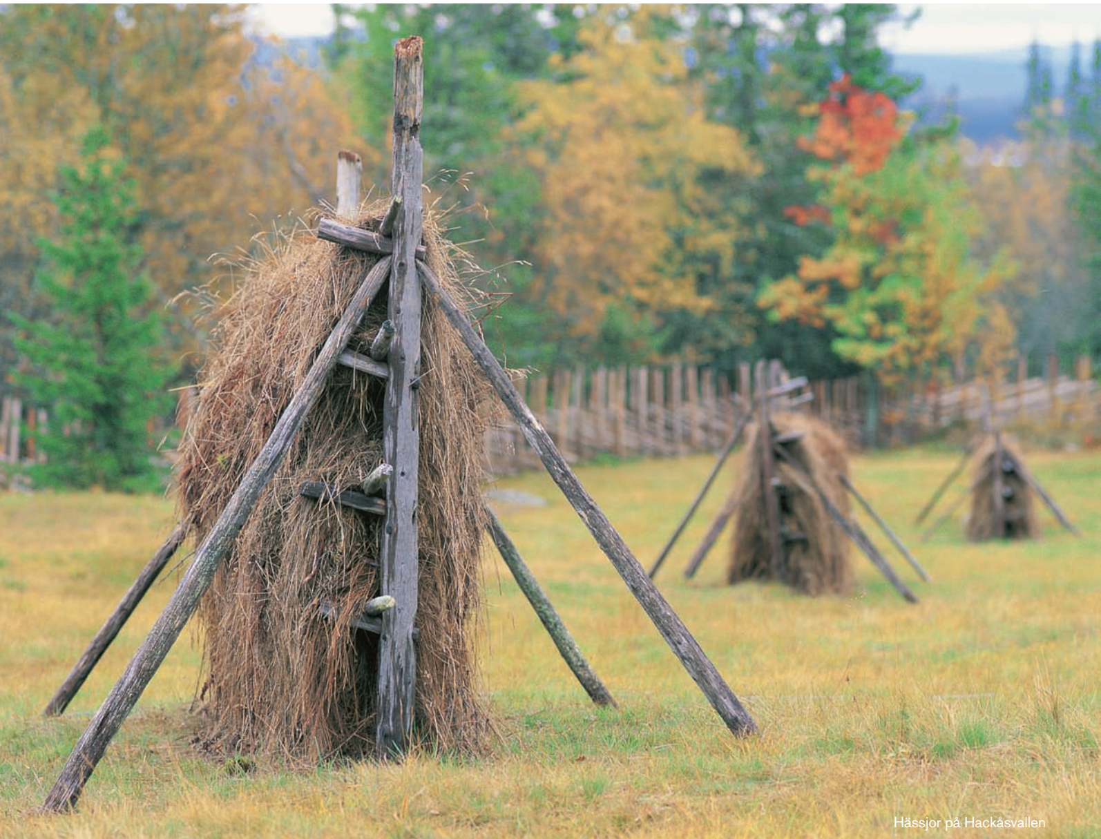
Hässjor på Hackåsvalen