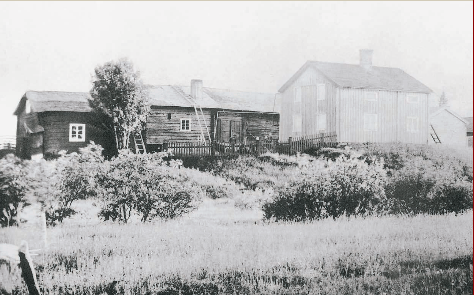
Gården före branden ca 1890