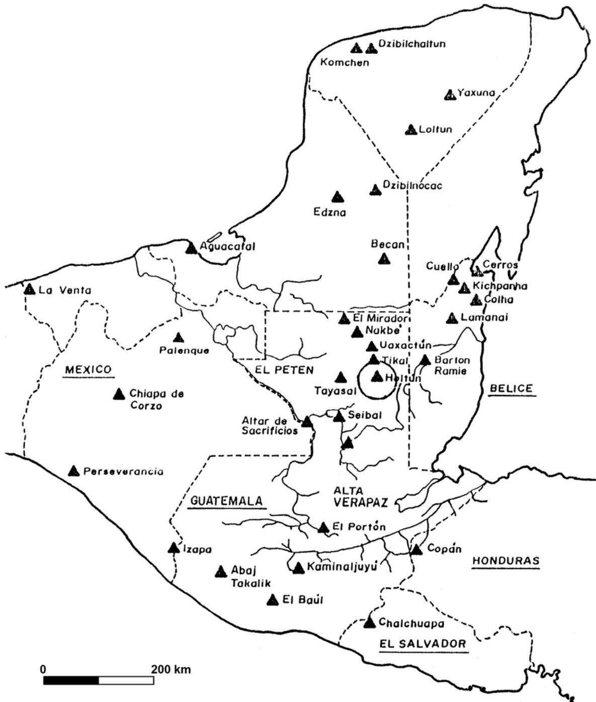
Figura 1 Sitios Preclásicos del Área Maya