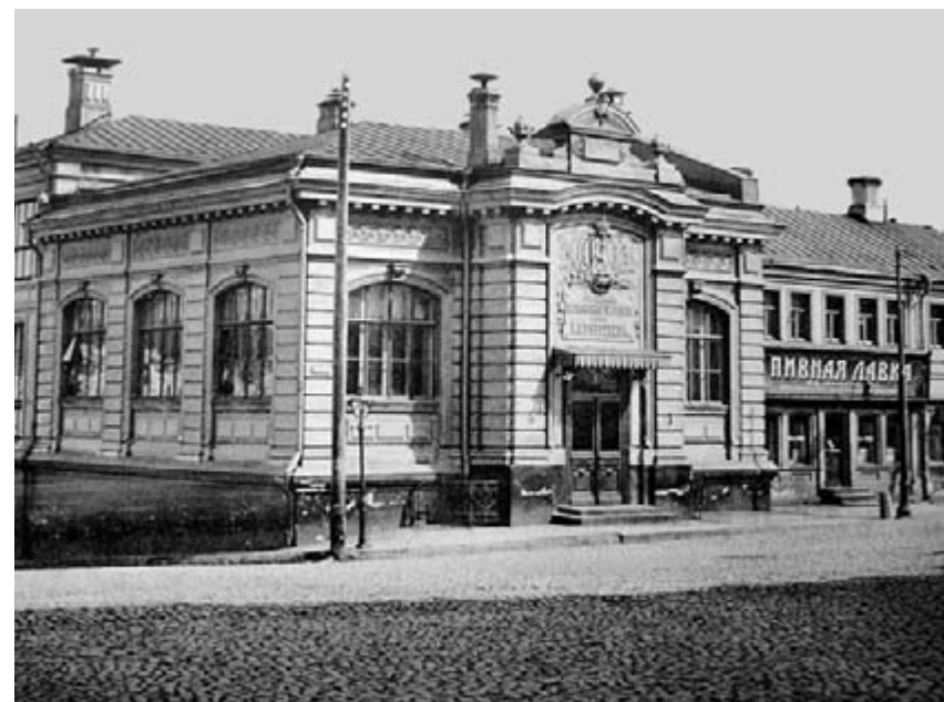
Здание читальни, построенное на площади Мясницких врат по проекту архитектора Д.Н. Чичагова, снесено в 1972 г. в ходе реконструкции центра Москвы