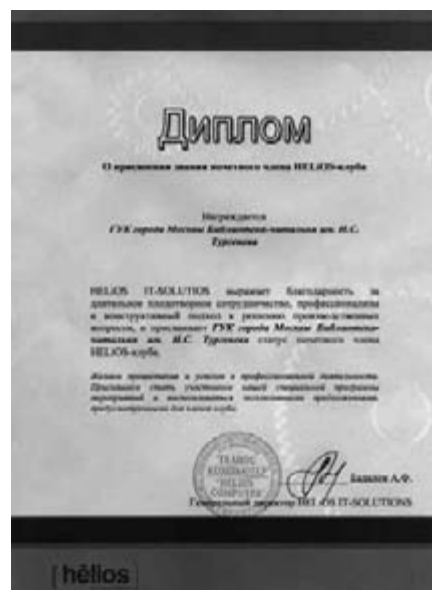
Диплом о присвоении Библиотеке звания почетного члена Гелиос-клуба