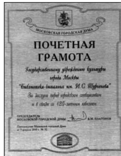
Почетная грамота Московской городской Думы