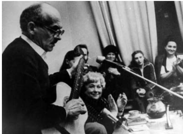
Выступление Б. Окуджавы в библиотеке им. А.П. Чехова, 1960-е гг.