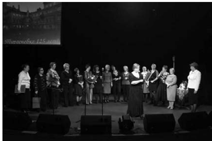
Поздравления от коллег