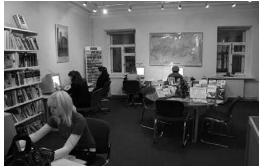
Библиотека-читальня им. И.С. Тургенева. Медиатека. Первой в Москве и в России комплексно компьютеризированной общедоступной библиотекой стала в 1998 г. Библиотека-читальня им. И.С. Тургенева