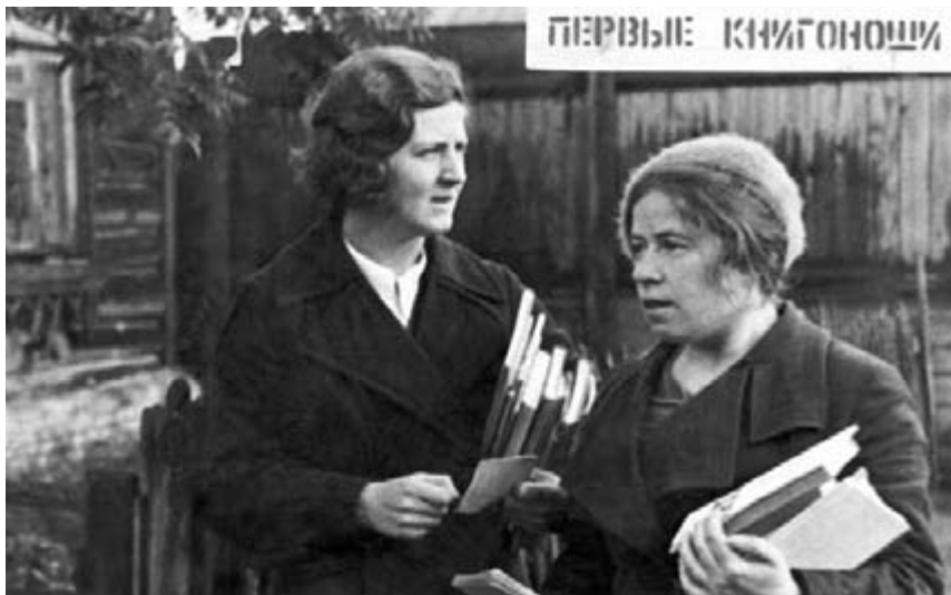
Книгоноши — сотрудники библиотеки им. А.М. Горького. В 1920-х гг. была развита одна из форм библиотечного обслуживания — книгоношество: доставка книг на дом или в учреждения сотрудниками библиотек, которые назывались книгоношами