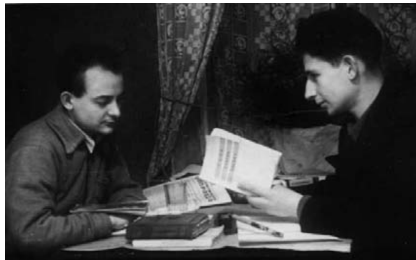
Обслуживание инвалидов сотрудниками библиотеки им. Н.А. Добролюбова, 1943 г.