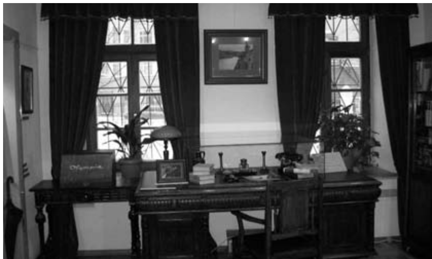
Библиотека русской философии и культуры «Дом А.Ф. Лосева». Мемориальная экспозиция