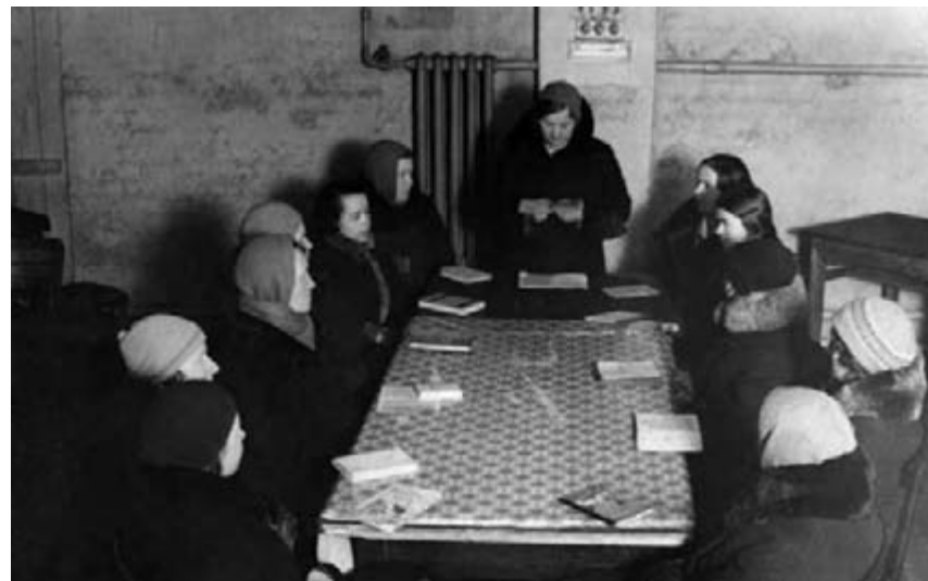
Кружок для малограмотных в библиотеке им. Н.В. Гоголя, 1930-е гг. В первые послереволюционные годы библиотеки принимали активное участие в работе пунктов (школ ликбеза) по ликвидации безграмотности и повышения общей культуры населения