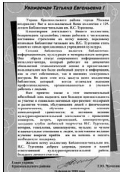
Поздравление с юбилеем Библиотеки от Управы Красносельского района г. Москвы