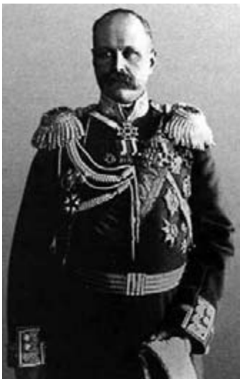
Владимир Федорович Джунковский (1865–1938), в 1905–1912 гг. московский губернатор, с 1913 товарищ министра внутренних дел, командир Отдельного корпуса жандармов. С 1905 г. председатель Столичного попечительства о народной трезвости