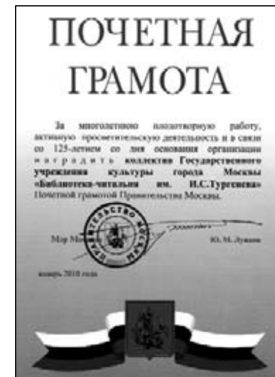
Почетная грамота Правительства Москвы