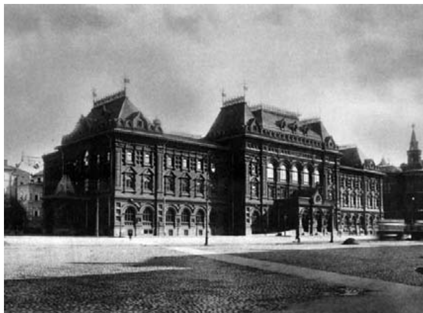
Здание Московской городской Думы на Воскресенской площади, построено в 1890–1892 гг. по проекту архитектора Д.Н. Чичагова