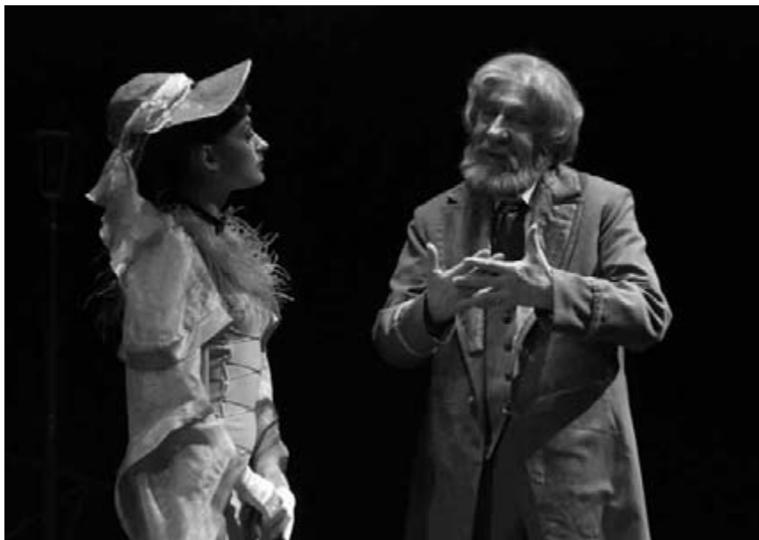
Сцена встречи И.С. Тургенева и В.А. Морозовой в исполнении артистов Орловского государственного академического театра им. И.С. Тургенева