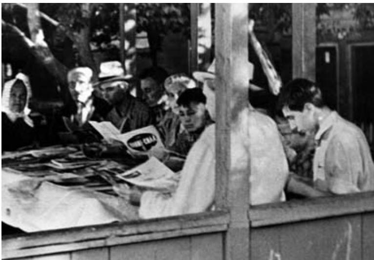
Летняя читальня библиотеки им. Сталина (ныне Центральная библиотека им. А.Н. Толстого ЦБС «Киевская»)