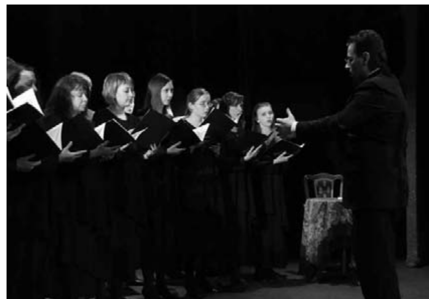
Хор Государственного музыкального колледжа им. Гнесиных исполняет произведение А. Гречанинова «Русский язык» (слова И.С. Тургенева)