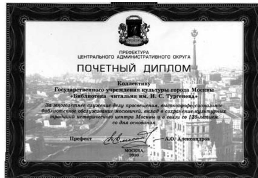
Почетный диплом Префектуры Центрального административного округа г. Москвы