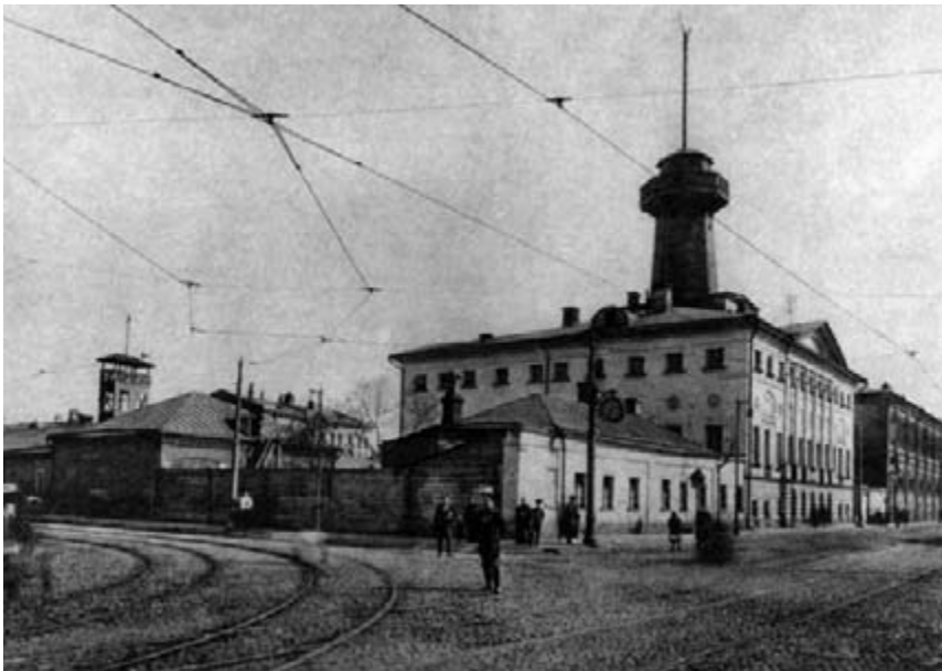
Пятницкая полицейская часть, в помещении которой располагалась восьмая библиотека Московского общества бесплатных народных библиотек