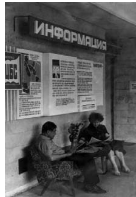
Стенд информации в центральной библиотеке ЦБС г Зеленограда