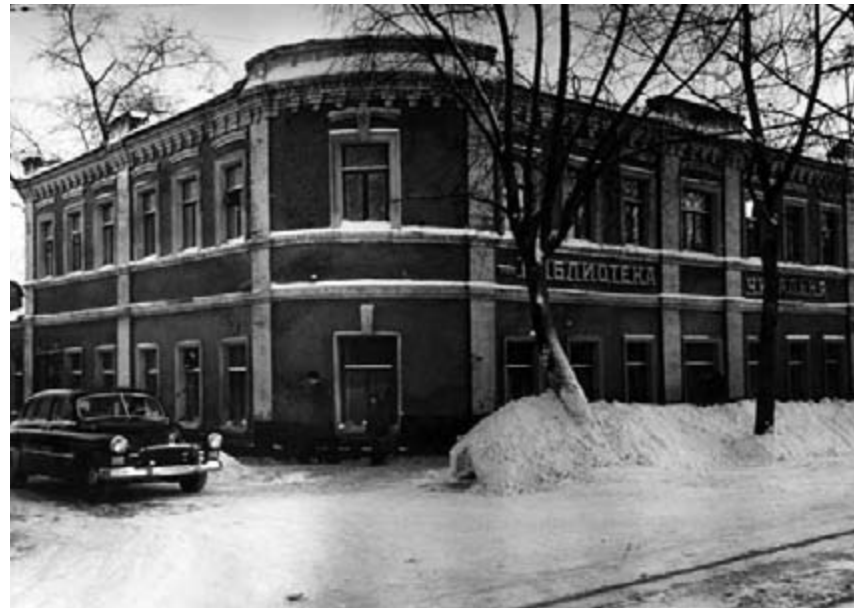
Здание библиотеки Столичного попечительства о народной трезвости на Вятской улице (ныне Центральная библиотека № 75 им. М. Горького ЦБС № 1 САО, современный адрес: ул. Тимирязевская, д. 17, к. 1).