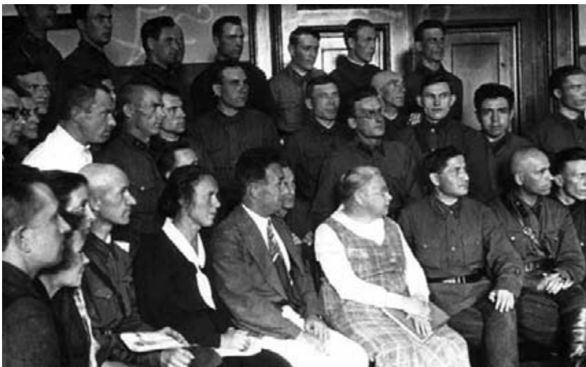
Н.К. Крупская (1869—1939) в группе военных библиотекарей. Надежда Константиновна Крупская была назначена председателем Главполитпросвета и сыграла ведущую роль в организации библиотечного дела в СССР