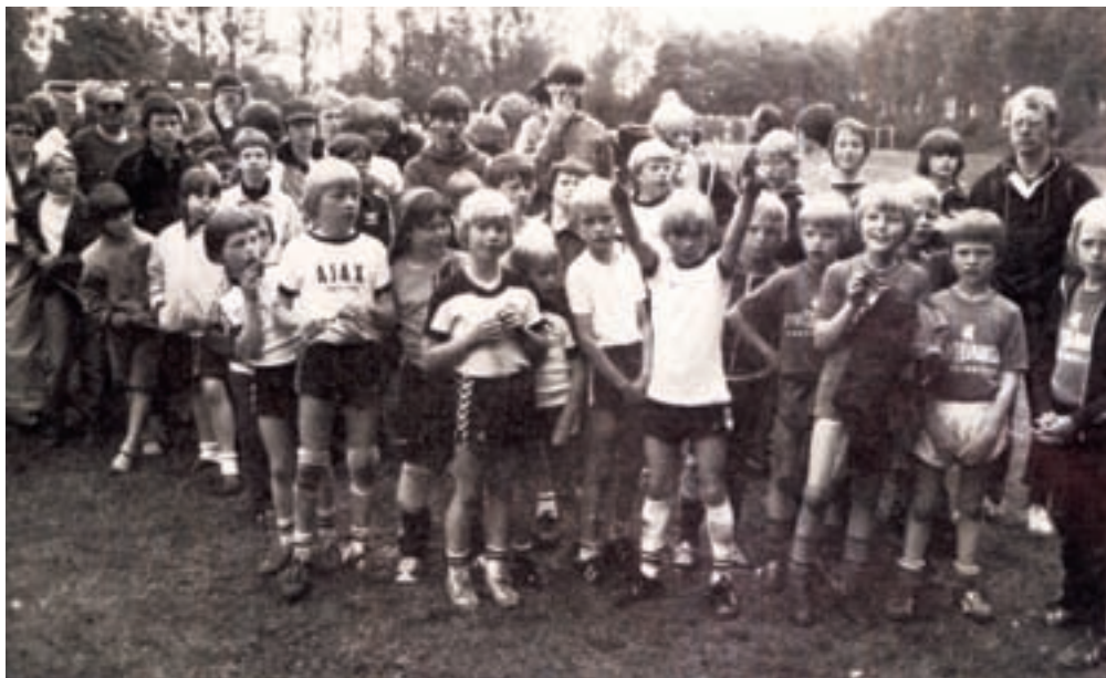
Fra sidelinjen fulgte den store Ajax-trup ivrigt begivenhederne ved AIK Odenses stævne

Minimix deltog i deres første stævne og vandt alle kampe stort.