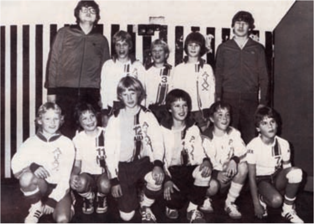
Puslingeholdet 1981 / 82 efter pokalsejeren i KB-hallen