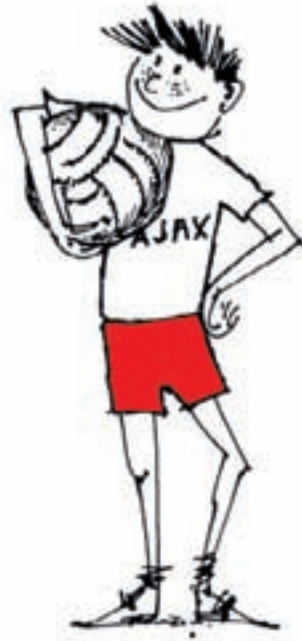
Ungdom 1973 / 74

Årets resultater i mesterskabsturneringen var ualmindelige gode: Ynglinge nr. 2 i A-rækken, juniorer nr. 1 i B-rækken, drenge nr. 1 i B-rækken, puslinge nr. 2