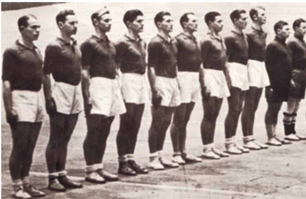
Verdensmesterskaberne i Berlin 1939. Otte AJAX'ere på landsholdet

Et stort arbejde var lagt for dagen af alle klubbens medlemmer, og et overskud på