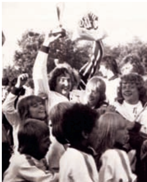
Bedste klub ved stævnet hos Wellingdorfer TV på æresrunde

Generalforsamlingen vedtog endvidere forslaget om at nedsætte et udvalg på tre medlemmer, der vælges af generalforsamlingen til at varetage 1. og 2. holdets sportslige interesser og praktiske