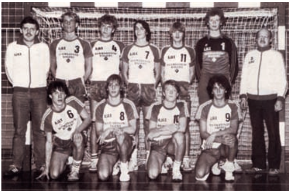
Vinder af herreynglinge Øst 1983 / 84

I ungdomspokalturneringen nåede lilleputholdet finalen, hvor de tabte knebent til RH. I vinterturneringen er det også gået ganske godt. Ynglingene havde allerede vundet Østturneringen, da der resterede 4 kampe, og de lignede favoritter til både KM og DM. De øvrige ungdomshold lå højt placeret i de københavnske A-rækker uden dog at toppe.