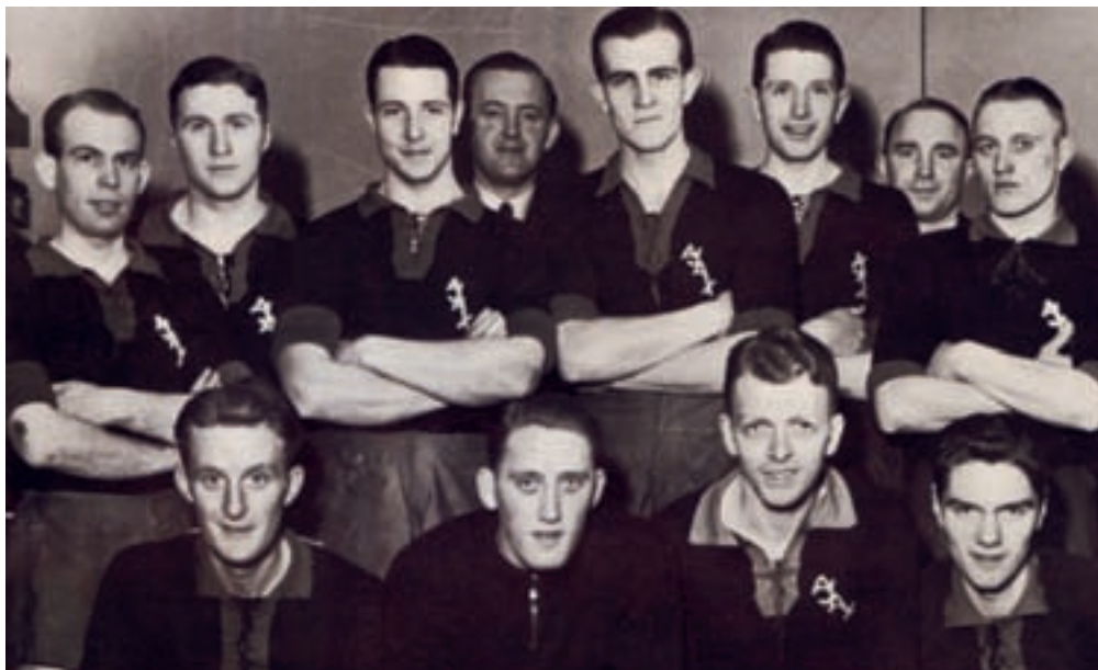
Danmarks mestrene 1942