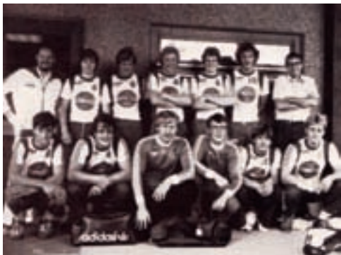
B.K & Søn Matal A/S sponsorede AJAX i 1979 - 1981

I oktober afholdtes ungdoms VM i Danmark,