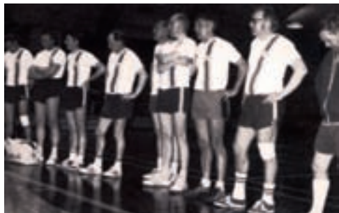
Veteranerne københavns Mestre

Vor sponsoraftale med BK & Søn Metal blev forlænget for 1980-81. Som noget ganske enestående indgik vi derudover en sponsoraftale for vort gode 2. hold med BA-Food fra Kødbyen.