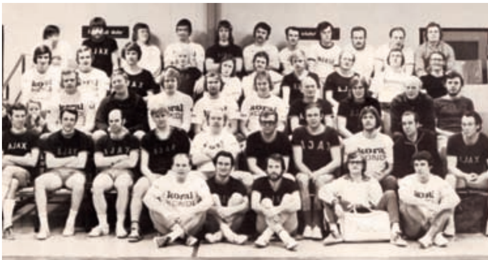
Senior afdelingen 1974

levende og vittig reportage af selve festen gennem en båndindtaling. Senere underholdt skuespilleren Karl Stegger.