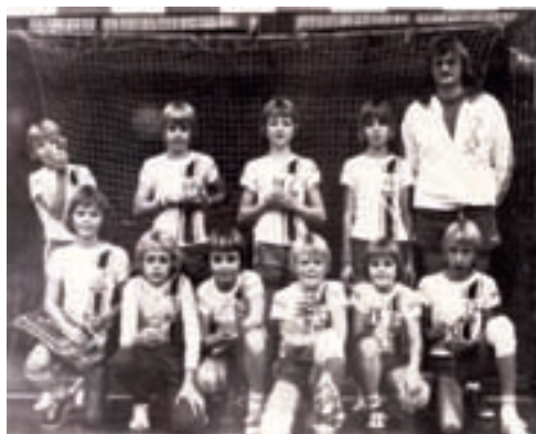
Minipuslingeholdet 1976 / 77 efter pokalsejren i KB-hallen

I St. Bededagene 14. -16. maj afholdt vi ungdomsstævne i Bavnehøjhallen, hvortil vi havde inviteret venskabsklubber i Danmark, Sverige, Vesttyskland, Holland og Belgien.