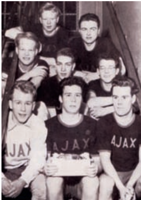
Ynglingeholdet fra 1954

En af vore første kampe i DT om efteråret var mod Helsingør IF, som indskrev sig i historien som den første TV-transmitterede håndboldkamp herhjemme.