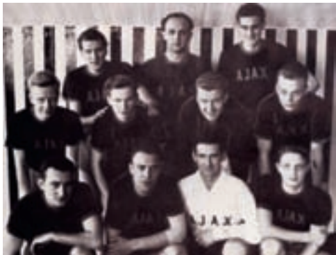
1. holdet 1959