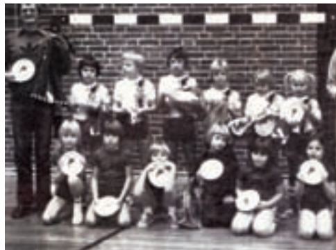
MINI-MIX-holdet 1980 / 81 med sejrspæmierne fra Gladsaxe Cup