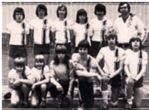
Herrejuniorholdet 1975 / 76

rammer med ansvar over for bestyrelsen. Her var ikke tale om blot at genindføre tidligere tiders spilleudvalg, men at etablere et organ, der fritager bestyrelsen for det direkte arbejde omkring 1. og 2. holdet, idet bestyrelsen tyngedes af stadig voksende administrative byrder. Samtidigt bestemtes, at A-gruppeformanden skulle indtræde i bestyrelsen,