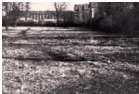
Sådan så der ud på klubhusgrunden før byggeriet

AJAX fik Shell Varme Center som ny sponsor ved 4. holdsspilleren Svend Larsens mellemkomst.