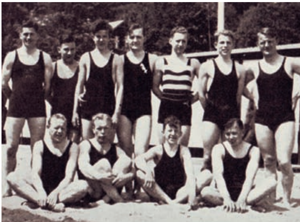
Mondænt badeliv med 1. holdet anno 1934