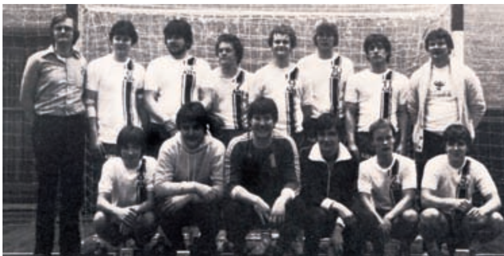
Ynglingeholdet 1979 / 80

Nu kunne ingen være i tvivl om at AJAX havde Danmarks stærkeste herreungdomsafdeling. Men hvordan skulle vi fortsætte og forstærke udviklingen. En af de aktiviteter, der afgørende brød med vor stolte tradition, var indførelse af Mini-Mix håndbold, hvor "mini" betyder at spillerne begynder allerede i femårsalderen, og hvor "mix" betyder at både drenge og piger spiller på samme hold. Det begyndte som et forsøg; for hvordan skulle vore ungdomsledere klare spillere