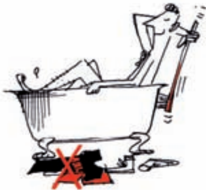
Bort, vaske, skrubbe...