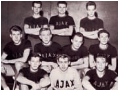
Københavns mestrene i ynglingærækken 1959