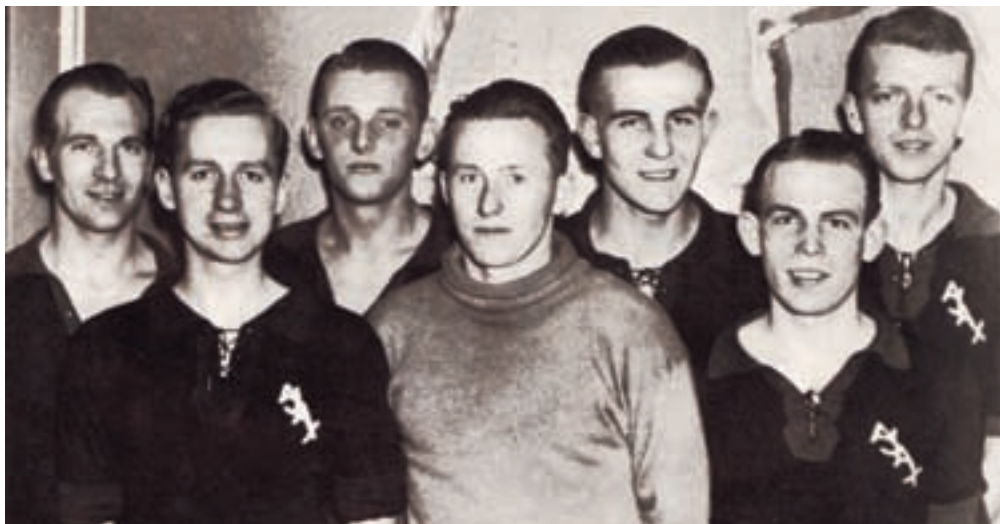
Vore officielle Danmarksmestre fra 1937