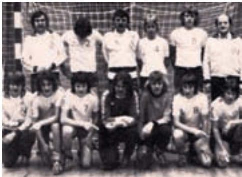
Drengeholdet 1975 / 76

Igen var vi gæster hos RIK på Skatås, hvor der blev lejlighed til at boltre sig i halvanden meter sne. Sportsligt opnåede holdene ingen succes.