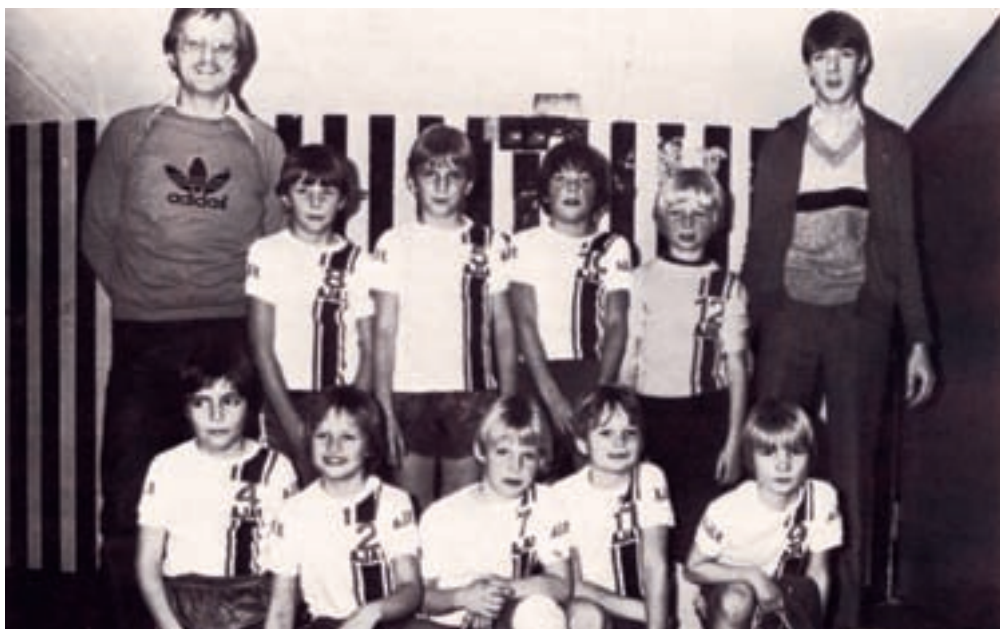
Lilleputholdet 1981 / 82 efter pokalsejeren i KB-hallen