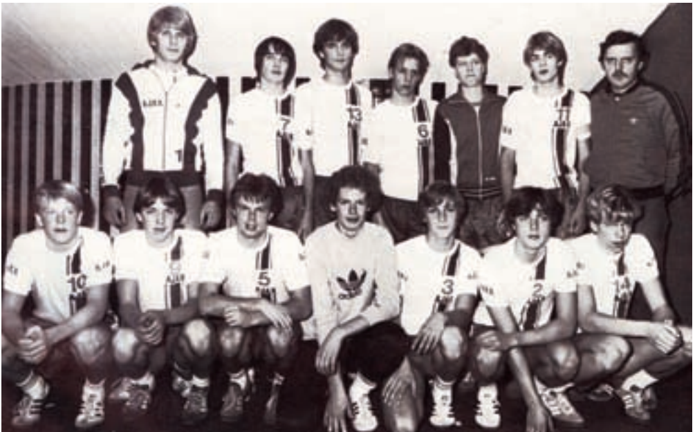
Herrejuniorholdet 1981 / 82 efter pokalsejeren i KB-hallen