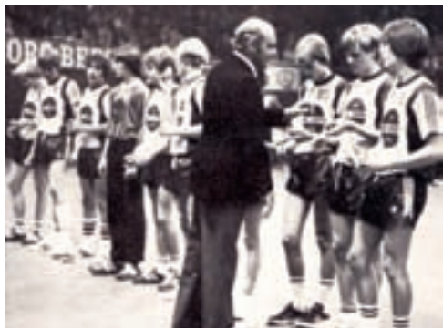
Herrejuniorholdet 1980 / 81 efter pokalsejeren i KB-hallen

Sæsonens resultater nåede ikke på højde med tidligere år. Det begyndte ganske