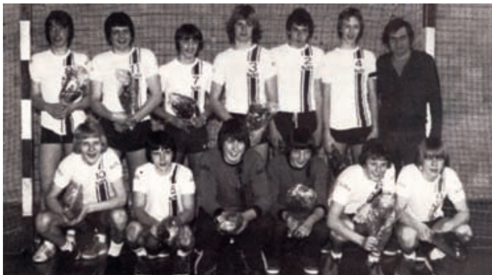
Juniorholdet 1977 / 78

I DT gik det dårligt for vort 1. hold, og