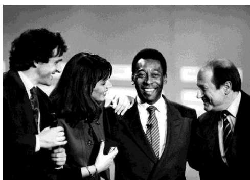
Sorteio final em Roma: da esquerda para a direita: Michel Platini, a atriz Elisabetta Gardini, Pelé e Joseph S. Blatter

O formato técnico foi o mesmo do México 1986: seis grupos de quatro, tendo como cabeças de chave Argentina, Brasil, Itália, Alemanha Ocidental, Bélgica e Inglaterra.