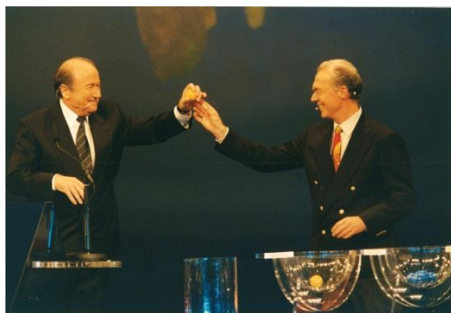
Franz Beckenbauer (à direita) entrega a bolinha do sorteio ao então secretário-geral da FIFA, Joseph S. Blatter

A Copa do Mundo da FIFA 1998 foi a primeira com 32 seleções e oito grupos, cada um com um cabeça de chave: Alemanha, Itália, Argentina, Espanha, Romênia e Holanda, além do campeão Brasil e da anfitriã França.