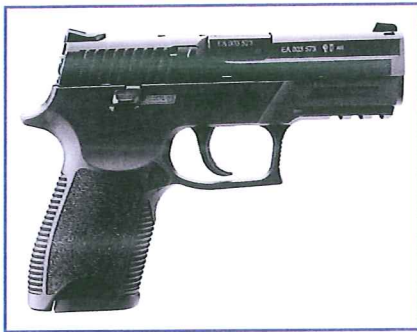
De SIG-Sauer P250 is een volledig modulair pistool met kunststof kast van verschillende afmetingen.