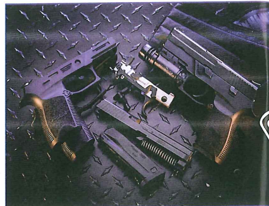
Reclame voor de Phantom.

De CZ75 SP-01 Phantom is de kunststof versie van de CZ SP-01 serie, de gemoderniseerde uitvoeringen