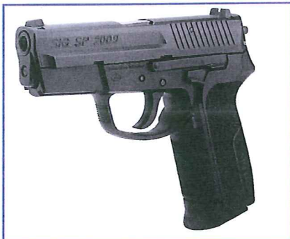
De P250 is niet het enige SIG-Sauer pistool voor politiegebruik. Een variant van deze SP 7009 is vier jaar geleden bij de Franse politie ingevoerd.