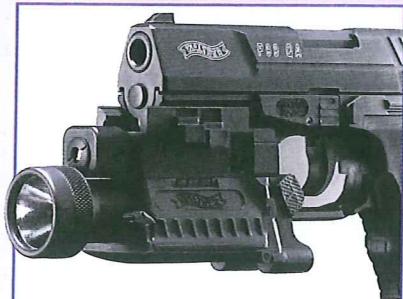
Een van de kritiekpunten op de Walther P5 is dat het wapen geen montagerail heeft voor een laser of lamp. Moderne pistolen voor de overheidsmarkt hebben die rail allemaal.

Indien dat laatste als harde eis wordt gesteld, is dat geen leuk nieuws voor een overigens belangrijke kandidaat: de Glock 17. Glock maakt weliswaar verschillende modellen en introduceerde speciaal voor mensen met kleinere handen vorig jaar de Short Frame (zij het nog uitsluitend in .45 Auto), maar de Glock heeft geen uitwisselbare greepdelen, zoals andere merken. Zou het pistool om die reden afvallen? Er zijn ook veel zaken die voor de Glock pleiten. Het pistool is tig-voudig in de praktijk getest. Het werkt zo simpel dat zelfs de grootste klungel het veilig kan hantieren. De Glock 17 is al in gebruik bij de Nederlandse krijgsmacht en diverse politieonderdelen. Dat betekent