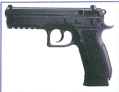
De CZ SP-01 Phantom is het eerste lid van de CZ familie met kunststof kast.

dien keuze tussen een standaard of korte trekker en verschillende afmetingen van de slede. De P250 heeft een dubbelzijdige sledevangpal. De magazijnpal zit standaard links, maar kan naar de rechterzijde worden ver-