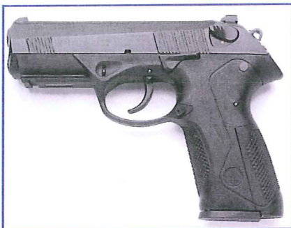
De Beretta Px4 Storm. Het is niet alleen een potentieel politiepistool, maar ook een fraai stukje industrieel design.