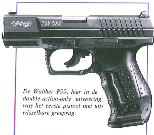
De Walther P99, hier in de double-action-only uitvoering was het eerste pistool met uitwisselbare greeprug.

grote voordelen op het gebied van service en onderhoud, en waarschijnlijk een aardige kostenbesparing op onderdelen. We zullen zien. Wie kunnen we verder op het lijstje zetten? Er is een aantal pistolen dat tot de mogelijkheden behoort: bijvoorbeeld de Walther P99, de Heckler & Koch P30, de SIG-Sauer P250, de CZ 75 SP-01 en de Beretta Px4 Storm. Al deze wapens komen uit Europa, hebben kaliber 9 x 19 en allemaal zijn ze voorzien van een Weaver of Picatinny rail voor de