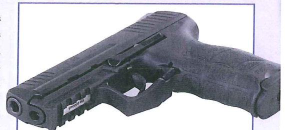
De Heckler & Koch P30 is als politiepistool ontwikkeld uit de P2000.

De patroontrekker in de rechterkant van de slede fungeert tevens als laad-