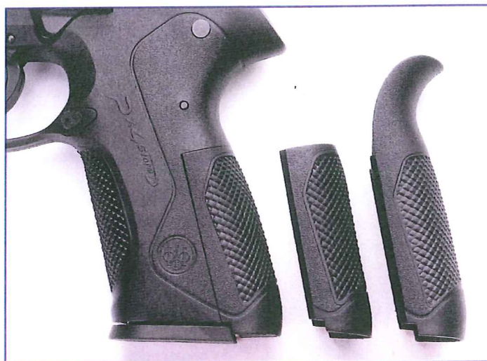
De Px4 Storm heeft ook een verwisselbare greeprug.

Dat weten we pas over een paar maanden. De kans bestaat dat het om geen van de hier voorgestelde pistolen gaat. Een keuze tussen deze wapens is overigens al moeilijk genoeg, want bij alle overeenkomsten zijn er ook fundamentele verschillen: een buitenliggende hamer of een hamerloos wapen, bijvoorbeeld. En wil de politie een SA/DA pistool, een double-action-only, een ontspanhefboom, of voorspanmogelijkheid? Hoeveel patronen zijn genoeg, 15 of moeten het er 20 worden? Die vragen zullen nog niet zo gemakkelijk te beantwoorden zijn. We wensen de dames en heren van de selectiecommissie veel succes.