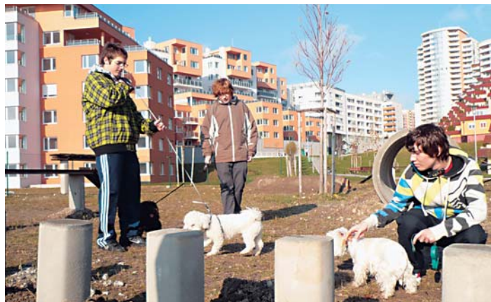
Raj pre psíkov na Zemi.

Ide o pilotný projekt, ktorý ak sa uchyťí, chceme realizovať aj v iných lokalitách mestskej časti. Vaše námety a pripomienky k novovybudovanému ihrisku vítame a budú pre nás cenným informačným zdrojom či sa uberať touto cestou pri riešení problému spolunažívania psičkárov s majoritnou väčšinou nepsičkárov.