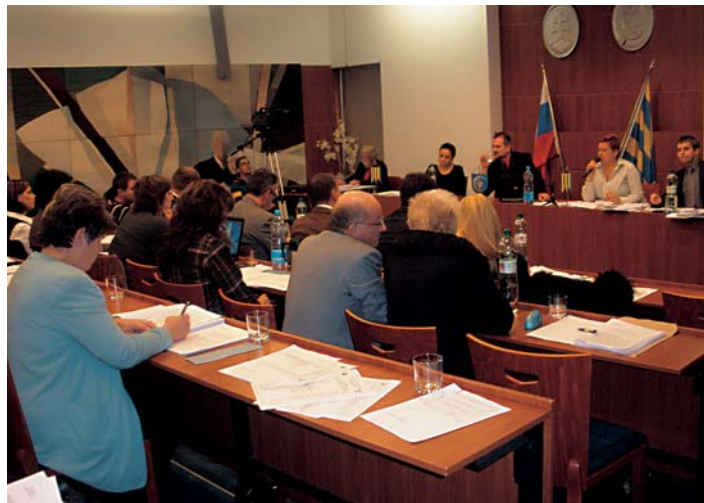
Posledné rokovanie zastupiteľstva v tomto zložení.