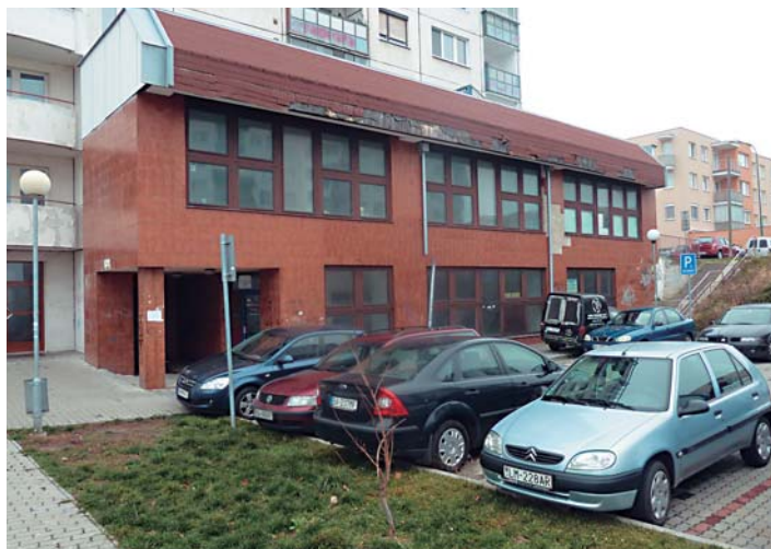
V tejto budove bude nový klub pre mládež ako aj seniorov.

Starostka týmto vyzýva mládež, ktorá má záujem o využívanie týchto priestorov na klubovú činnosť, nech sa prihlásia emailom na sekretariát: andrea.bolikova@karlovaves.sk. -ds-