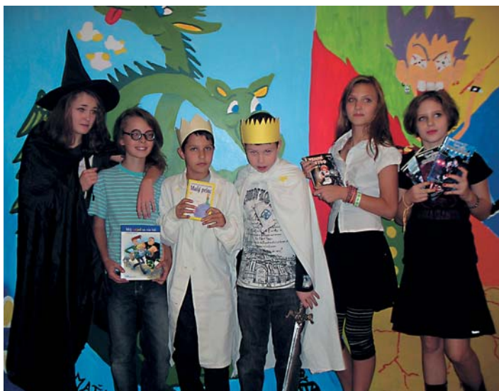
Na ZŠ A. Dubčeka usporiadali podujatie k medzinárodnému dňu školských knižníc.