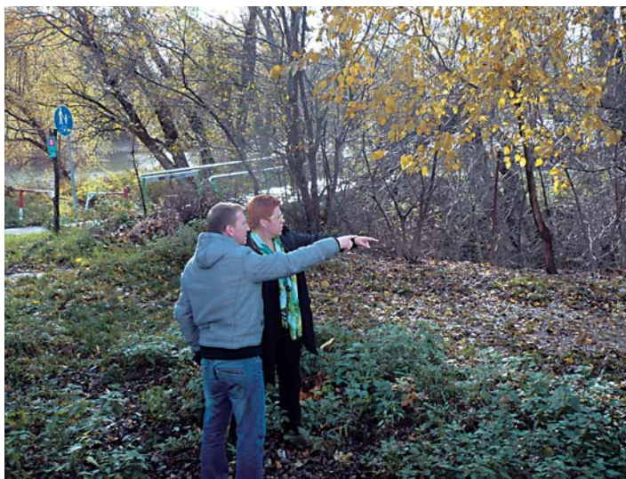
Zátoka bude vždy verejná.