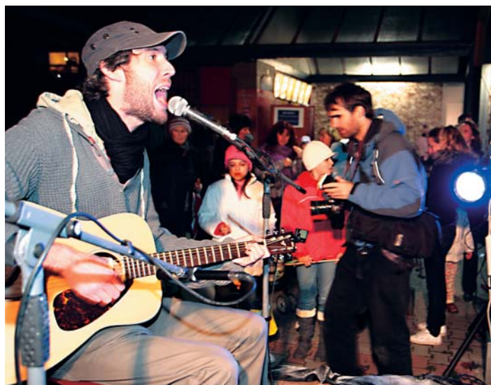
Synovec legendárneho McCartneyho hral strýkove hity, lebo má rád Karlovu Ves.