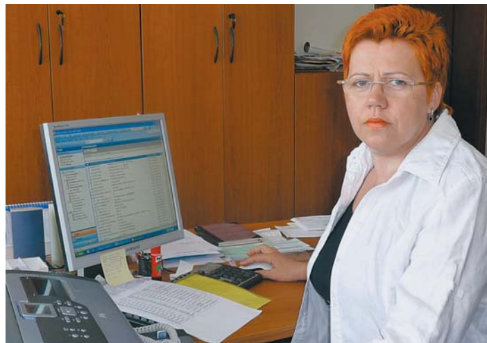
Starostka si každú otázku prečíta.

na posledné rokovanie miestneho zastupiteľstva som predložila materiál, ktorý súvisí priamo s Karloveskou zátokou. Podľa tohto materiálu bude vybudovaná nová prístupová účelová komunikácia, ktorou sa bude môcť verejnosť pohodlne dostať ku Karloveskej zátokke. Zároveň v súčasnosti pracujeme aj na novej a modernej