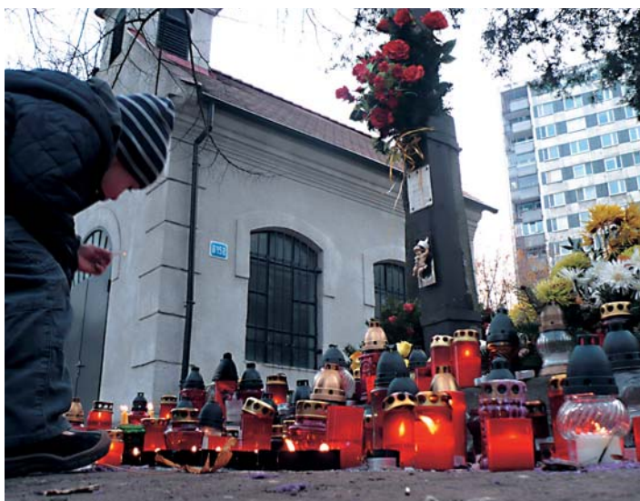
Na pamiatku zosnulých sa veriaci odobrli na starý karloveský cintorín, kde sa uskutočnila dušičková pobožnosť pri križi.