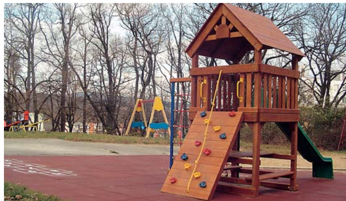
Nový domček na stračeji nôžke.