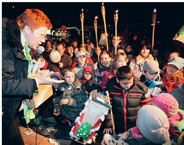
Za vlastnoručne vyrobený lampión bola odmena.