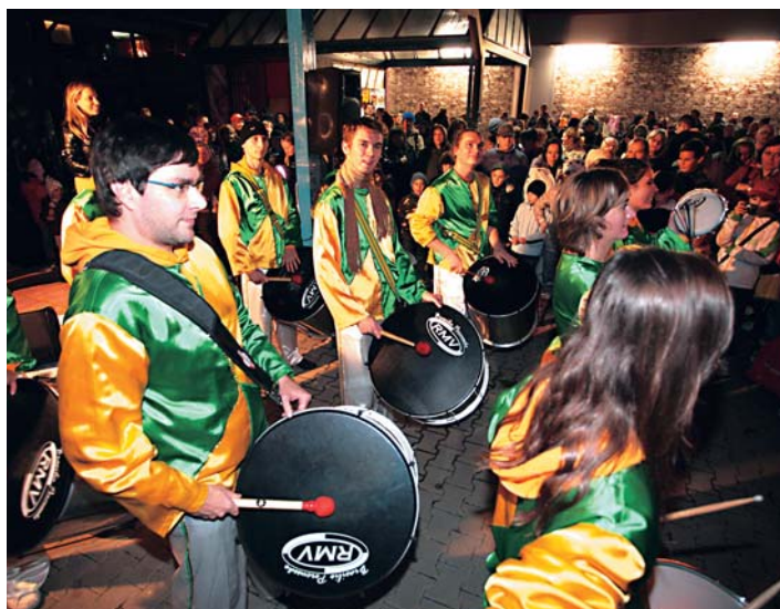
Bubnová show spestrila večer svetiel a lampiónov na Dlhých dieloch.