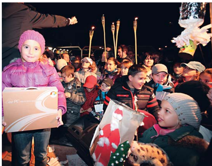
Najskôr som stratila maminu, ale potom som našla nový notebook. Vyhrala som!