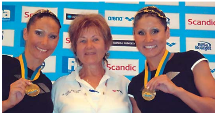
„Zlaté“ dvojčky Allárové vďaka za úspech mame, ktorá je ich trénerkou.

Trénujeme 6x do týždňa a niektoré dni aj dvojfázovo. Tréning pozostáva z prípravy na suchu, kde je zahrnuté posilňovanie - fitness, ohybnosť, stre-