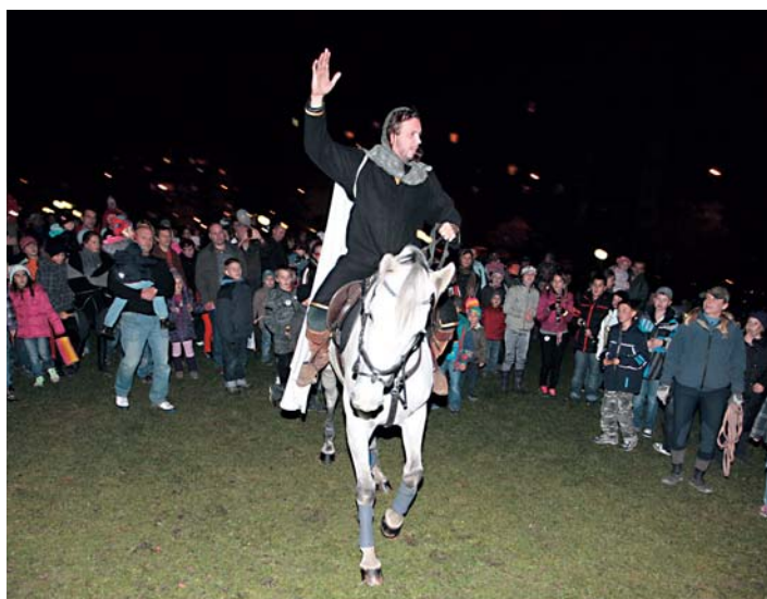
Martin na bielom koni prišiel, ale snehovú perinu nepriniesol.