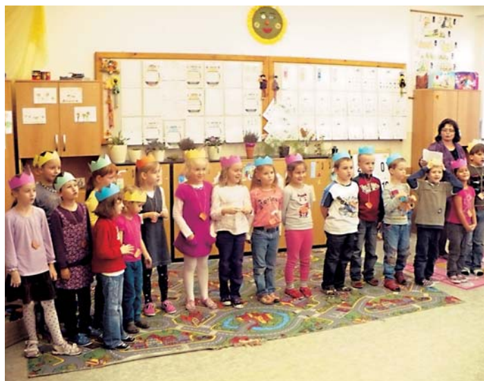
My už nie sme škôlkári, už sme veľké deti – Pasovanie prvákov 4.11.2010 ZŠ Veternicová 20.