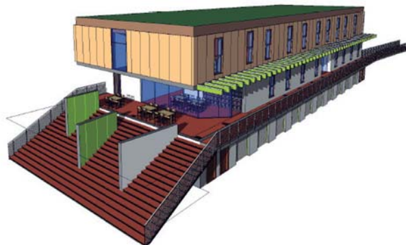
Lodenica je projektovaná ako moderná stavba 21. storočia.