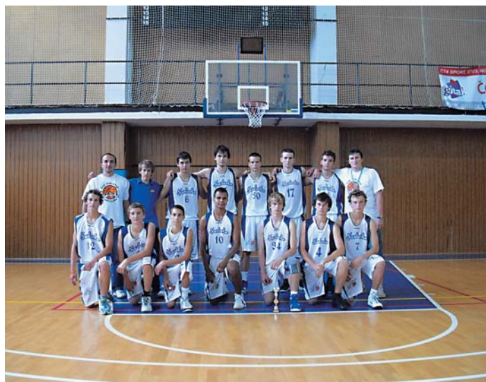
Kadeti MBK Karlovka bez prehry na čele tabuľky (10 výhier, 0 prehier). Gratulujeme!