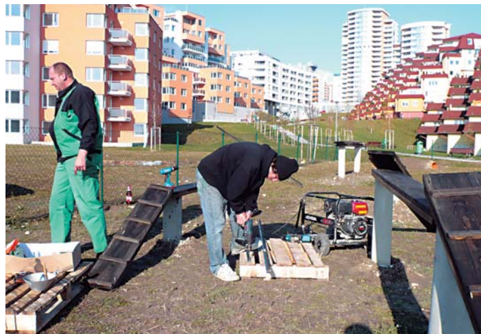
Psy budú mať konečne priestor, kde ich radi uvidia aj mamičky.

Po vzore iných častí Bratislavy sme aj v našej mestskej časti rozbehli projekt ihrísk pre psov. Hľadali sme viaceré miesta pre ich umiestnenie, pričom podmienkou bolo, aby pozemok bol v majetku alebo správe mest-