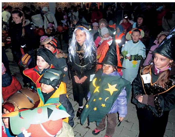
Na Halloween párty prišlo množstvo rozprávkových bytostí.