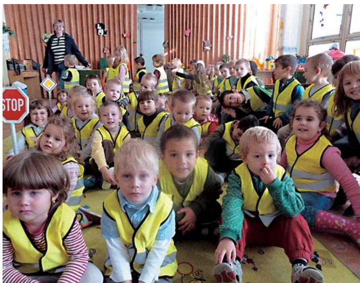
Aj deti z MŠ Kolískova sa budú prechádzať bezpečne.