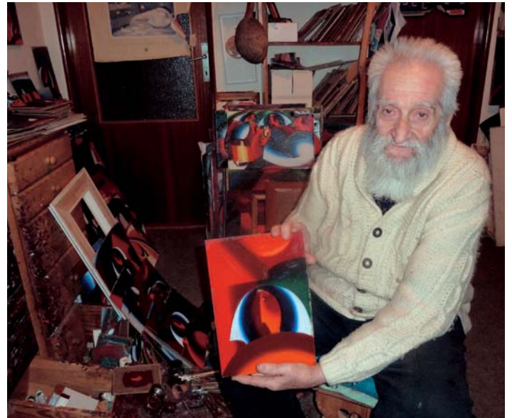
Majster vo svojom ateliéry.

Svojím umením sa Milan Láluha zaradil medzi najväčšie osobnosti umeleckého sveta, ďaleko presahujúce hranice krajiny. V roku