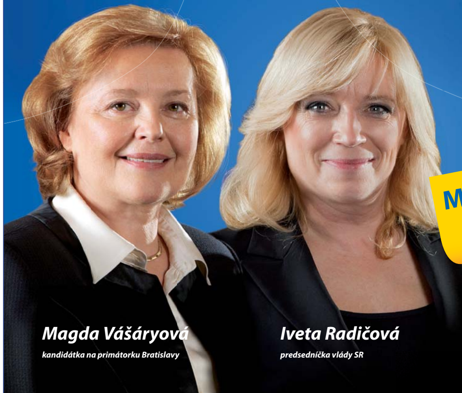
Magda Vášáryová kandidátka na primátorku Bratislavy