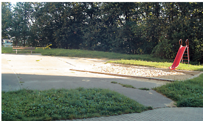
Pôvodné ihrisko už deti nebavilo.