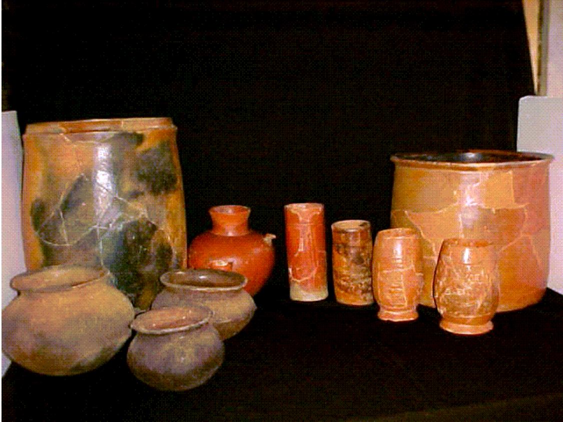
Figura 6 Algunas vasijas luego del proceso de restauración