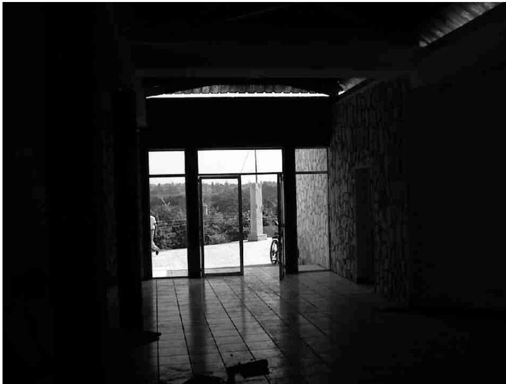
Figura 5 Vista del Museo Regional del Sureste de Petén