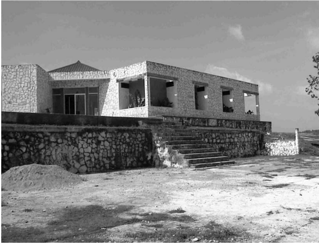
Figura 2 Vista del Museo Regional del Sureste de Petén