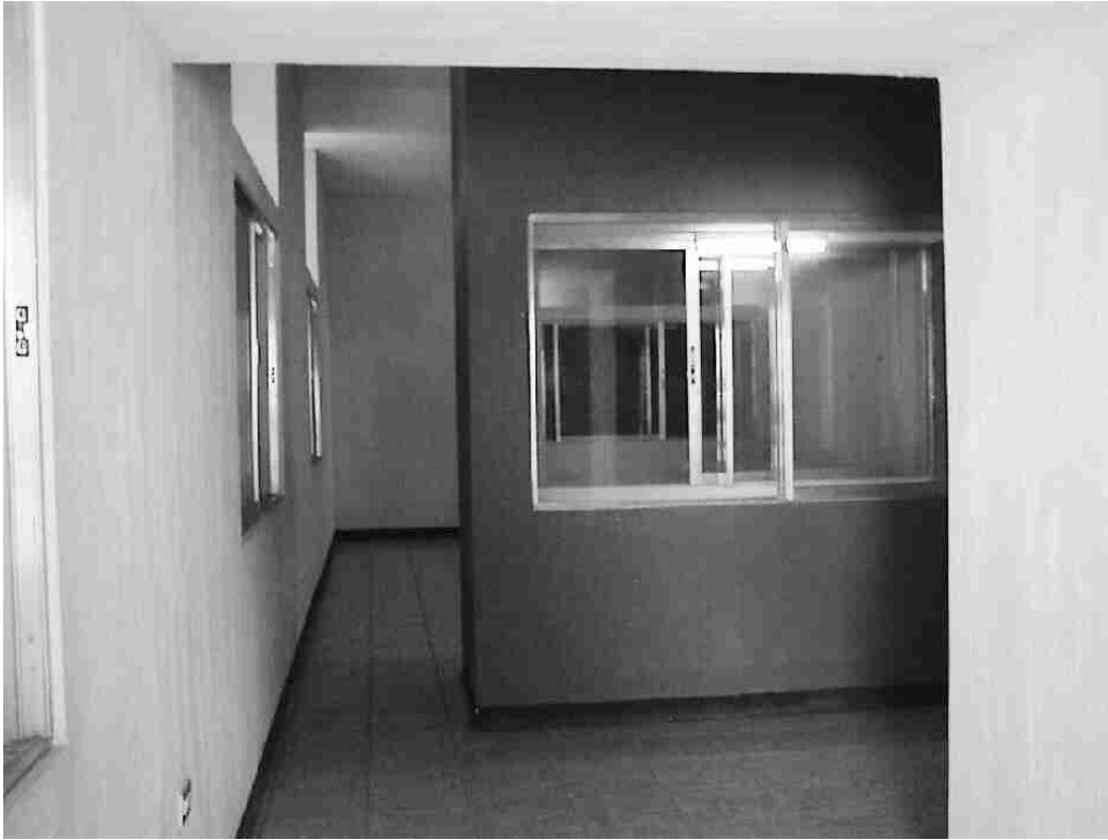
Figura 4 Vista del Museo Regional del Sureste de Petén