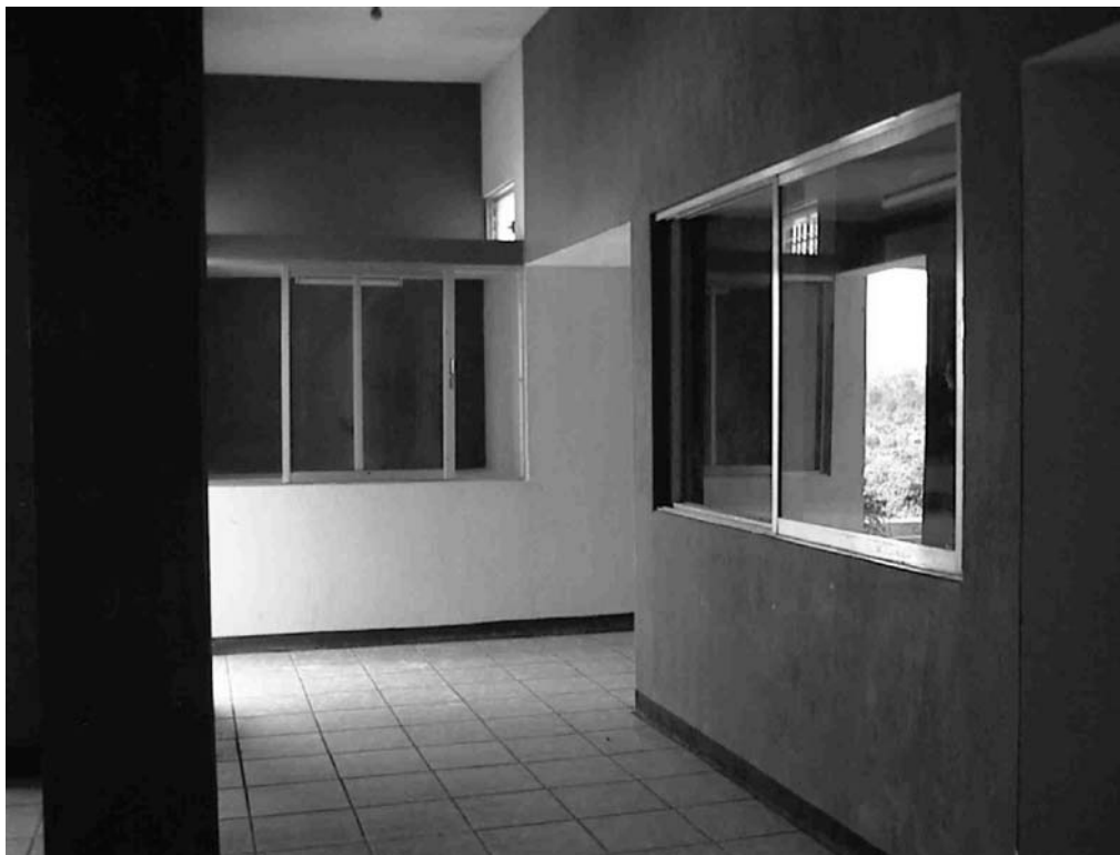
Figura 3 Vista del Museo Regional del Sureste de Petén