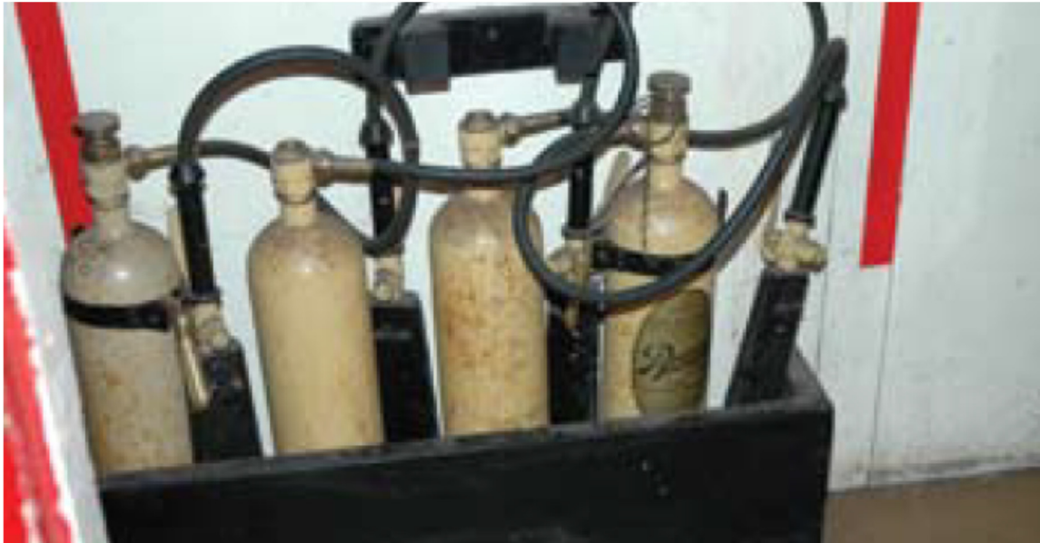
Uno de varios juegos originales de extintores de incendios

*Se entiende por buque una embarcación de más de 12 pasajeros.