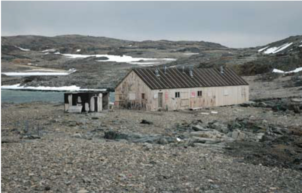
Vista de la cabaña desde el nordeste, con un canil en primer plano