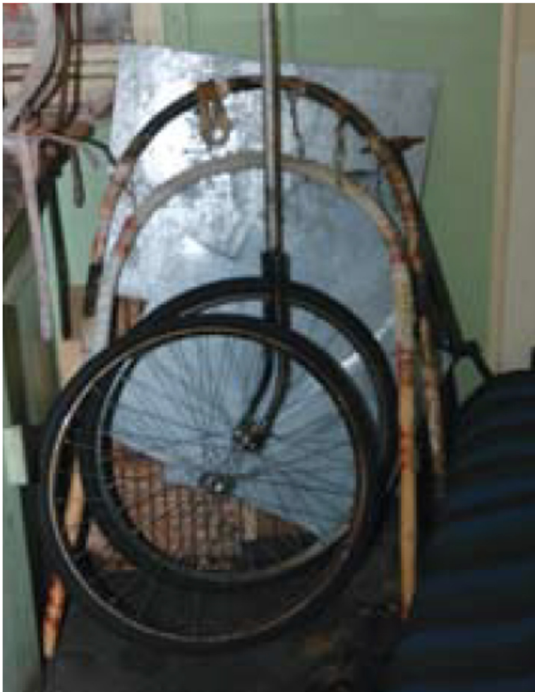
Ruedas de bicicleta utilizadas para fabricar cuentakilómetros para medir la distancia recorrida por los trineos

*Se entiende por buque una embarcación de más de 12 pasajeros.