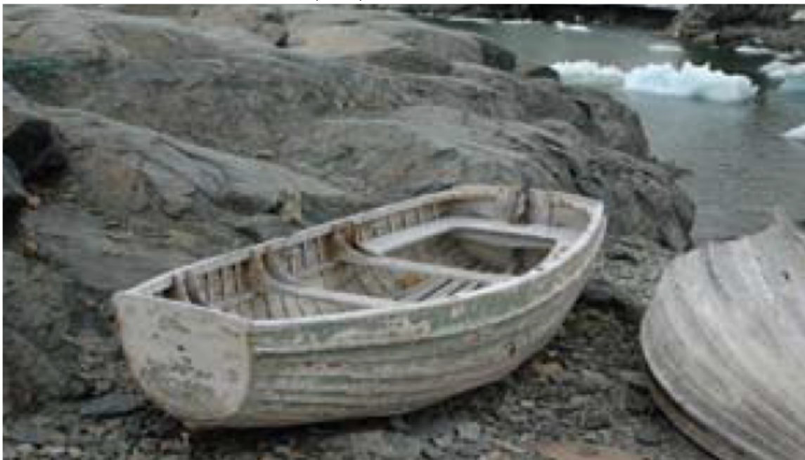
Botes de madera en la costa de la caleta

*Se entiende por buque una embarcación de más de 12 pasajeros.