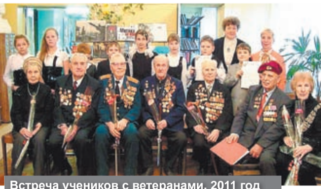
Встреча учеников с ветеранами. 2011 год