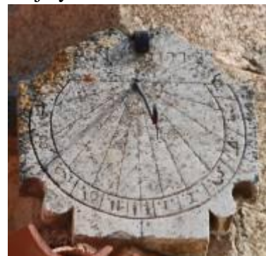
Ahedo del Butrón, 1773.

A.- San Mamés de Gallejones de Zamanzas.