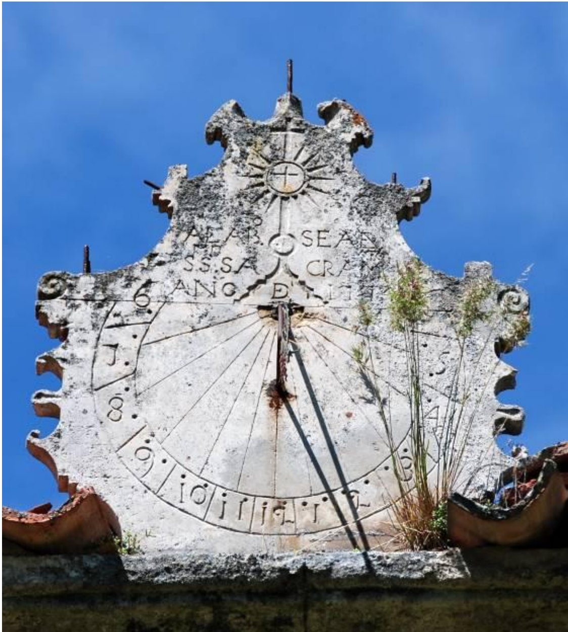
Circular. Vertical a mediodía orientado.

Está grabado en una placa de piedra de bordes recortados que recuerdan la silueta de un escudo incompleto porque en la parte superior ha perdido varios apliques ornamentales de los que tan solo quedan los vástagos de sujeción. La zona ancha inferior de la placa de piedra la ocupa el reloj de sol, en la parte superior lleva grabada en hueco una custodia y una oración - ALABADO SEA EL SANTISIMO SACRAMENTO- , ambas alusivas a la adoración eucarística, y la fecha: AÑO 1774.