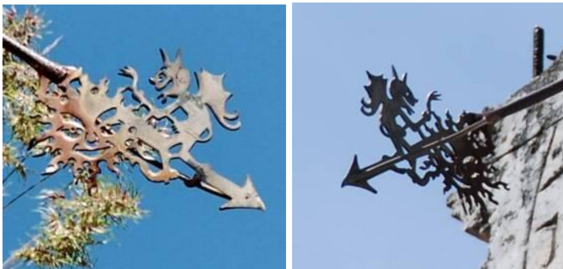
Reloj 3. Detalle. Extremo de la varilla. Diablo, sol y punta de flecha.

- Varilla: Cristo y diablo, luz y tinieblas, bien y mal