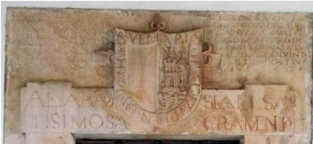
Quintana de los Prados. Capilla de los BEGA AZCONA.

Inscripciones en una capilla de la iglesia de Quintana de los Prados: