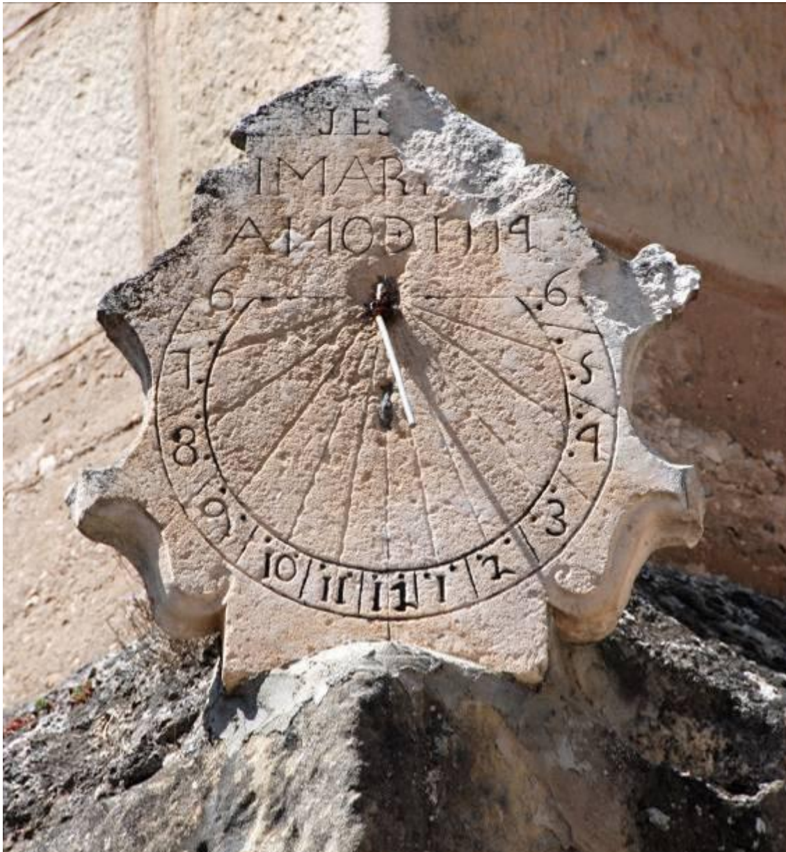
Circular. Vertical a mediodía orientado.

Está grabado en una placa de piedra arenisca de base recta y bordes recortados de dibujo más complicado que la del reloj de la iglesia del cercano pueblo de Ahedo del Butrón, obra del mismo artífice, construido en 1773. El borde superior de la placa ha sufrido desperfectos debido a la erosión o a algún desprendimiento. La zona ancha de la placa de piedra la ocupa el reloj de sol, en la parte superior lleva grabadas la leyenda JESÚS I MARÍA y la fecha, AÑO 1774.