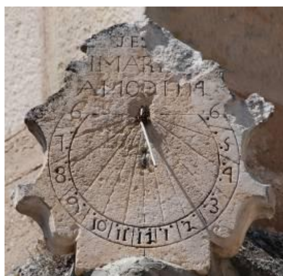
Gallejones de Zamanzas, 1774. Tubilleja de Ebro, 1774.