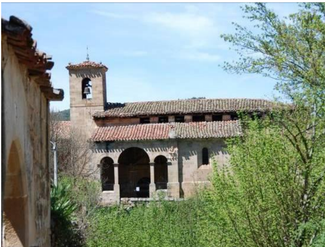
Reloj de sol situado en la esquina suroeste del tejado de la capilla de los Gallo.

Iglesia del siglo XVI de una sola nave con la capilla señorial de los Gallo y la sacristía, abiertas al muro sur, cabecera recta, torre cuadrangular a los pies y pórtico de tres arcos.