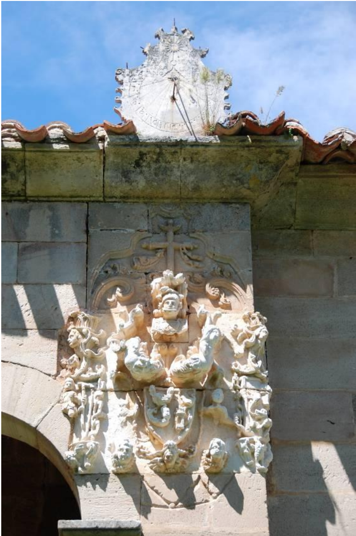
Pilastra izquierda de la capilla. Armas de los Gallo. El reloj de sol sobre la cornisa.