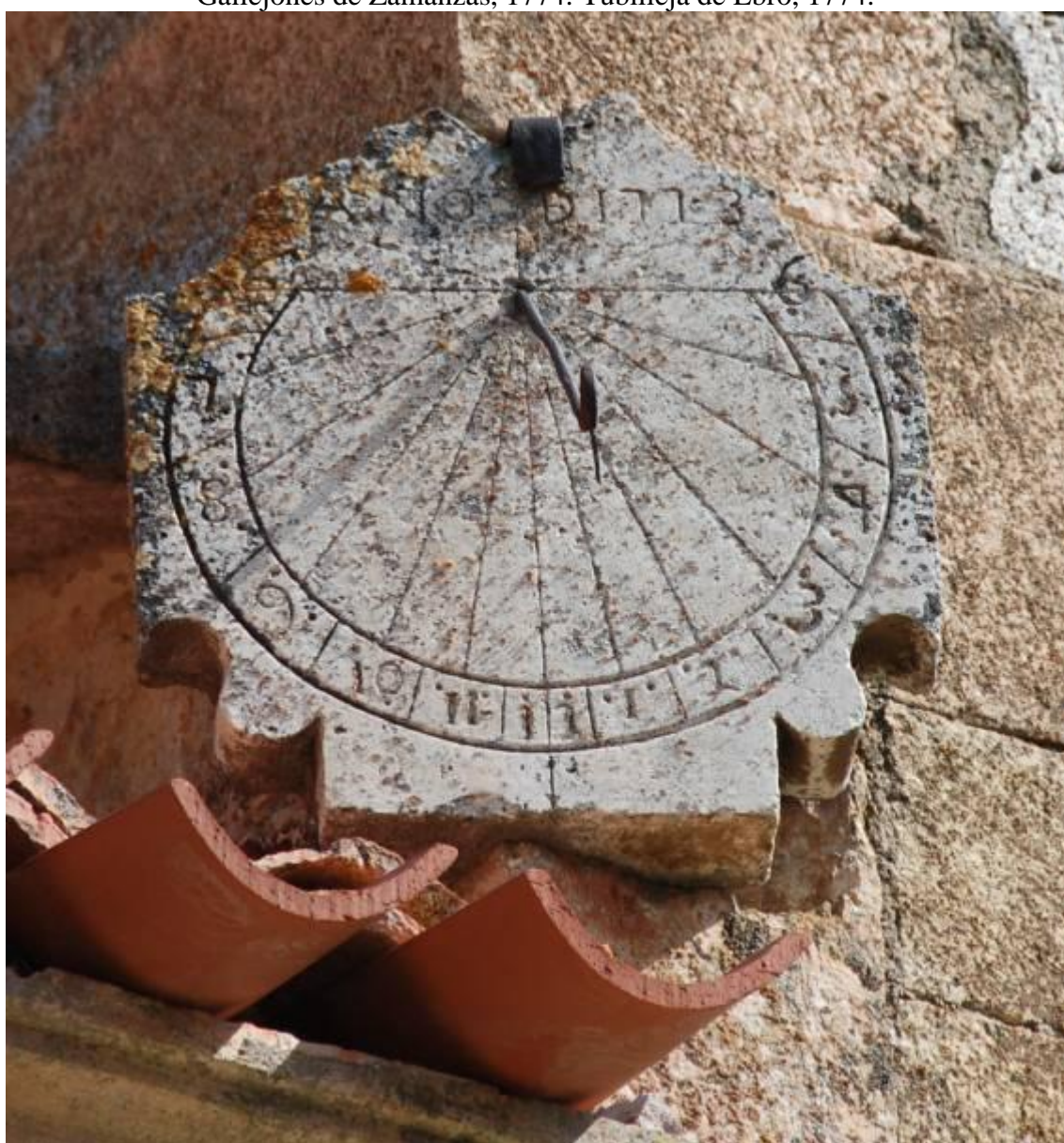
Circular. Vertical a mediodía orientado. Año de 1773.