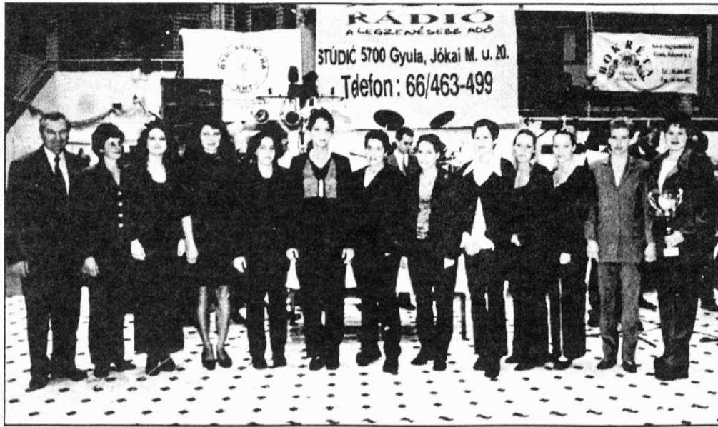
A Hajrá Alapítvány egyik díjazottja, a Gyulai SE NB I B-s női kézilabdacsapata