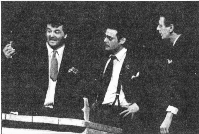
Jelenet az előadásból

tűnően gyakran idéznek meg egy-egy előadás erejéig a várszínház kamaratermében, tegyük hozzá: hála Istennek, a maga Gyulán lassan megszokottá váló stílusában a humor felé viszi el a dolgot. Ez a humor azonban természetesen túlmegy a „nagy nevetetők” sorozat klasszikus „arconnyomnak valakitegyortával” vagy „hasraesikvalakiacipőfűzőjében” típusú gégein.