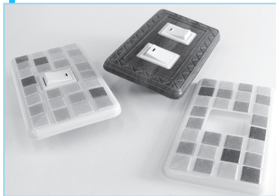
▲部屋の雰囲気やインテリアに合わせて、簡単にイメージチェンジできるスイッチカバー